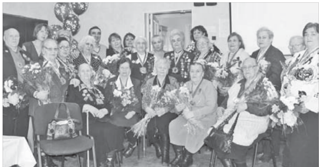
Низкий вам поклон за ваш великий подвиг!

Низкий вам поклон за ваш великий подвиг, живите долго, и пусть хранит вас Господь!