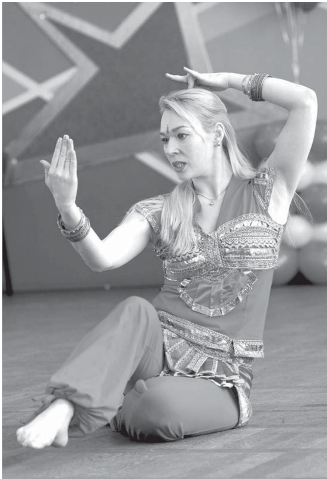
О чувствах можно рассказать языком индийского танца

Предельный объем муниципального долга Таймыра на этот год уменьшился. Источники финансирования дефицита районного бюджета уточнены.