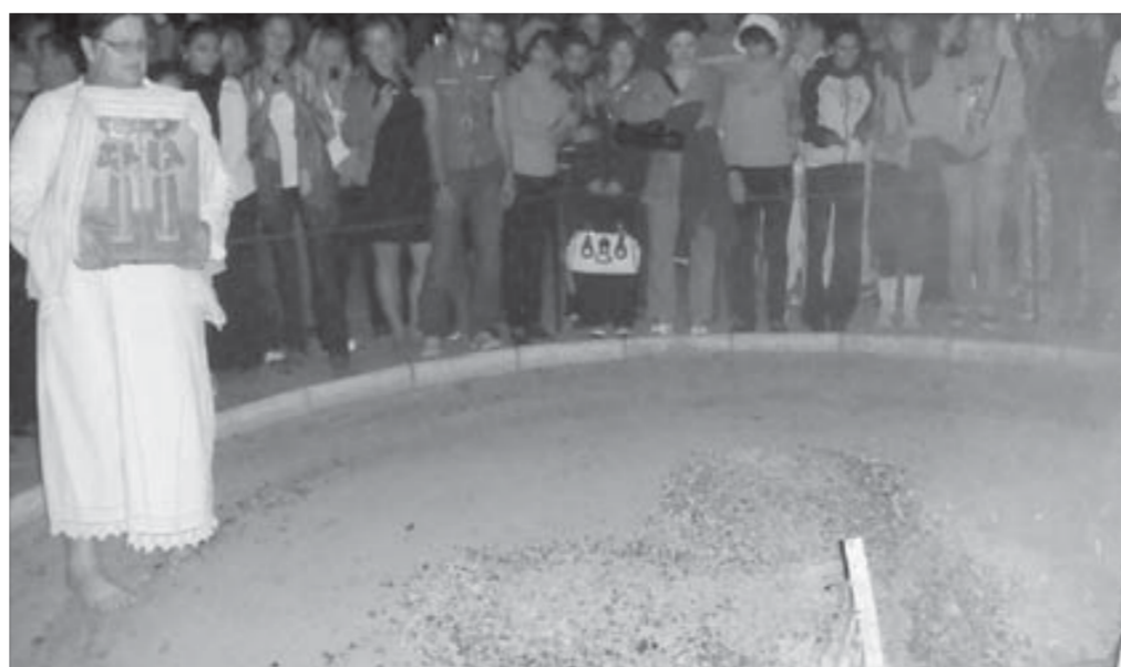
Нестинарки впечатлят кого угодно