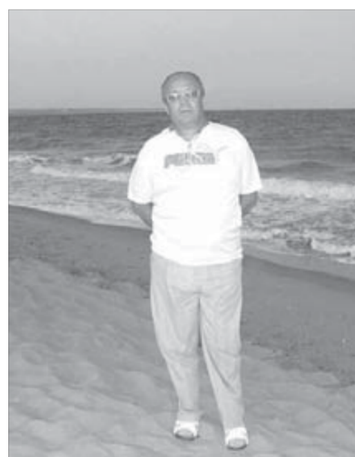
Норильчане в восторге от пляжа