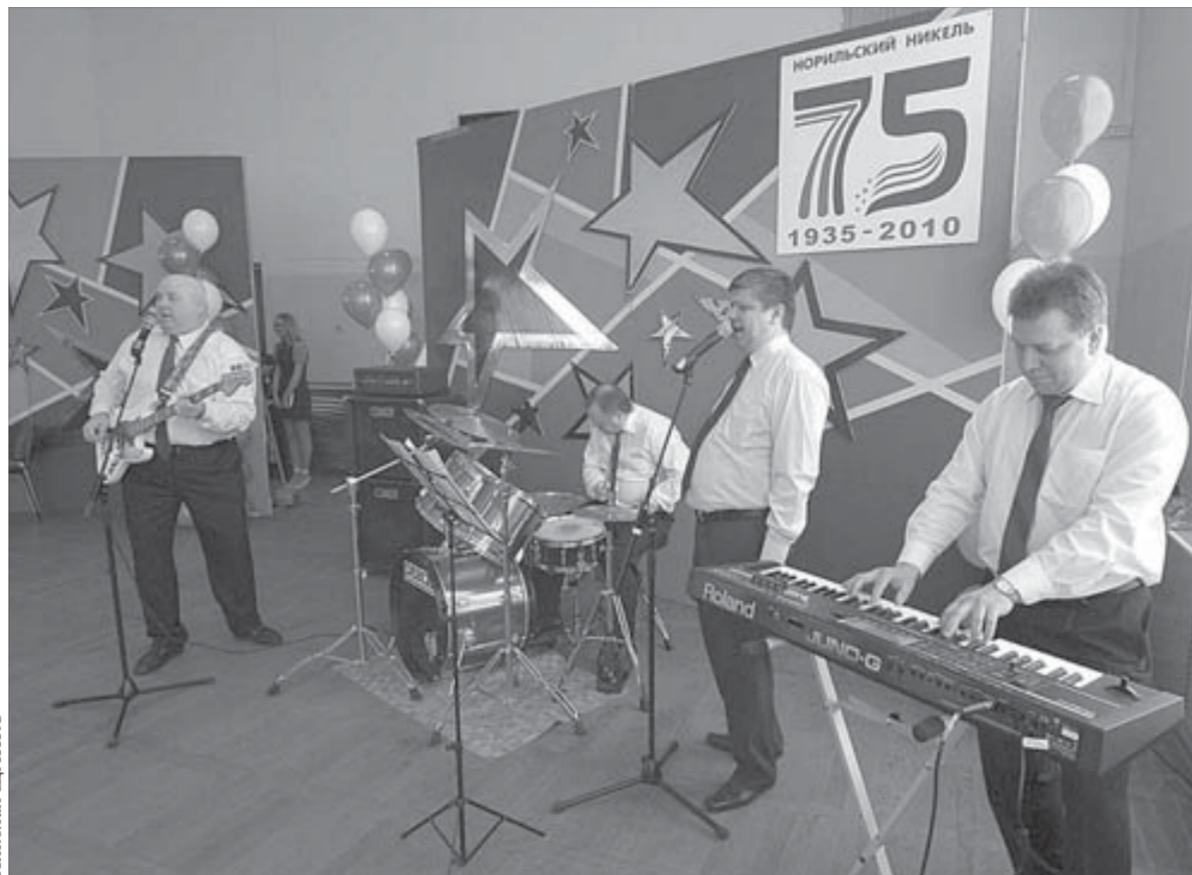
ВИА механического завода погрузил в атмосферу 80-х