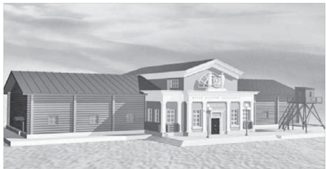
Проект музея: сталинский ампир и лагерьный бар