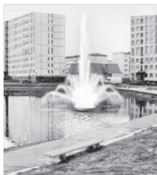
Фонтан будет плавать

В других планах норильских архитекторов – восстановление известных каждому норильчанину ворот на стадионе «Заполярик». Эскизы уже готовы, дело лишь за подрядчиком и финансированием.