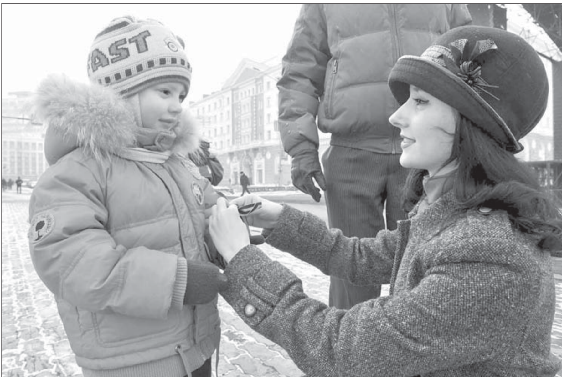
Детям ленточки особенно понравились