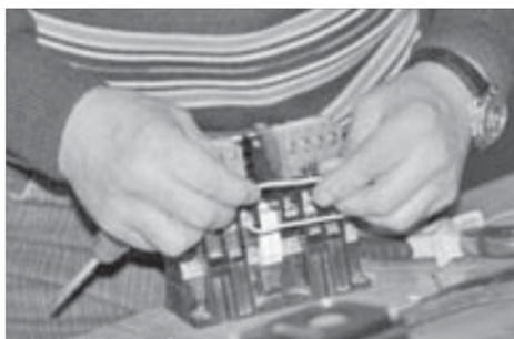
Знать на ощупь

В цехе ООО "Спецэлектромонтаж" прошел конкурс профессионального мастерства на звание "Лучший наставник – электрослесарь по ремонту оборудования". За ходом состязания наблюдал корреспондент "Заполярного вестника".