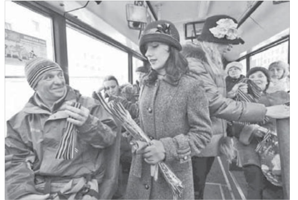
Норильчане с радостью брали несколько ленточек – для себя и близких