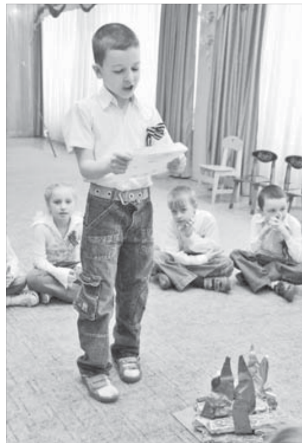
Фронтовые письма у детсадовского "костра"

Но детские обиды – это ничто по сравнению с тем, что несет в себе война. Об этом еще раз напомнили ребятам ветераны, а сами дети прочитали стихи с такими словами: "Лишь бы не было войны".