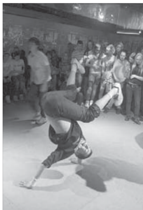
Это не просто танец, это – спорт

В "Клубе номер один" прошел ежегодный творческий фестиваль "Рэп-прорыв".