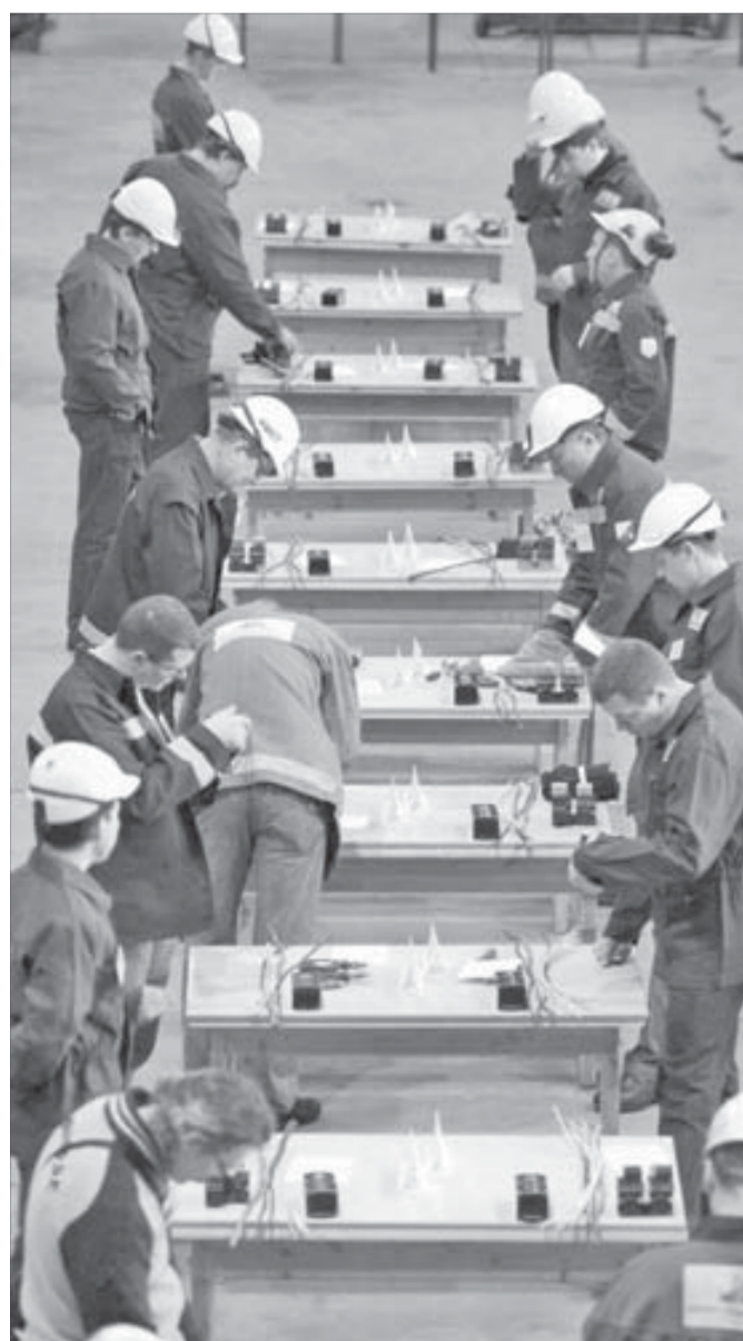
Приступать велено по команде

Участники выполняли задание, пользуясь стандартным набором инструментов электрика. Ничего принципиально нового для них экзамен не предполагал, но уложиться в норматив по времени удалось только семерым конкурсантам. Остальные оперативности предпочли качество.