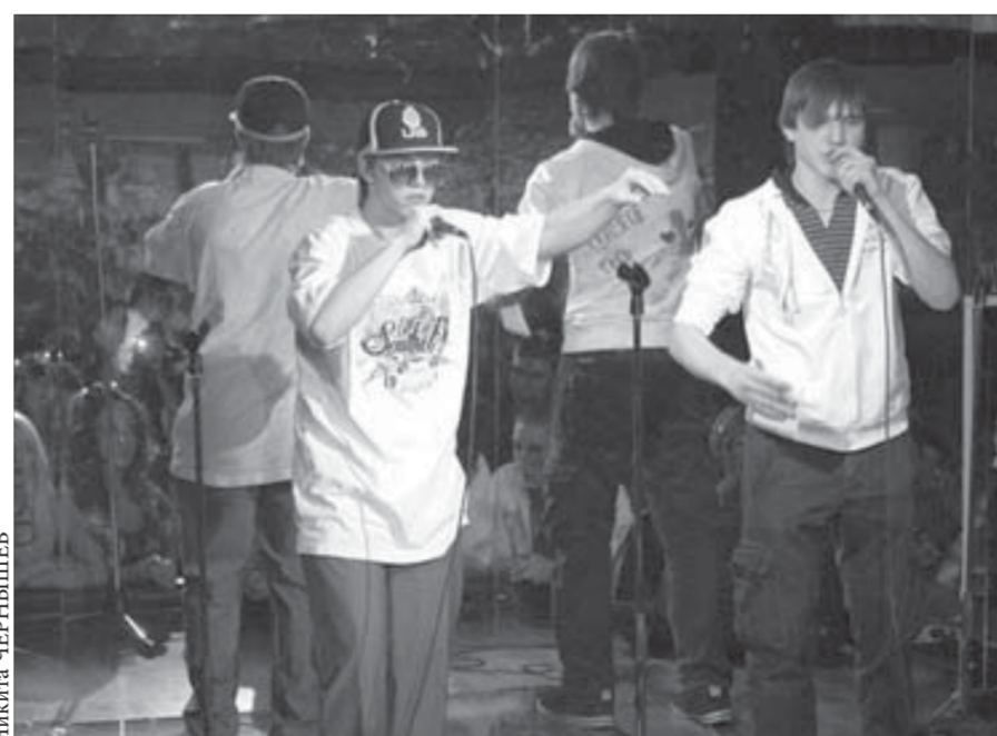
Много строк рэперы посвятили "этому городу"

В качестве гостей фестиваля на площадке "Клуба номер один" выступили норильские брейкеры. Им и победителям рэперам достались билеты на концерт группы "Каста", которая в мае приедет в Норильск, а также дипломы и подарки.