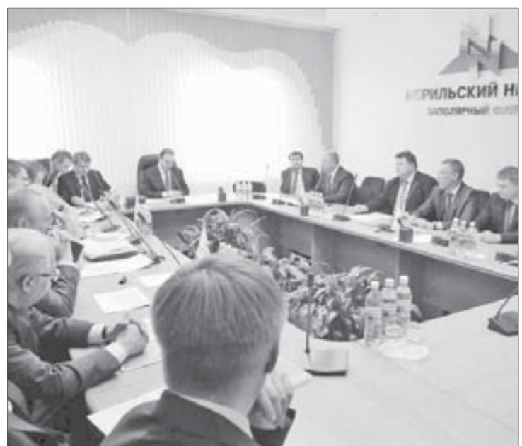
Документ на обсуждении

горного календаря должны быть включены планы по развитию обоганительного и металлургического переделов. На основе этой программы будут приниматься решения по дальнейшей производственно-экономической деятельности компании "Норильский никель".