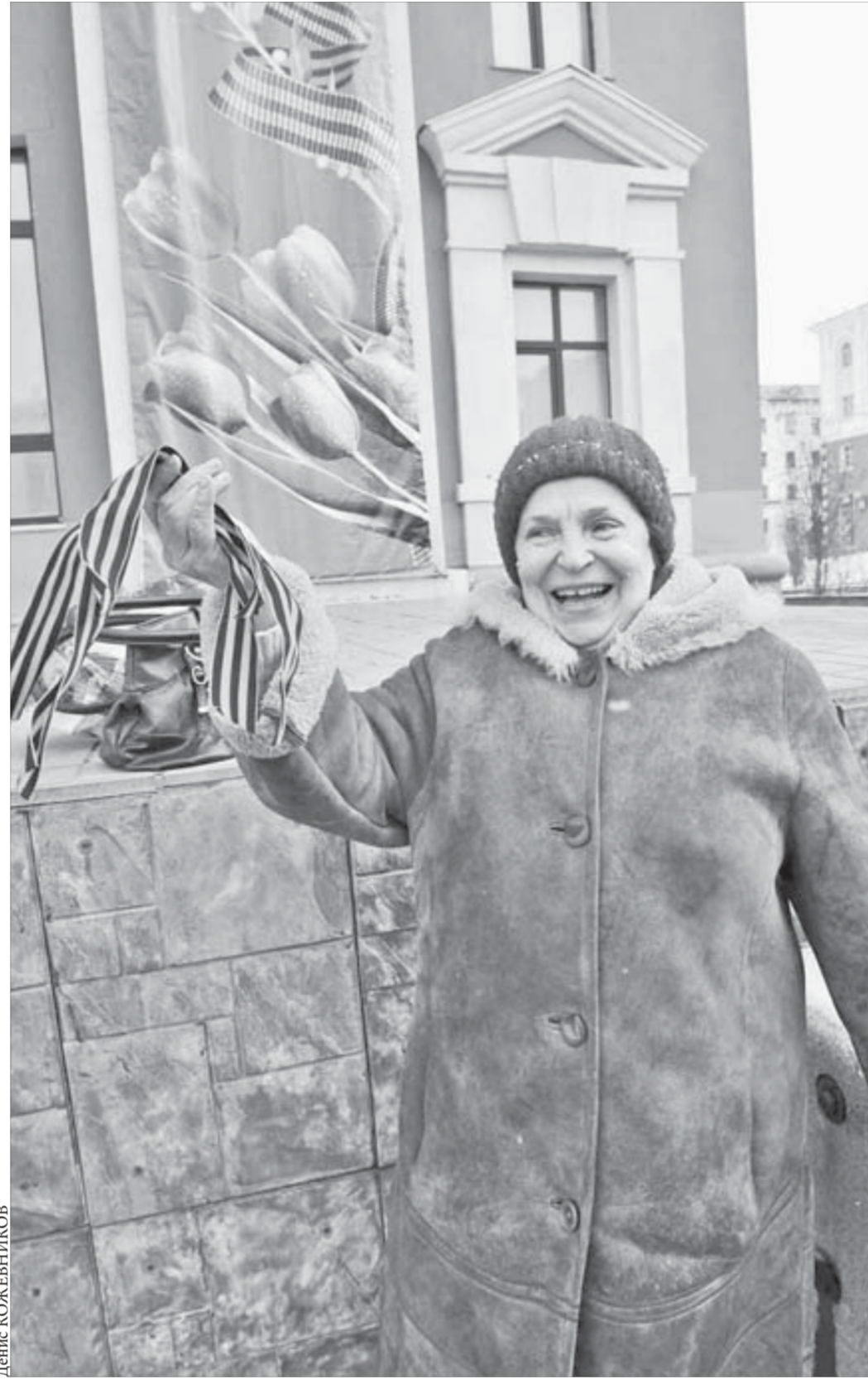
Символы Победы создают праздничное настроение

Народные гулянья и митинги, посвященные 65-летию Победы, пройдут также в Талнахе и Кайеркане: на площади Победы (начало в 13 часов) и на площади перед Домом спорта (14 часов). Для ветеранов организуют концерты, кинопоказ с 30%-ной скидкой на билеты (в культурно-досуговом центре им. В.Высоцкого) и праздничные обеды в кафе.