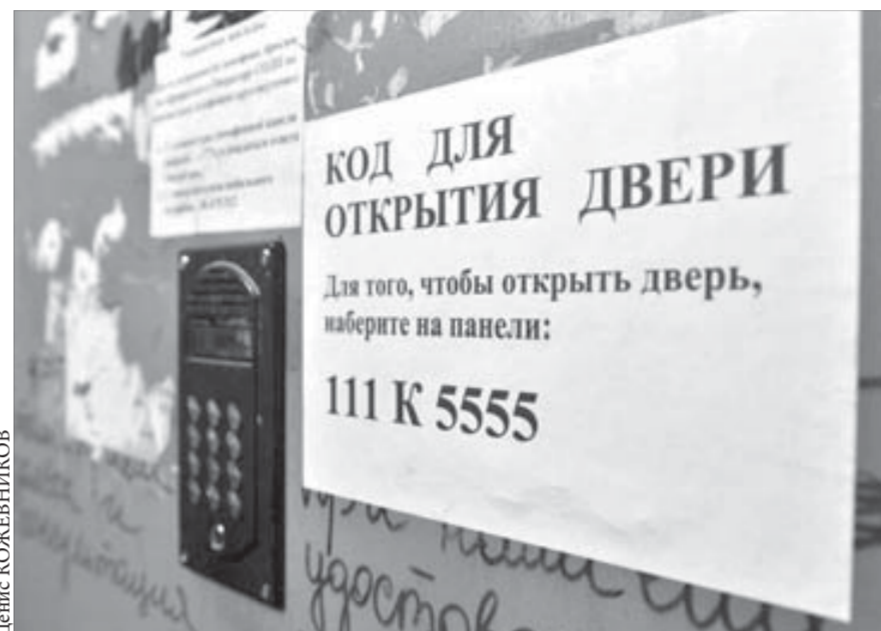
Пока материал готовился к печати, «Норильск Телеком» масштабно сработал на улице Комсомольской

Небольшое лирическое отступление: у моих друзей, проживающих на улице Севастопольской, код нацарапан прямо на металлической входной двери в под-