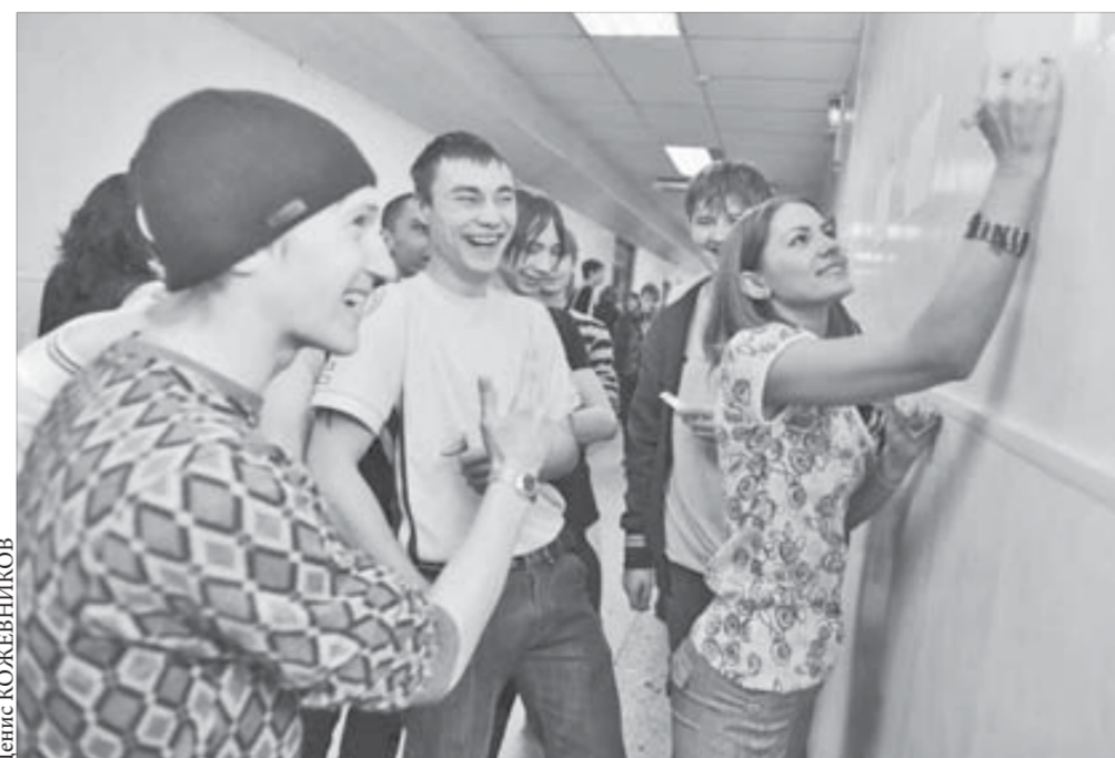
На стене лучше писать о добре