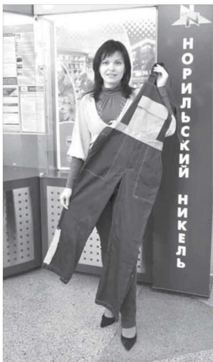
Этот вариант — лучший