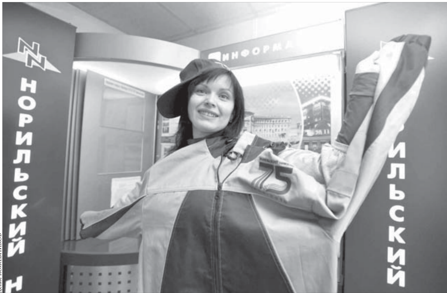
Хоть на конкурс красоты!