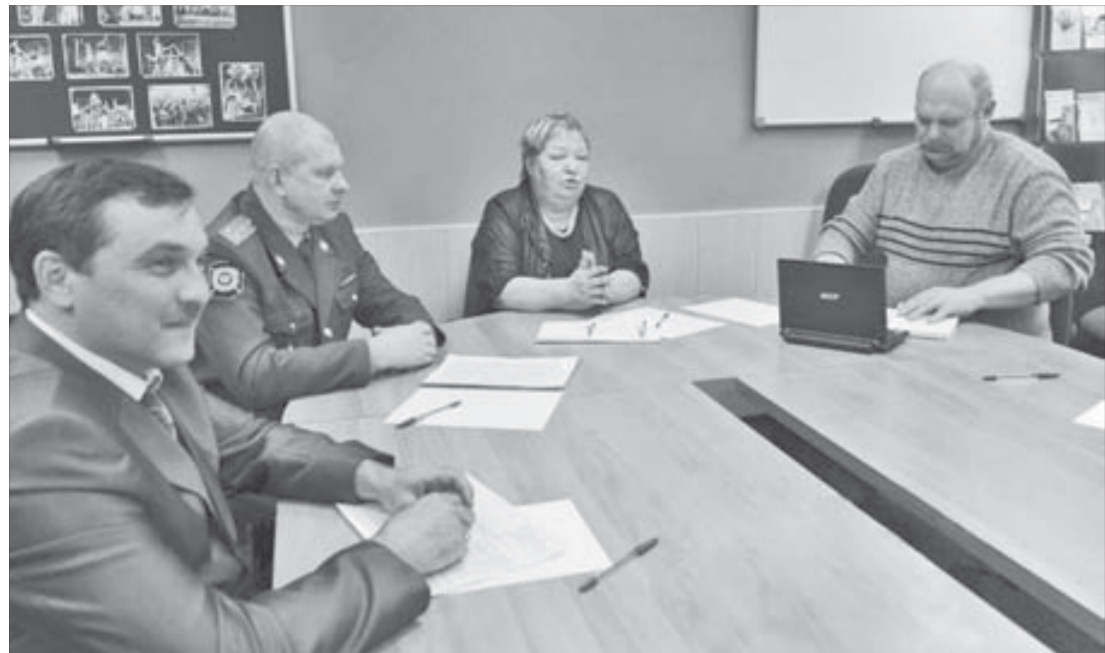
Прием в общественном совете будут вести представители общественных организаций, ветераны милиции, журналисты