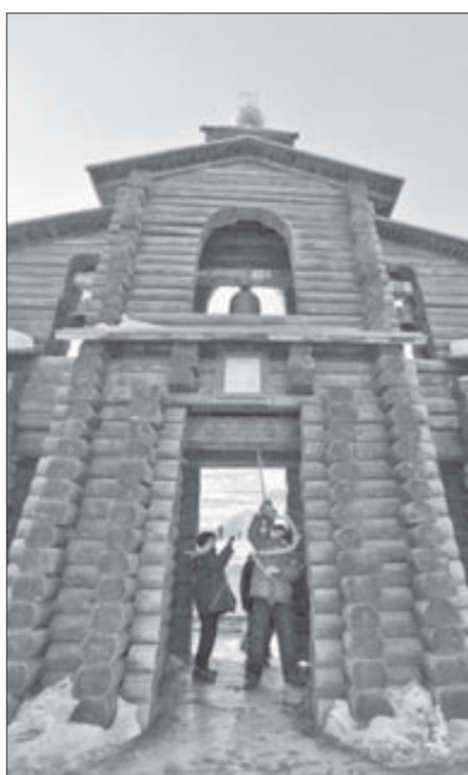
На “Толгофе” дудинцы ударили в колокол