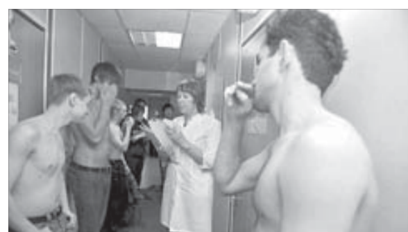
Здоровье призванных – главное для армии

В Красноярском крае начался весенний призыв. В эту кампанию будут призваны 4950 срочников. Большинство из них (почти 2,5 тысячи) будут распределены в Сухопутные войска, 641 – в ВМФ, 536 пройдут службу в ВВС, в Ракетных войсках будут служить 230 жителей края, в Железнодорожных – 175. В Президентский полк 14 мая будут отправлены 20 призванных. 2669 человек будут проходить службу на территории СФО, 194 – в Красноярском крае. Всего в ходе весенней кампании из региона будет отправлено 18 воинских эшелонов и 110 воинских команд.