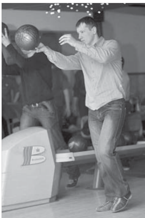
Хороший прицел – половина успеха