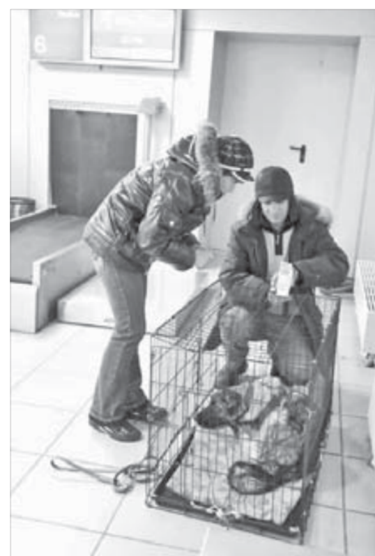
“Есть шанс, друг, полететь со мной в салоне”

– Перевозка домашних животных вне зависимости от того, берет пассажир животное в салон или перевозит в багажном отделении, является специальной услугой, стоимость которой рассчитывается дополнительно по действующим тарифам перевозки сверхнормативного багажа исходя из веса животного вместе с клеткой и оплачивается в кассах оплаты сверхнормативного багажа во время регистрации на рейс.