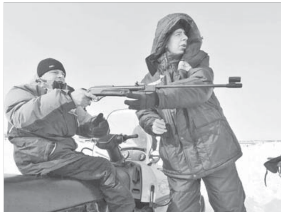
Помогать друг другу...

На турбазе ЦАТК прошли соревнования по механизированному биатлону. Случайный зритель вряд ли бы предположил, что в гонках на снегоходах и стрельбе из пневматического оружия соревнуются люди с ограниченными возможностями.