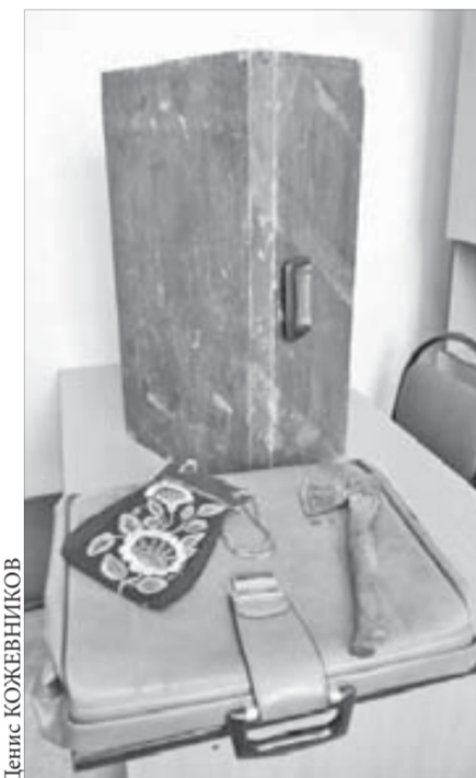
Теперь это предметы музейной коллекции