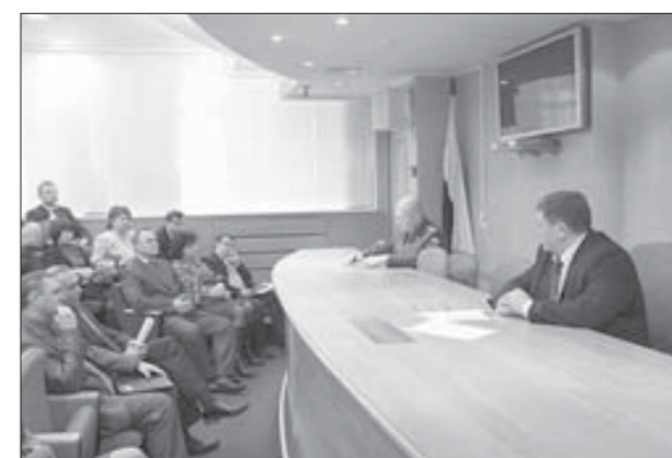
Население призвали к бдительности

О том, что думают о безопасности на территории норильчане, читайте на 3-й странице ►