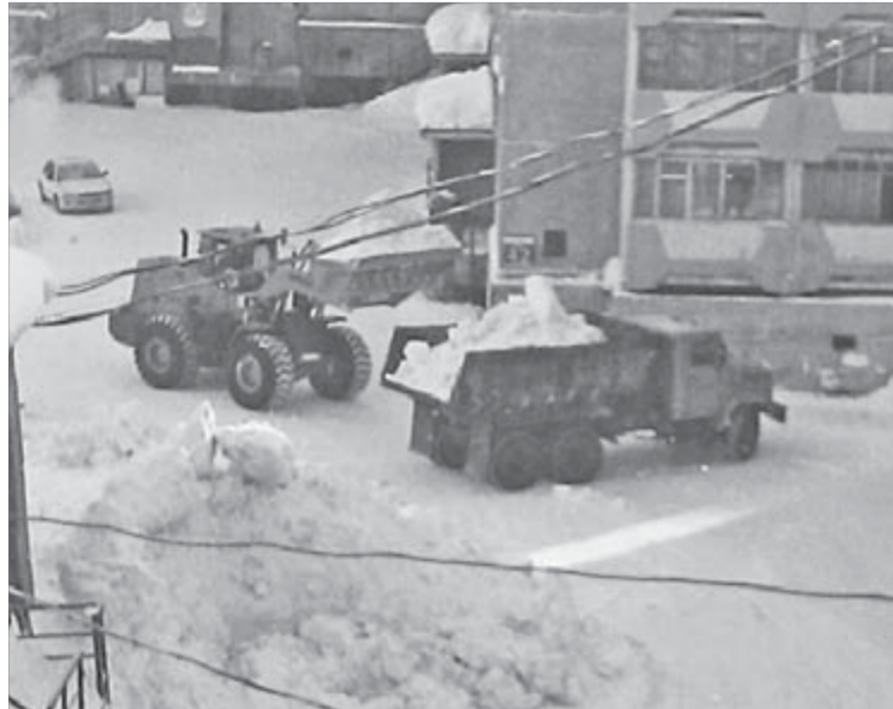
Игарская, 42: из двора вывозят снег