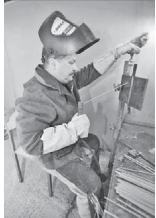
Вертикальный шов варят снизу вверх

Конкурс традиционно состоит из трех этапов: практического, теоретического и творческого. Главный, конечно же, практический. Рассказать, как надо варить, многие смогут. А сварить так, чтобы котел под давлением в восемьдесят четыре атмосферы гарантированно работал долгие годы, – единицы.