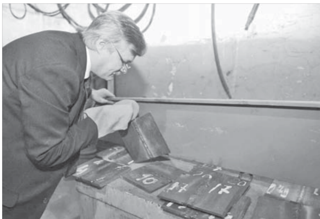
Качество швов председатель жюри проверяет придирчиво

В курилке окончившие практический этап сварщики-конкурсанты говорят за жизнь. Пред-