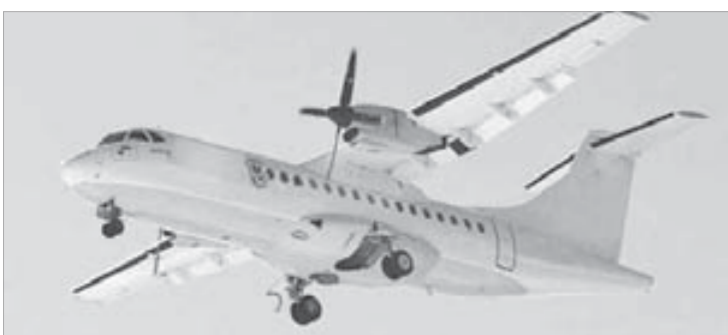
На АТР-42 будет легче и комфортнее добираться до городов края