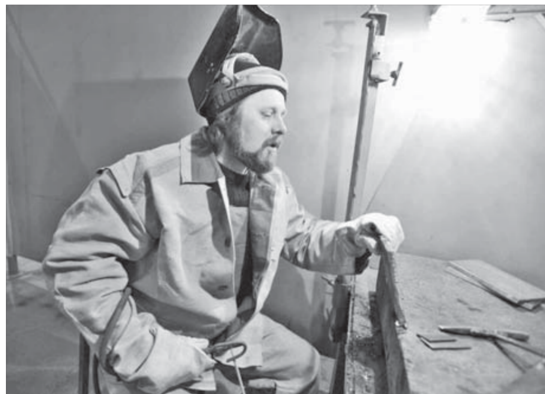
Сварщику нужны опыт и мастерство