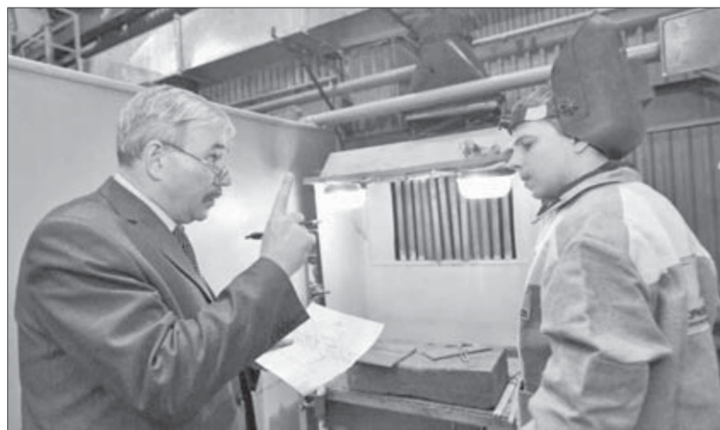
"Учите, судить будем строго"

Сварщики о себе всегда высокого мнения. Такая профессия. Кто есть кто в сварочной табели о рангах, выясняли 25 лучших сварщиков тринадцати предприятий группы "Норильский никель". Профессиональный конкурс "Лучший наставник-электросварщик" проходил в аудиториях корпоративного университета Заполярного филиала и в цехе обеспечения основного производства никелевого завода.