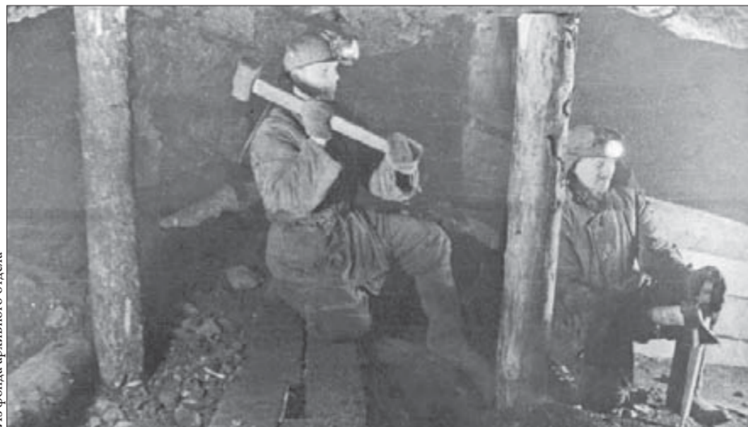
Рудник №2. Условия, в коротких работали забойщики, под стать военным. 1943 г.

Год 1943 выбран не случайно. Именно с него в истории нашей страны начался период победоносного завершения Великой Отечественной войны. К событиям, разворачивающимся на военных фронтах, Норильск имел самое непосредственное отношение. Стратегия комбината была обозначена еще в 1942 году заместителем наркома внутренних дел СССР Авраамием Завенягиным: «Главнейшая задача – как можно скорее, как можно больше дать стране никеля, меди, кобальта... Ваша работа полностью увязана с борьбой Красной армии».