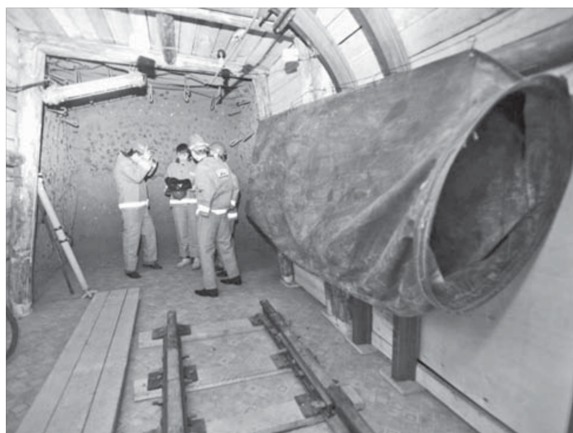
Почувствовать себя настоящим горняком можно в специальной аудитории-шахте

Новое оборудование, полученное ПУ-105 в рамках проекта «Образование», позволило сделать учебный процесс увлекательным и высокоэффективным. Но не только благодаря современному оборудованию учащиеся ПУ имеют возможность прикоснуться к производственным реалиям. Многие в училище сделано руками самих преподавателей, мастеров производственного обучения. Например... рудничный забой. В одной из аудиторий достоверно воссоздана обстановка настоящей шахты. Есть здесь и рельсовые пути с контактным проводом, и вентиляционный рукав, и несколько видов крепи: