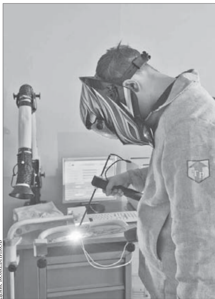
Параметры сварки контролирует компьютер