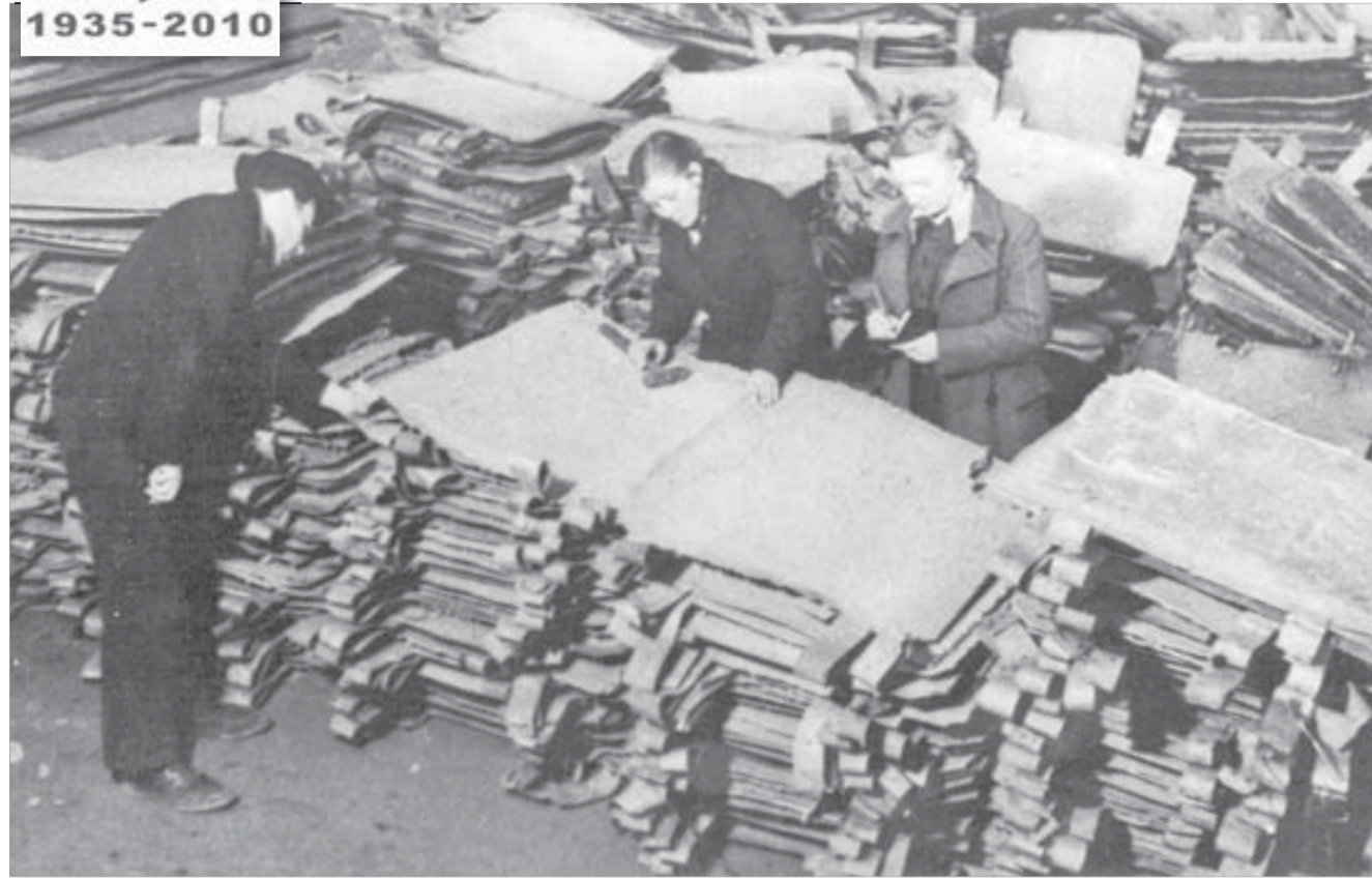
Учет катодного никеля на складе готовой продукции. 1943 г.