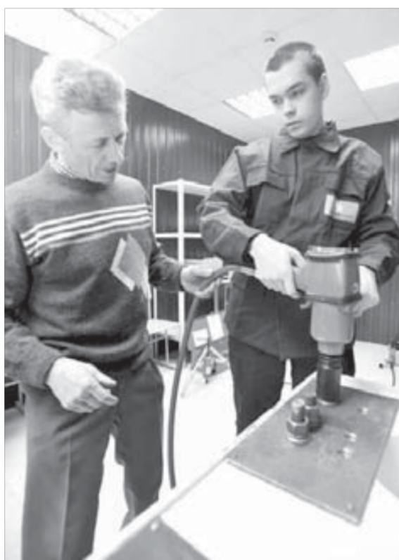
Такой пневматический инструмент не на всяком предприятии есть