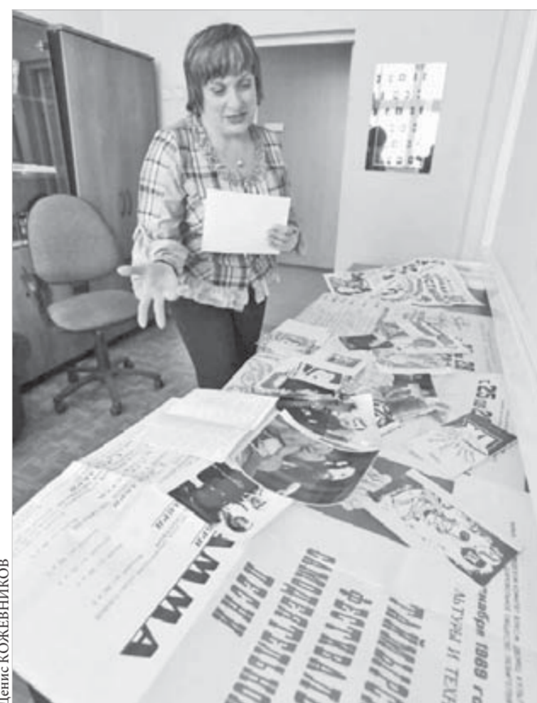
Вся история песни перед глазами

Не стоит откладывать до осени, уже сейчас можно приносить снимки в кабинет 312 Городского центра культуры. Авторы лучших работ получат награды, а по итогам конкурса в ЦК будет организована фотовыставка.