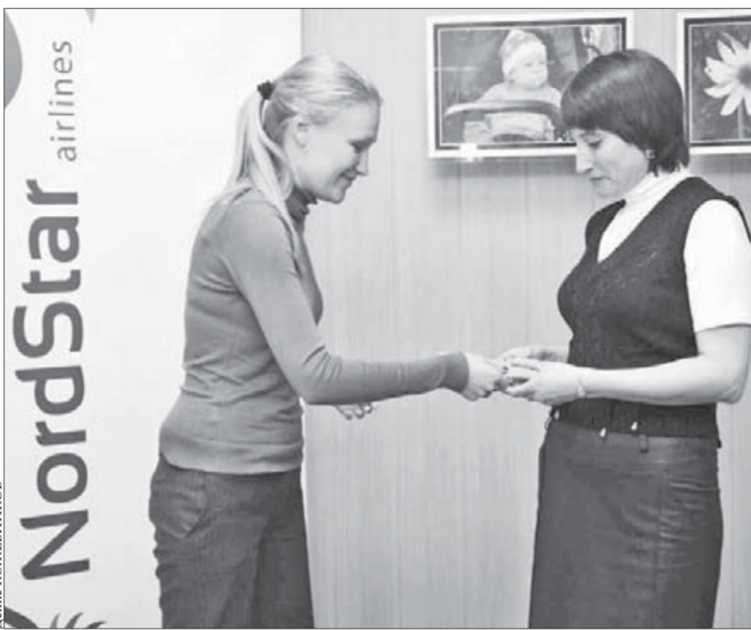
NordStar ценит успешное сотрудничество