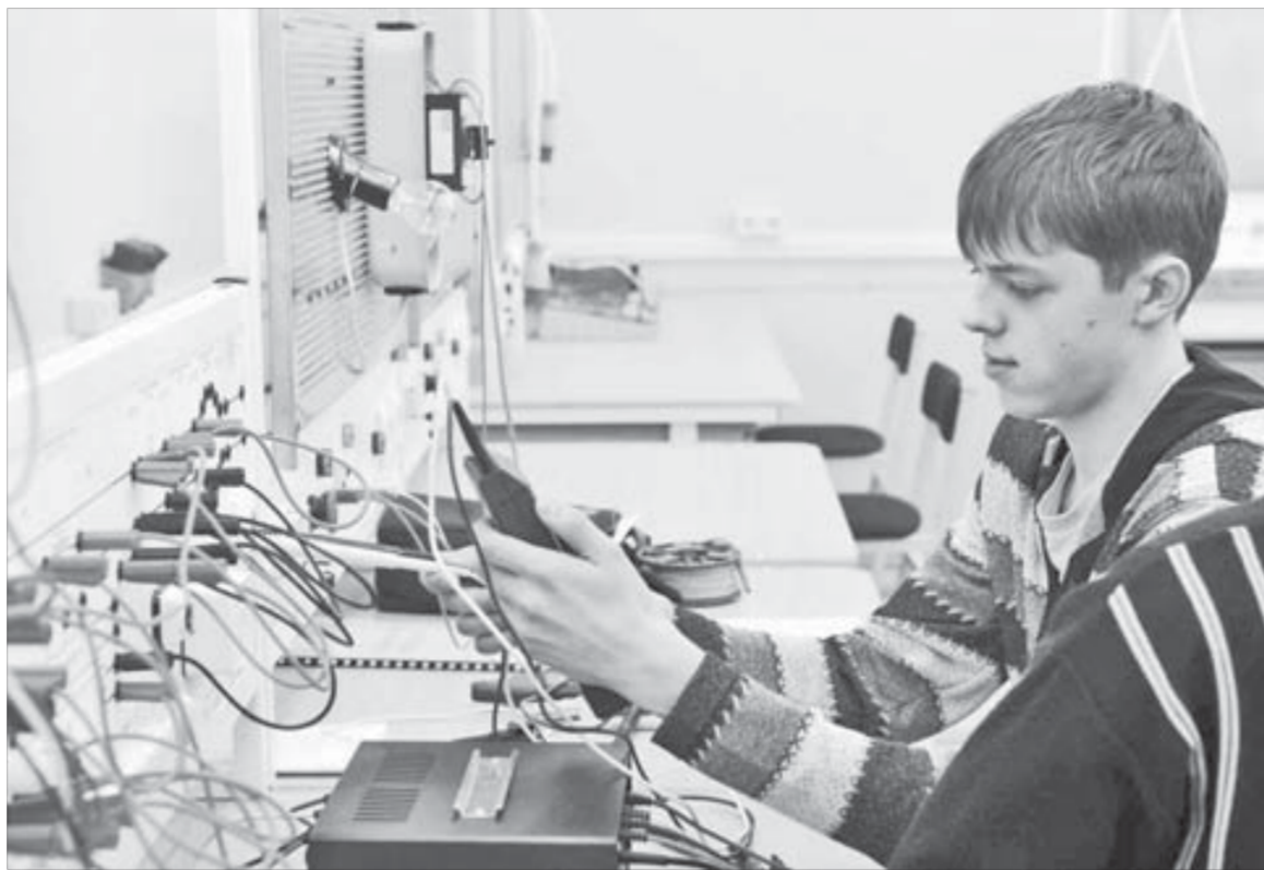
В электротехнической лаборатории можно смоделировать любую неисправность