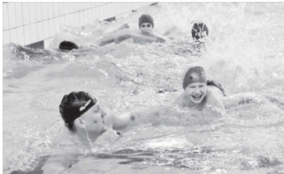
С папой и мамой плавать быстрее!