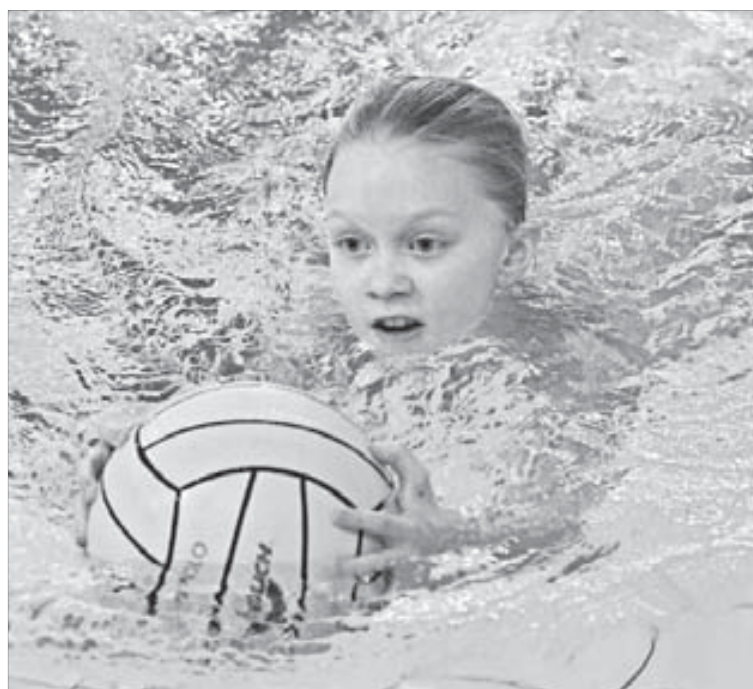
...и не менее быстро плыть