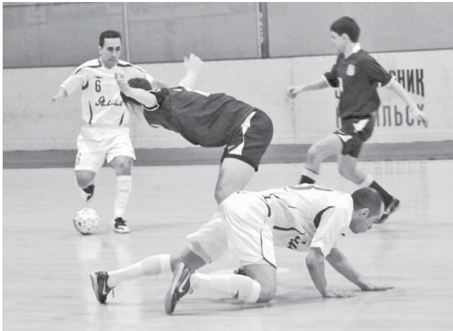
Команды бились из последних сил