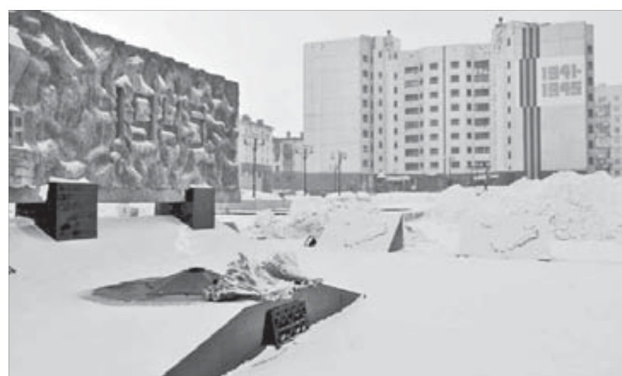
Площадь Памяти Героев станет центром торжеств