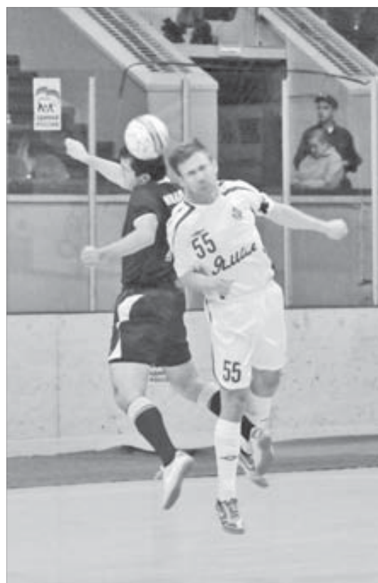
Борьба на каждом участке площадки

МФК «Норильский никель» проиграл «Динамо-Ямал» по счету, но не по игре.