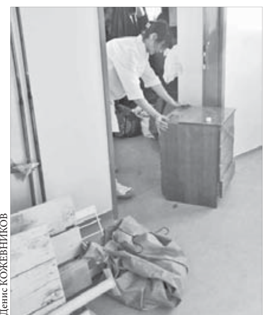
Не дожидаясь окончания ремонта, наркологическое отделение освобождает палаты и коридоры на Б.Хмельницкого, 16

Напомним, что наркологическое отделение закрыли по решению суда, так как здание на Орджоникидзе, 13, было признано пожароопасным. 31 декабря прошлого года наркология срочно переехала на Б.Хмельницкого, 16, где в палатах на три койки разместились по семь-восемь