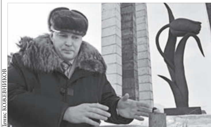
"Черный тюльпан" – самый многогранный памятник Норильска