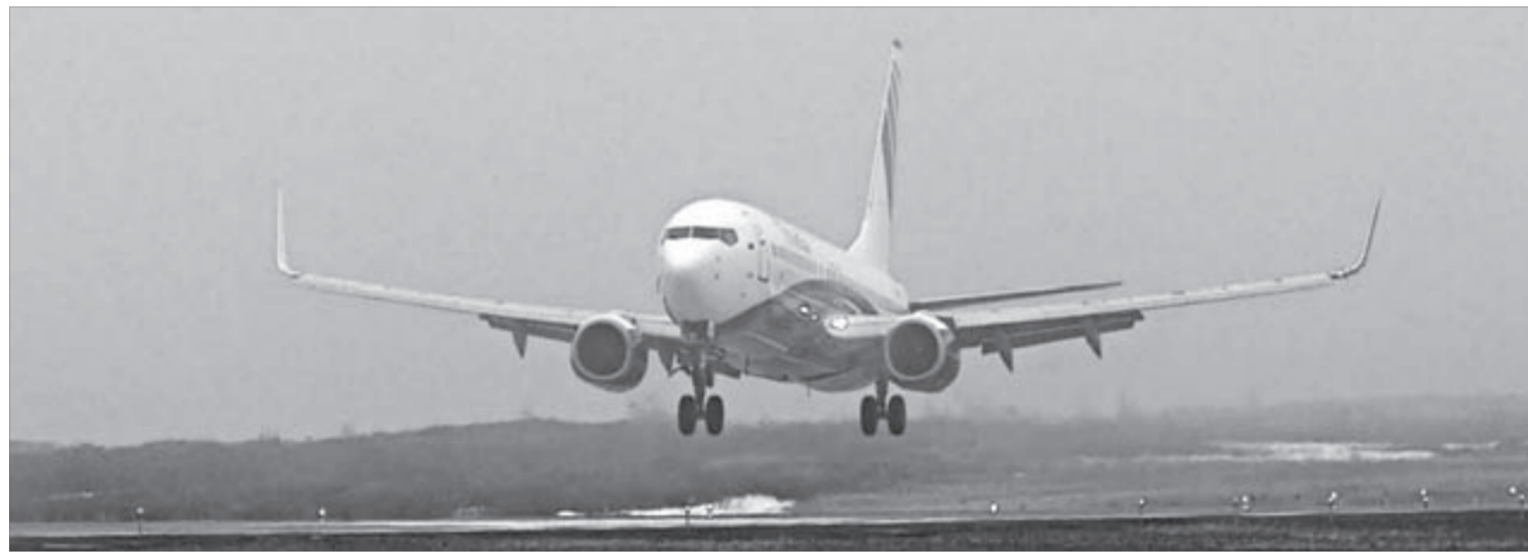
Вперед, за льготами!

Программа будет действовать до 31 октября. В следующем году правительство, возможно, примет аналогичную.