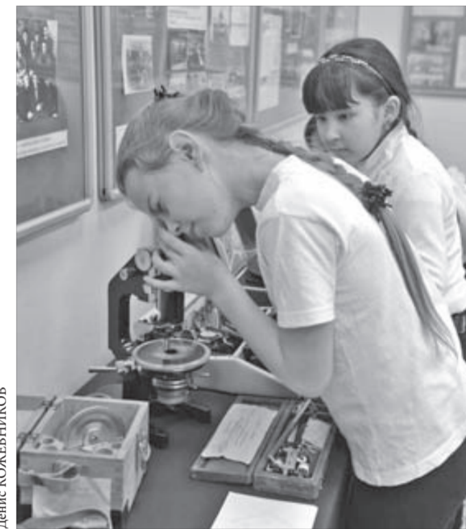
В музее можно заглянуть в прошлое