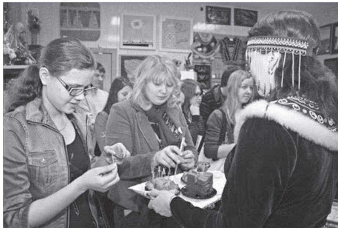
Все по обычаю – рыба, хлеб, вода...