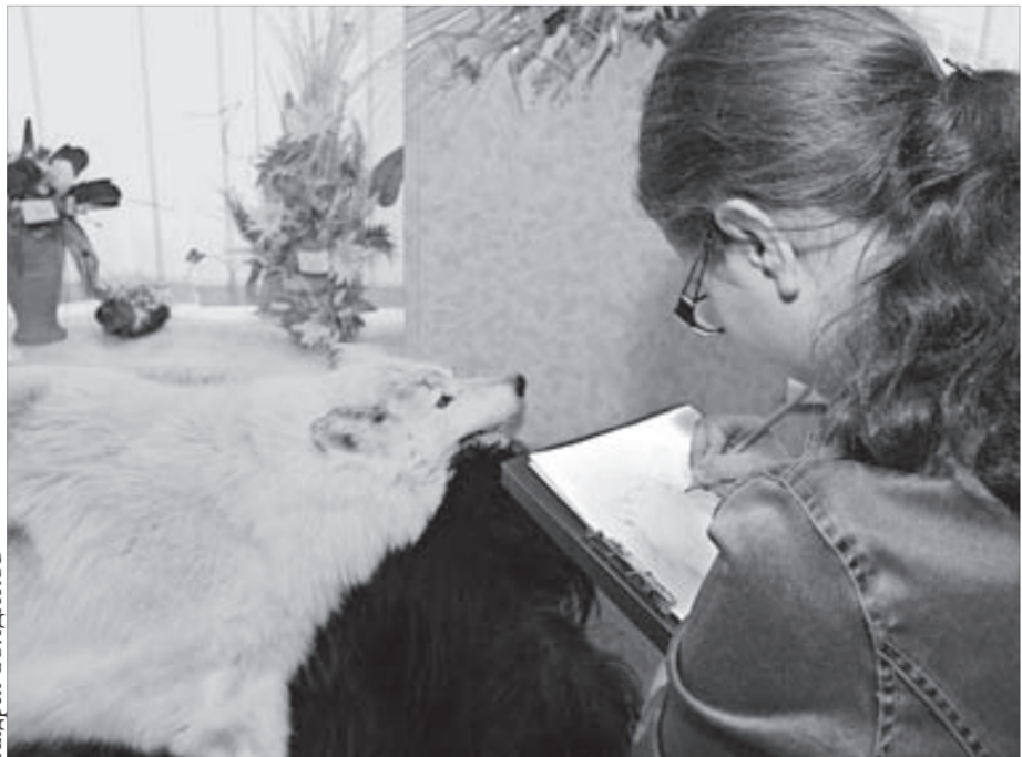
Рисуем с натуры