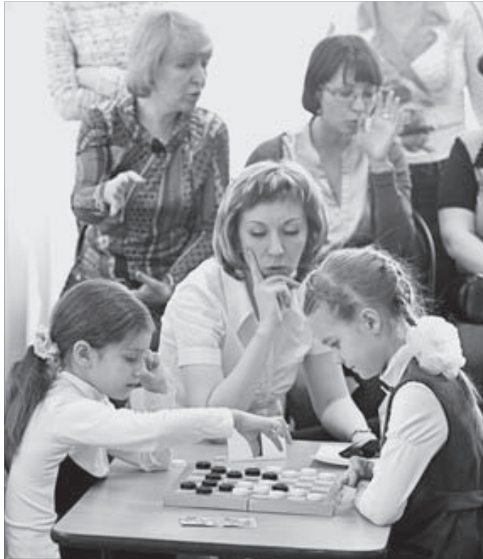
Болельщики и судьи волновались больше детей

“Подзарядиться” – то есть сосредоточиться – молодым людям на турнире все же пришлось. Судьи объявили условия соревнований: два