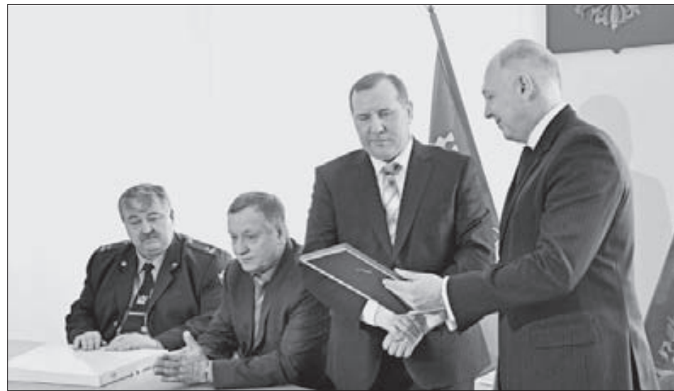
Власти Норильска очень ценят работу наркополицейских

– Трудно переоценить важность вашей работы. И результат вашей деятельности не только в том, что в прошлом году изъято более 17 кг наркотиков. Это сотни спасенных жизней. Благодаря вам в Норильске сегодня нет наркозависимых в школах.