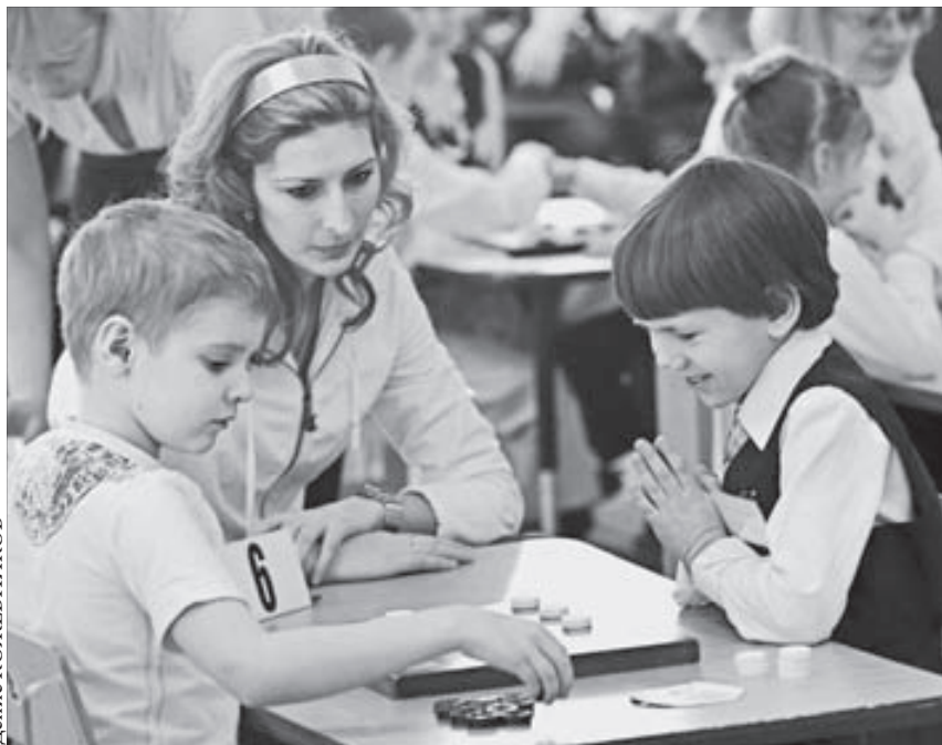
И близок миг победы...

У меня только одно желание норильским покупателям: уважайте труд других людей. У всех нас есть сложности – на работе, дома. Давайте не усугублять проблемы. Лучше лишний раз улыбнуться друг другу.