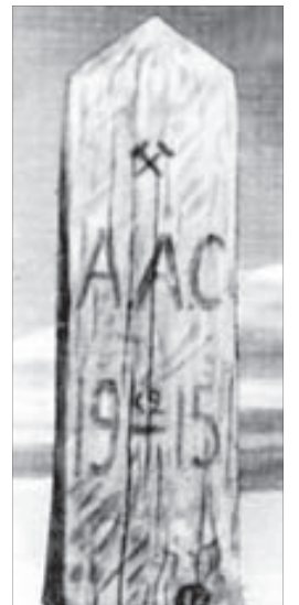
Заявочный столб наследника норильских богатств