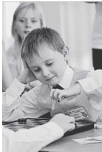
Найден выход из сложной позиции!

очка за победу, одно за ничью и ноль за поражение. Всего в этот день предусматривалось три игры, по итогам которых и должны были определиться победители.