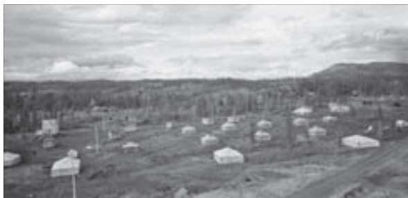
Талнах начинался с палаток

В январе прописку в поселке имели всего три тысячи двести человек, хотя работало около четырех с половиной тысяч. Первостроители Талнаха жили в основном в палатках, было несколько жилых домов, но первую пятиэтажку заселили только в начале 1965-го. К тому времени Норильск и Талнах соединяла автомобильная дорога, функционировала понтонная переправа через Норилку. Не за горами была установка последнего пролета моста, по которому в день 30-летия НГМК пройдет первый поезд с талнахской рудой.