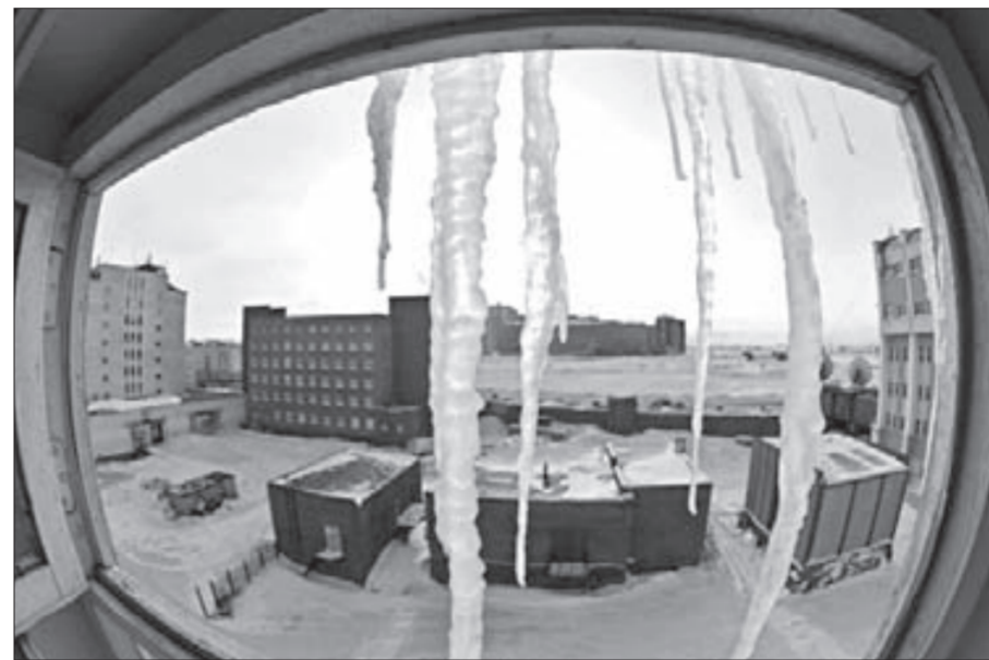
Сосульками займутся специалисты

Единственная проблема может возникнуть с нехваткой рабочей силы. Снега в этом году