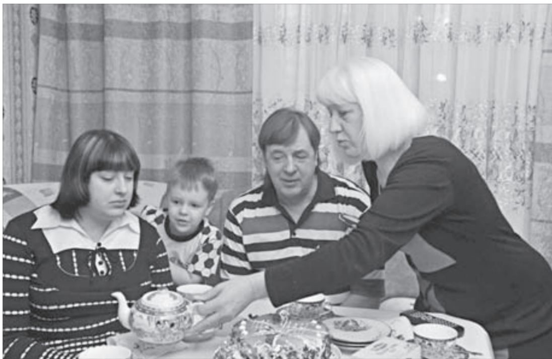
Горняцкий хлеб — торт “Шахтерский”