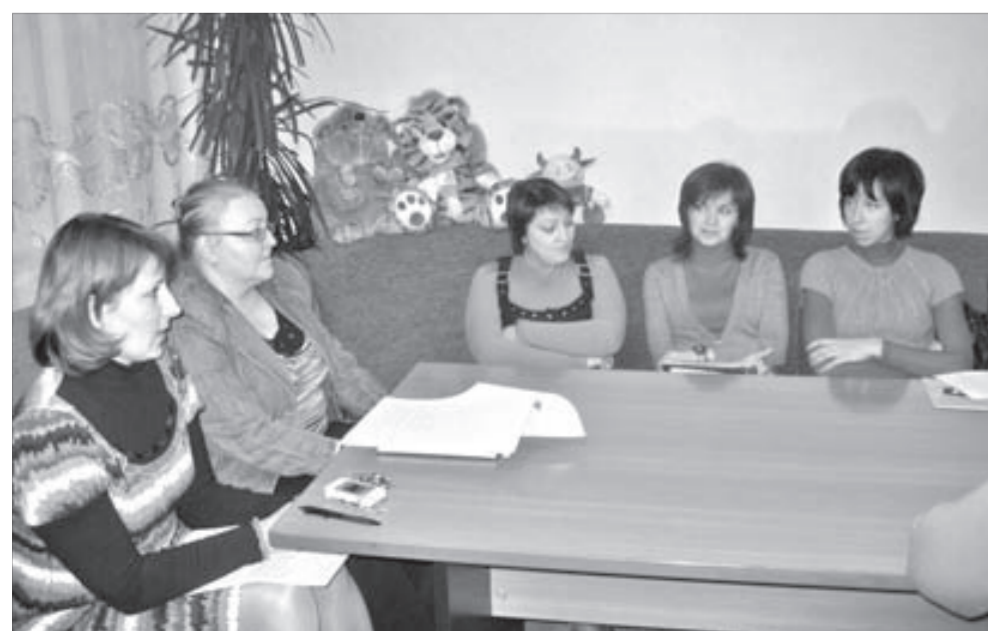
Совместное обсуждение помогает решить проблему