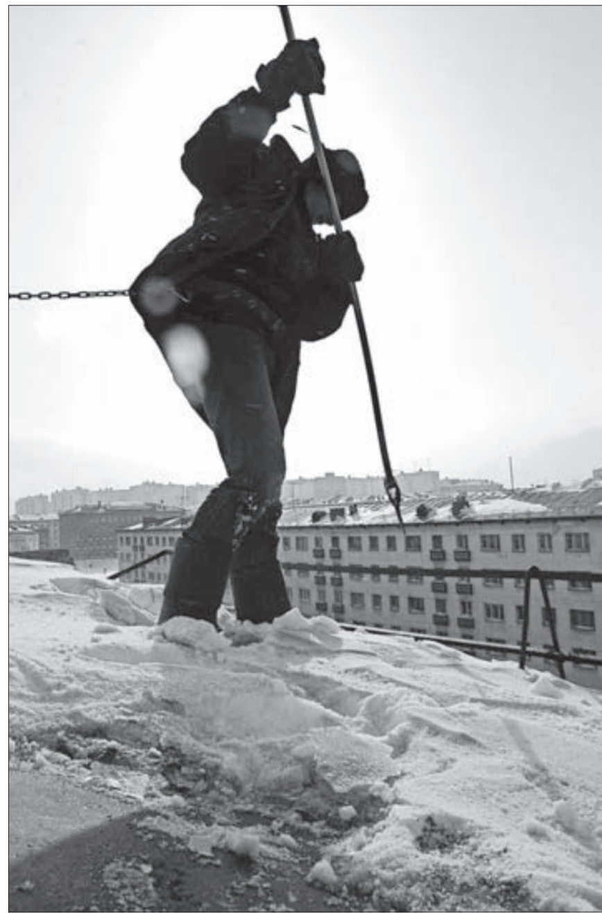
Крыши очистят проверенным способом