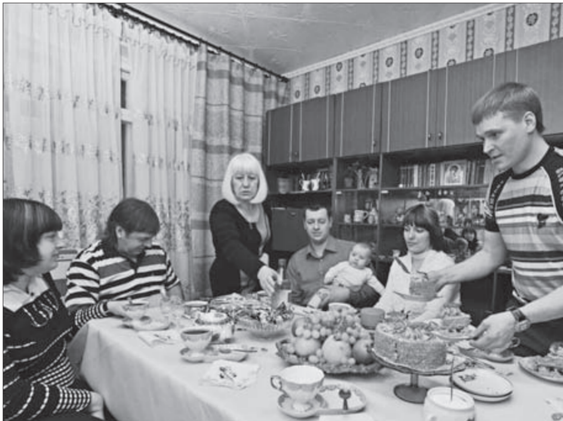
Вся династия за одним столом