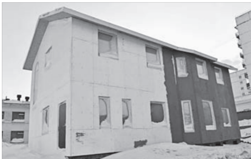
Заказчик строительства дома уверен: эксперимент удался

— Уже сейчас видно: теплопотери минимальные, — утверждает инициатор проекта. — Хотя объективно, конечно, можно будет оценивать только тогда, когда здание будет введено в эксплуатацию.