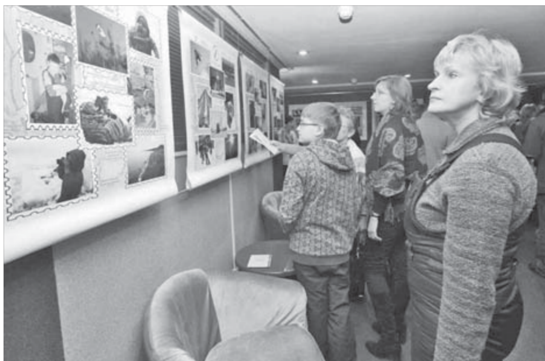
У детей есть свои северные истории

Выставка профессионалов представила собой девять историй от норильских фотохудожников на тему повседневной жизни Норильска и его окрестностей. За четыре дня ее посетили около тысячи норильчан.