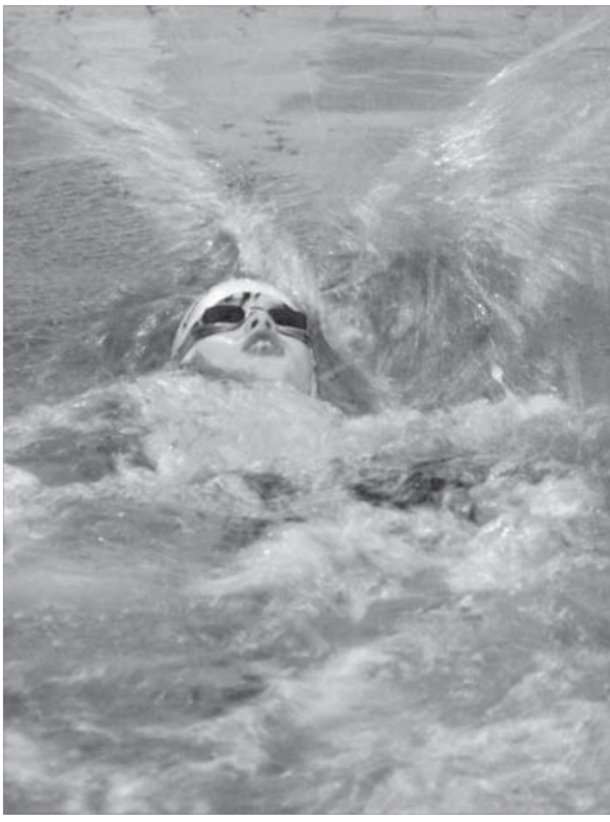
На всех парусах к победе