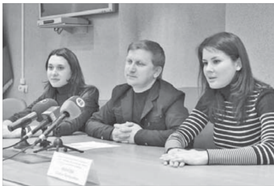
Краевые чиновники верят в перспективное сотрудничество

Сегодня правительство Красноярского края готово выделить деньги, чтобы норильчане обобщили накопленный опыт и передали его другим территориям региона. Более того, об этом уже имеются некоторые договоренно-