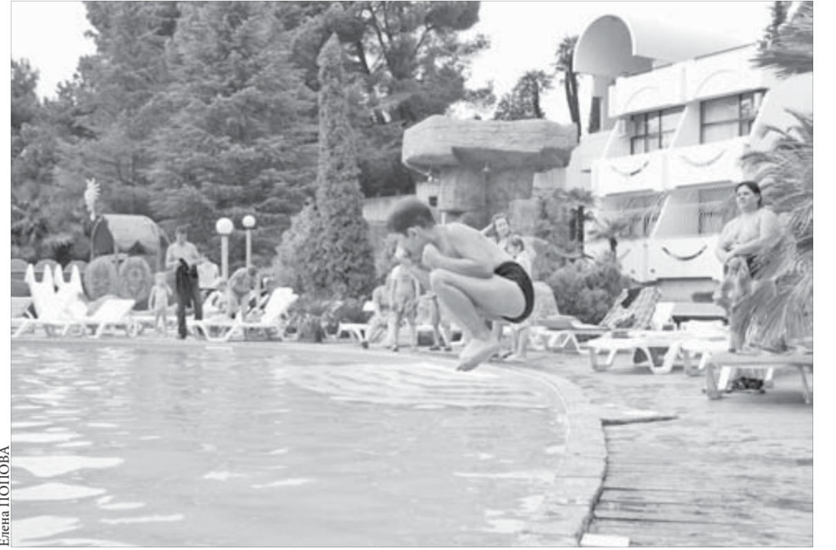
Отдых в “Заполярье” приятен, и полезен

– Данная компенсация, кстати, постоянно растет. Например, в первом полугодии 2009 года работник компании получал на руки 20 тысяч рублей, во