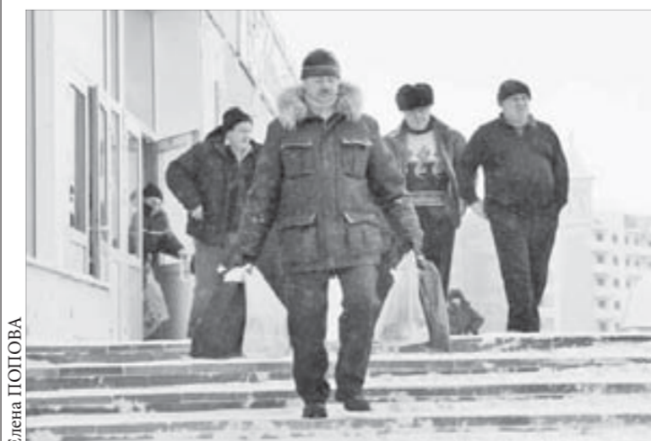
Закупались на неделю

Для удобства горожан в течение двух дней на ярмарку ходили специальные автобусные маршруты Дворец спорта “Арктика” – Ленинский проспект. Также до “Арктики” можно было доехать