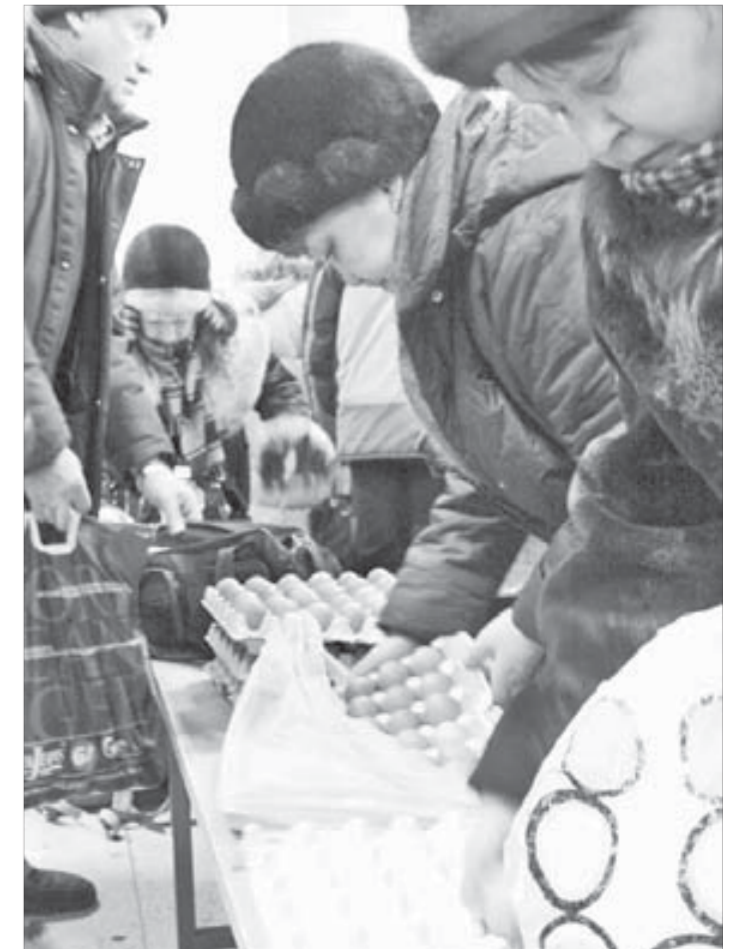
Яйца по дешевке в большой цене