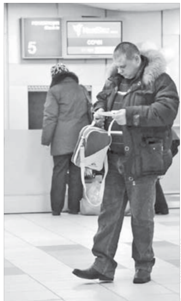
География полетов расширяется

Наряду с программами “Солидарная корпоративная пенсия” и “Льготное кредитование” реализуется программа “Корпоративные дополнительные отпускные выплаты на проезд”, предусматривающая выплаты работникам компании, имеющим особые трудовые заслуги, денежной компенсации для оплаты стоимости проезда в отпуск. Участниками этой программы в 2009 году стали порядка 1800 лучших работников, достигших высоких производственных показателей и отмеченных правительственными, ведомственными и корпоративными наградами. Размер компенсации составил от 20 до 25 тыс. руб. Таким образом, у работников появляется право на льготный проезд в отпуск помимо предусмотренной в Коллективном договоре оплаты один раз в два года.