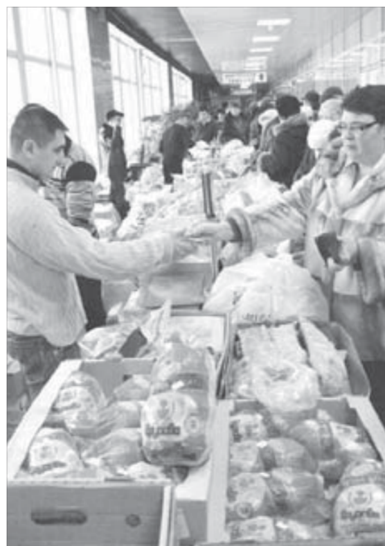
Холл “Арктики” не пустовал