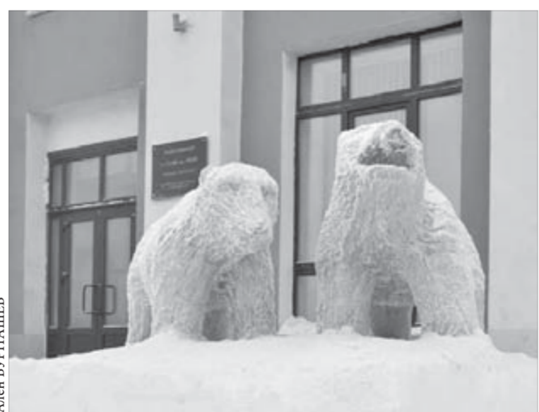
Рядом с музеем теперь новая достопримечательность