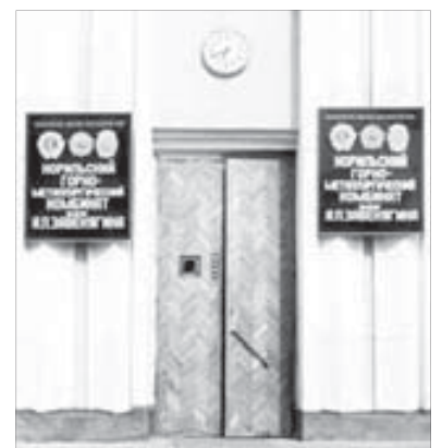
“За выдающиеся заслуги в развитии горной и металлургической промышленности”

В годы оттепели бывшие заключенные Норильлага стали писать о том, что Завенягин спас сотни и – опосредовано – тысячи людей.