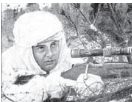
Самый успешный снайпер Второй мировой