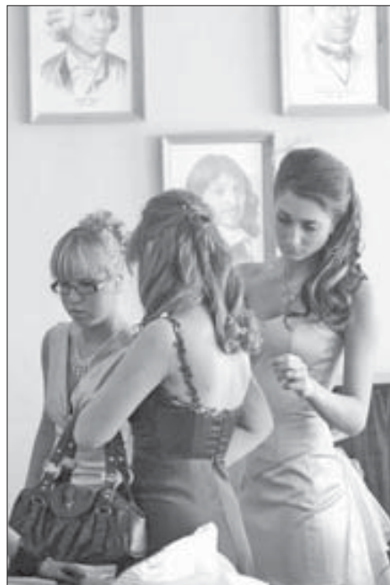
На выпускном все должно быть красиво

Телефоны для справок: район Центральный – 46-14-18, 46-14-22; район Талнах – 37-32-51; район Кайеркан – 39-54-83.