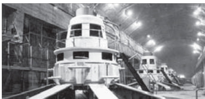
В 1972-м в строй вступили все агрегаты Хантайской ГЭС

22 февраля 1970 года ЛЭП Норильск – Снежногорск поставлена под промышленную нагрузку. Почти год стройка ГЭС получала энергию из Норильска по новой линии электропередачи. Вернуть долг она смогла уже в ноябре 1970-го, когда накануне полярной ночи первый агрегат Хантайской ГЭС дал промышленный ток. Заработала первая гидроэлектростанция Енисейского Севера.