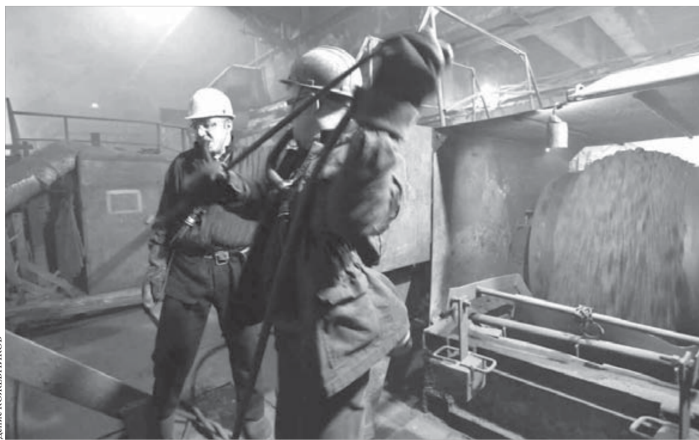
Соблюдение правил ТБ – залог безаварийной работы