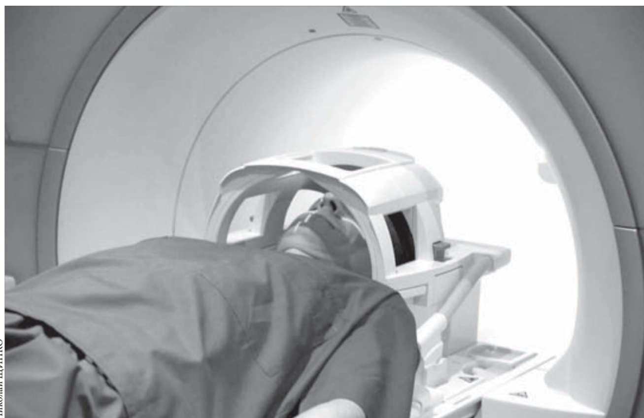
За год работы томограф помог подтвердить или опровергнуть диагнозы многих заболеваний

Курс акций ОАО “ГМК “Норильский никель” – 4535,1 рубля. ОАО “Полюс Золото” – 1444 рубля.