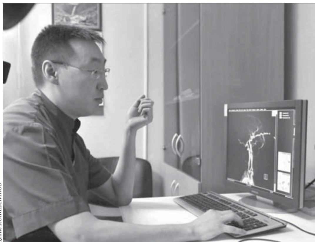
Новый томограф – новый уровень диагностики

Сотрудники психоневрологического диспансера больше всего боятся, что компромиссом между городом и краем станет сокращение в их службе. Они уверены, что через какое-то время количество коек для наркологических и психоневрологических больных придется увеличивать, но будет поздно. Лечить их будет некому. То, что создавалось годами, восстановит будет не по силам ни министру, ни главе города, ни управлению здравоохранения.