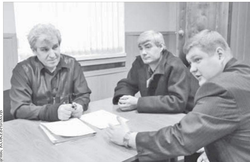
Подведение итогов дня в цехе