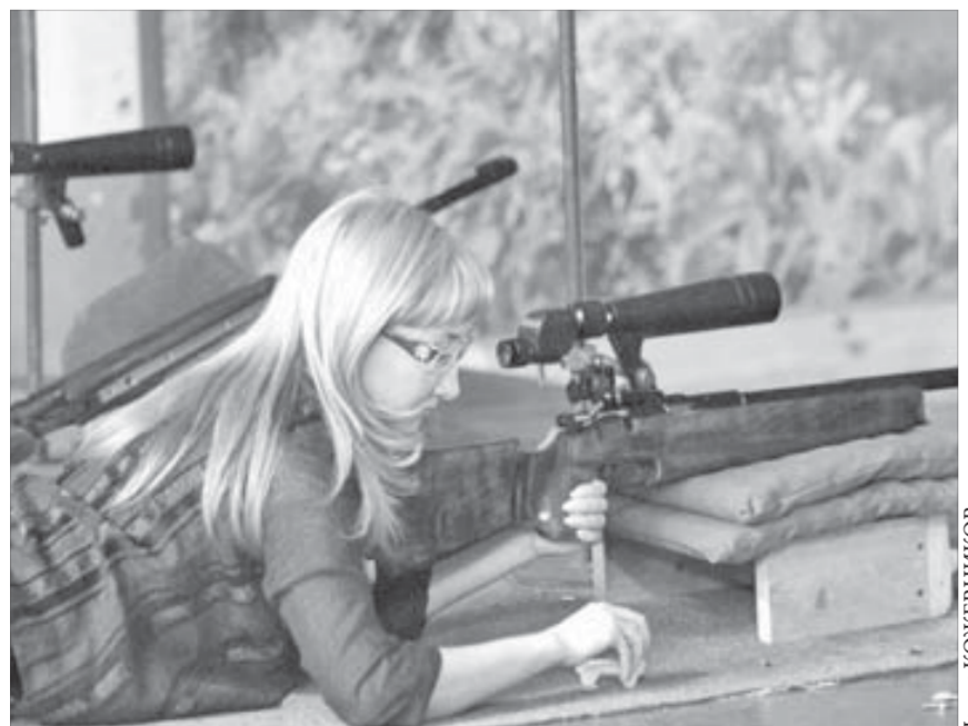
Женщины тоже постреляют в честь мужского праздника

Турнир станет подготовительным этапом перед соревнованиями по стрельбе (их планируют провести 17-20 марта) в рамках спартакиады ЗФ.