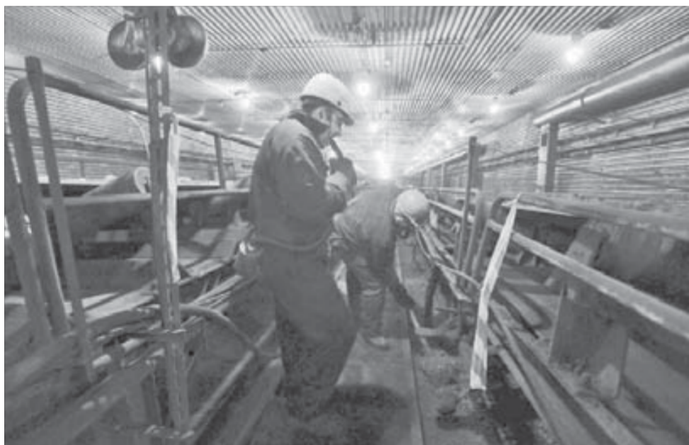
Замечания исправляются в рабочем порядке