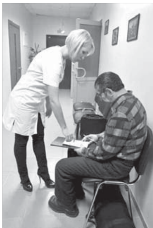
Попать на обследование можно только по талонам

Чаще всего в кабинете МРТ обращаются для обследования центральной нервной системы (головы и спины), органов брюшной и грудной полости, органов малого таза, рук, ног, суставов и сосудов. В целом пакет про-