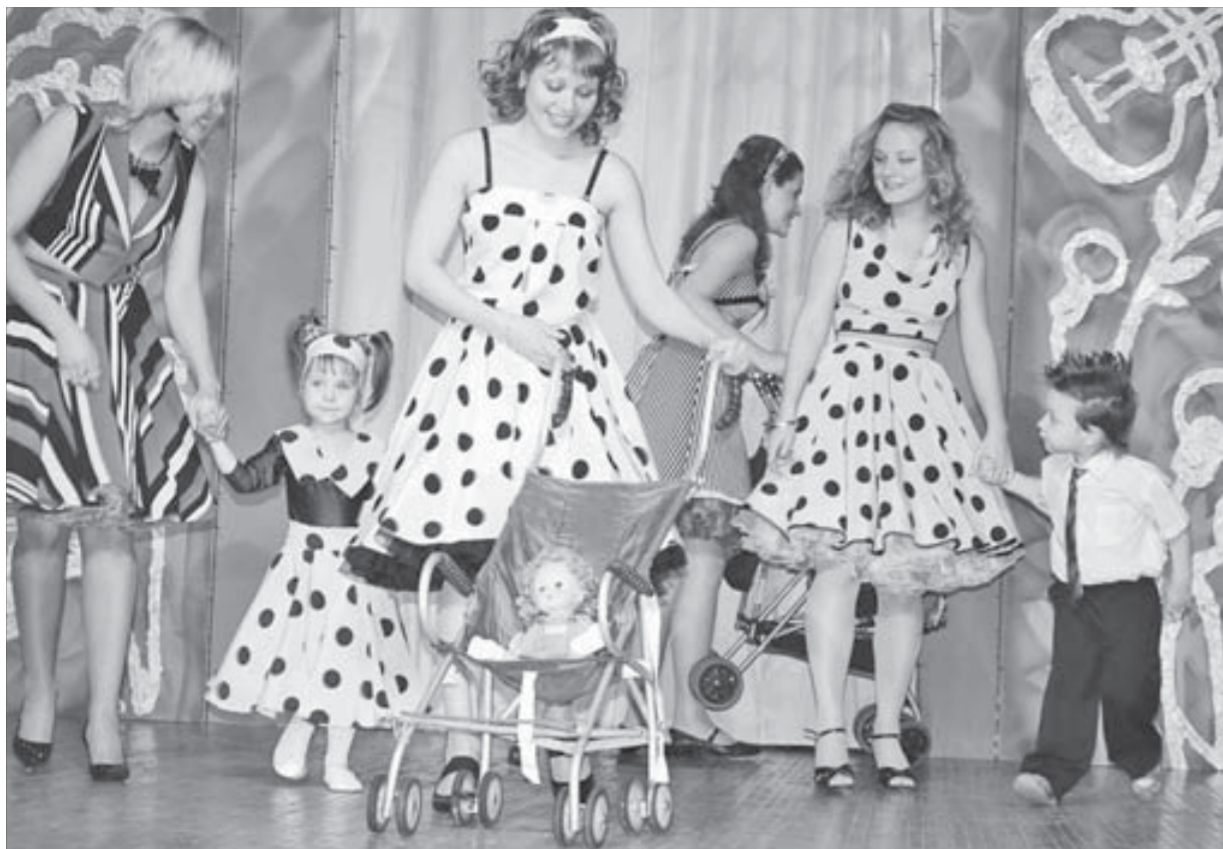
Мамы, наставницы и... просто красавицы