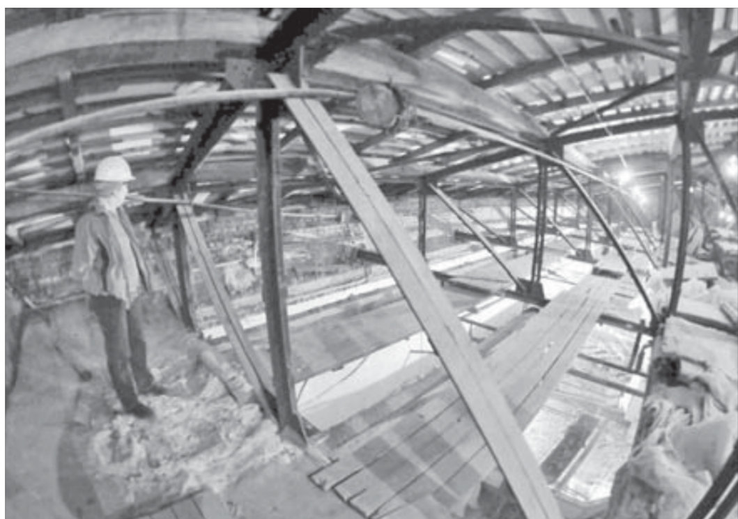
Прораб все должна проверить

– К сожалению, наш совет пока нельзя назвать многочисленным, – отметил Сергей Шмаков. Однако глава выразил надежду, что его создание станет стимулом для многих неофициально существующих национальных объединений Норильска, чтобы оформить регистрацию и вступить в консультативный совет.