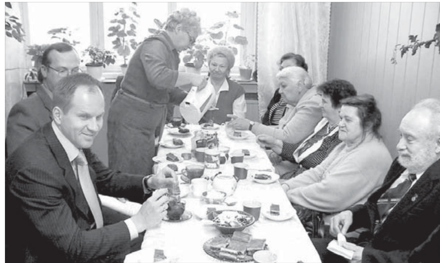
Он общительный и толерантный