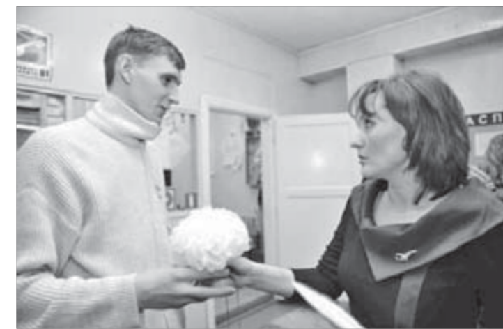
Выпускник уже выше на голову

У каждого учебного заведения свой контингент желающих непременно побывать в родной школе в первую субботу февраля. Как правило, он не очень велик. Проще собраться сразу в кафе или баре да поглядеть, "кто тут еще живой"? Оказы-