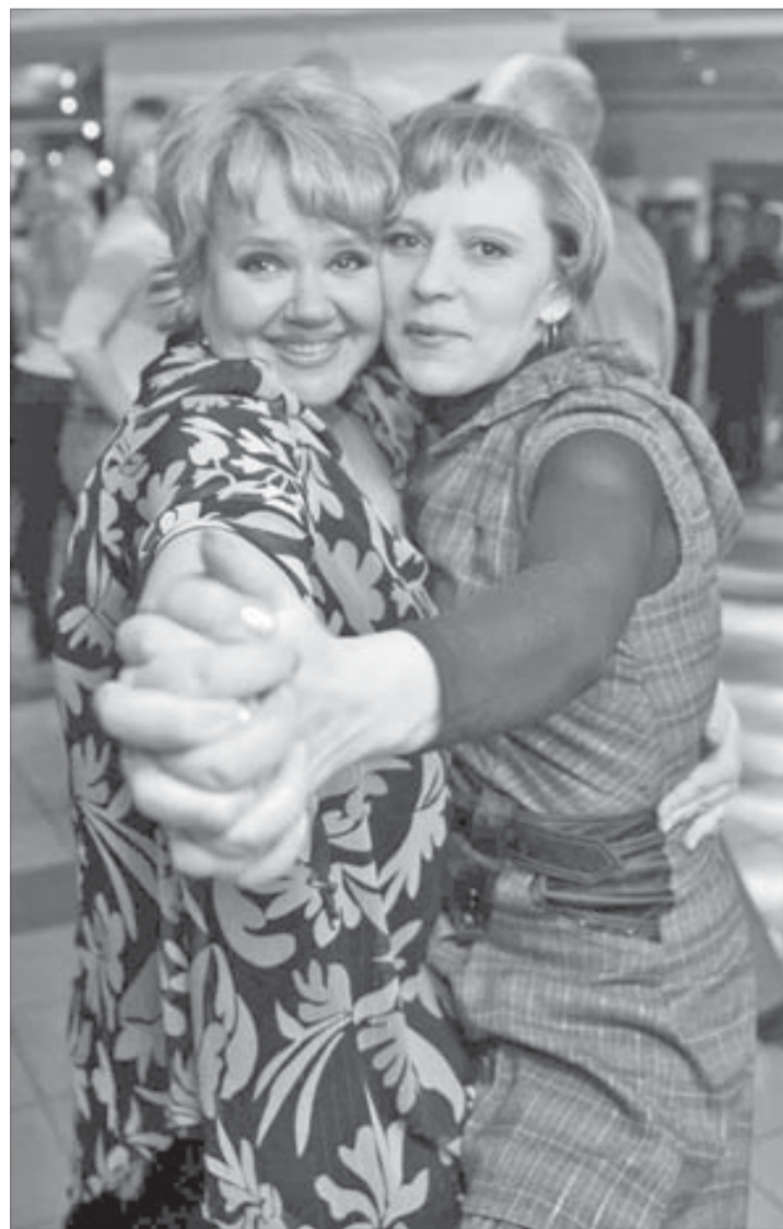
Вальс "Школьные годы"