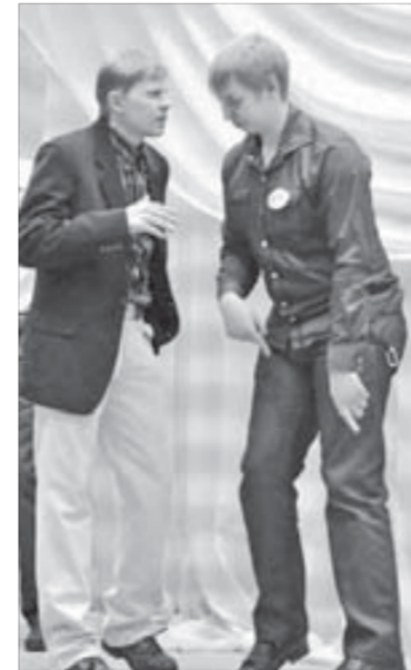
Это я, а это – ты

...Покидали родные классы, уже когда никого в школе не было, а вахтерши с криками бежали по коридорам в поисках тех, чья одежда осталась в гардеробе. Засиделись, однако, взрослые. Но один раз в год можно.