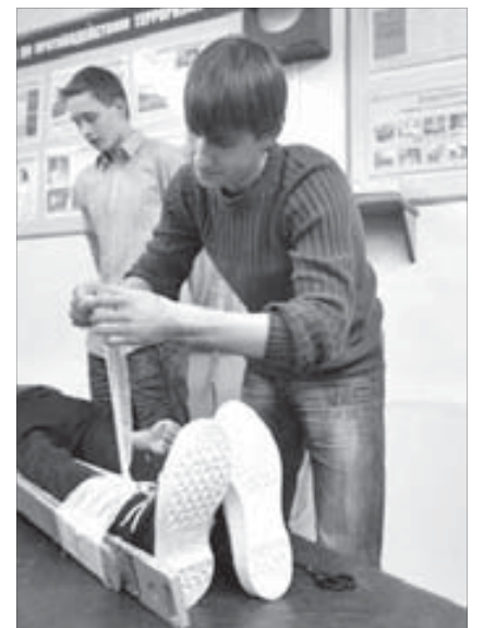
Не будет болеть у “Максимушки” ножка