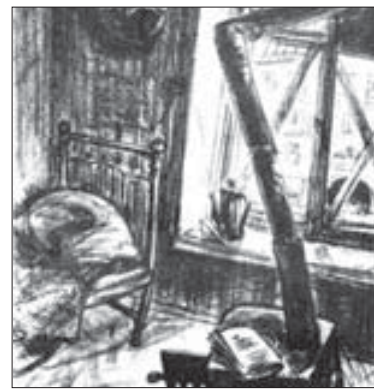
Жилище блокадника. 1941–1942 гг.