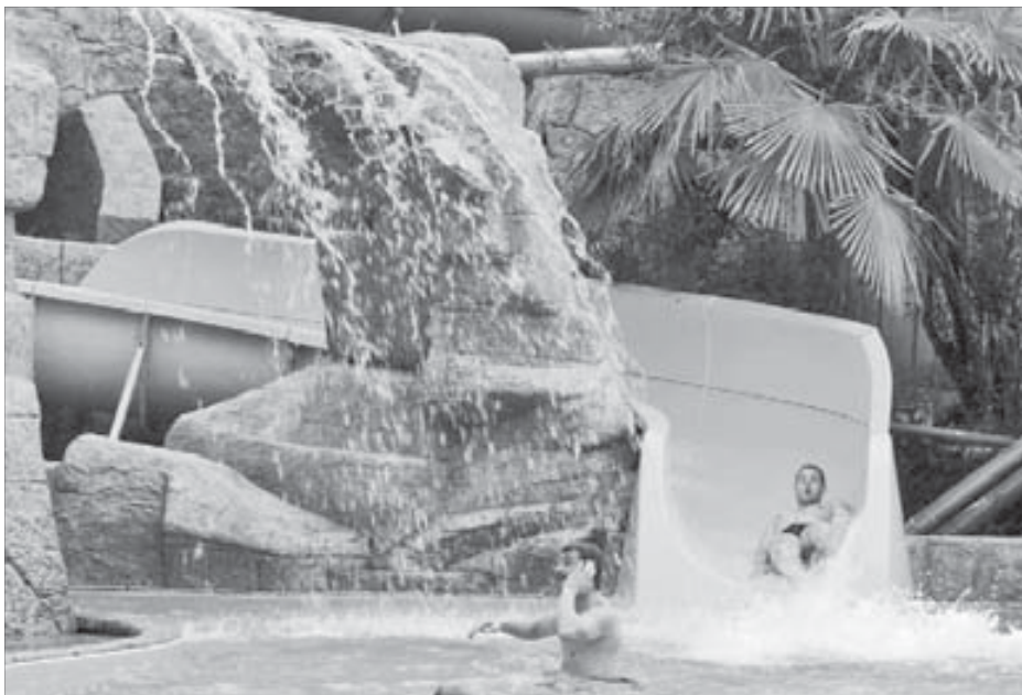
Экстрим под открытым небом

Хочется выразить огромную благодарность генеральному директору ГМК “Норильский никель” Владимиру Стржалковскому, который в сложное кризисное время изыскал возможность для воплощения в жизнь этой корпоративной программы.