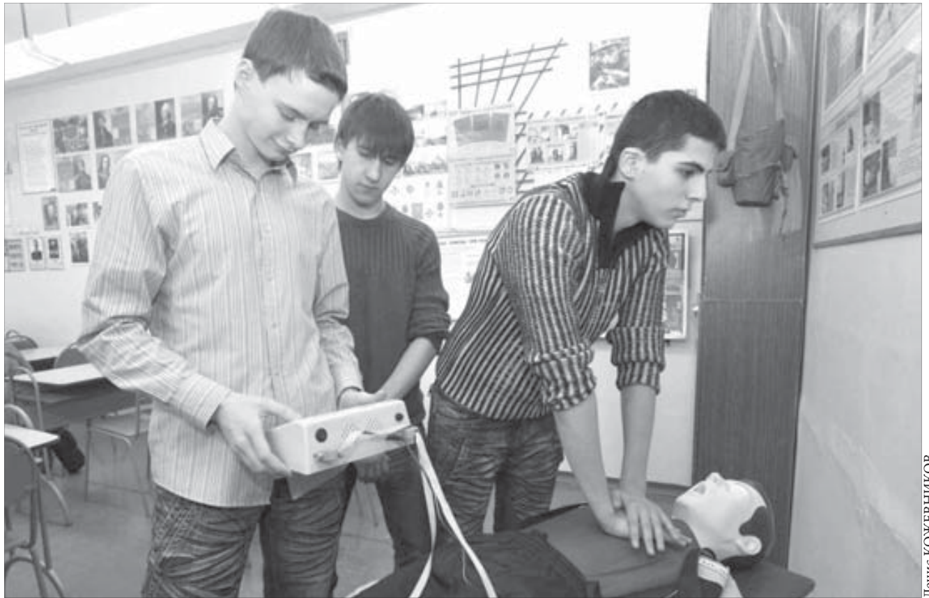
Электронные датчики позволяют увидеть правильность действий

Многие снимают кусочки природы на фоне дымящихся заводских труб. Сочетание индустриального пейзажа и неброской норильской природы привлекает внимание. Ведь это наш Север, наша с вами реальность.