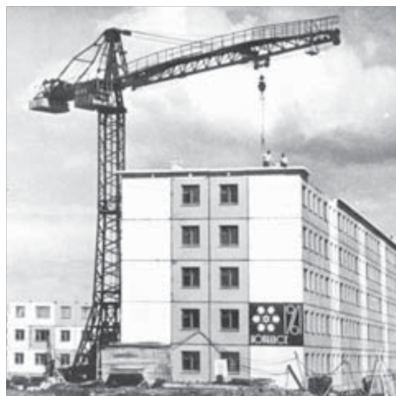
Первый панельный дом на Ленинградской стоит до сих пор, только снежинку закрасили

1 февраля 1956 года в Норильске создана центральная лаборатория строительных материалов, сыгравшая большую роль в становлении стройиндустрии северного города. Первое поколение из репрессированных специалистов, оставшихся в Норильске, занималось практически всем, в том числе и подготовкой кадров для заводских лабораторий. Все технологии отрабатывались сначала лабораторным путем. Сырьевая база Норильского промышленного района позволяла на месте производить практически все строительные материалы. Город возводился из местного кирпича, железобетона, газозолобетона, пока строительство не сократилось.