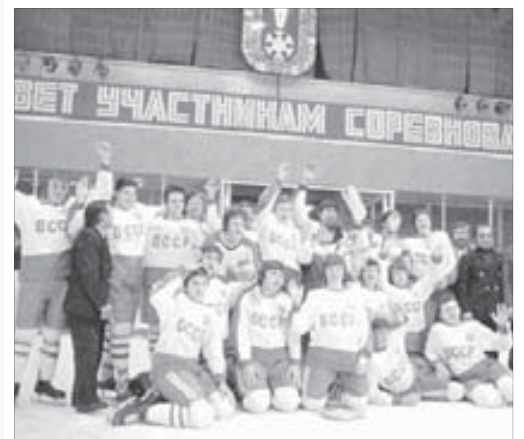
"Арктику" строили долго и построили