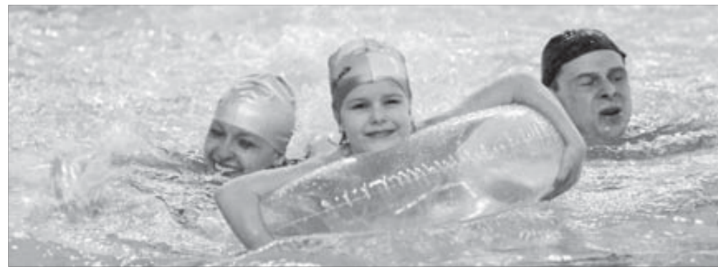
Жители Талнаха собираются возобновить плавательные занятия

Основная доля опрошенных – 27,1 процента (2306 человек) – считает, что реклама отрицательно влияет на дорожную обстановку.