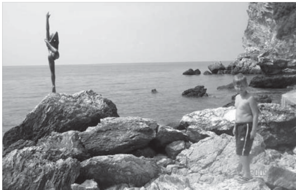
...и в Черногории

Время регистрации на рейс теперь сократилось до сорока минут. Между прочим, пассажирам авиакомпании NordStar предлагается заполнить анкеты гостя «Заполярья» прямо на борту самолета, что тоже сокращает время при регистрации. Даже багаж теперь по территории санатория не надо тащить на себе – его к вашему корпусу доставляет специальный мини-вэн.