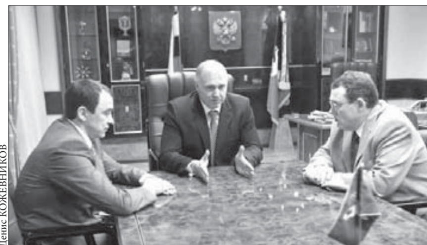
В контакте с властью