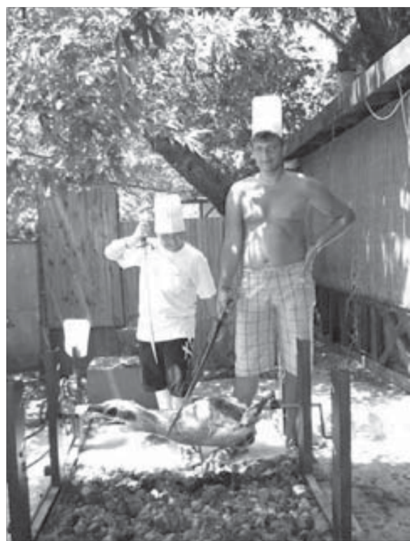
Норильчане отдохнули в Турции...