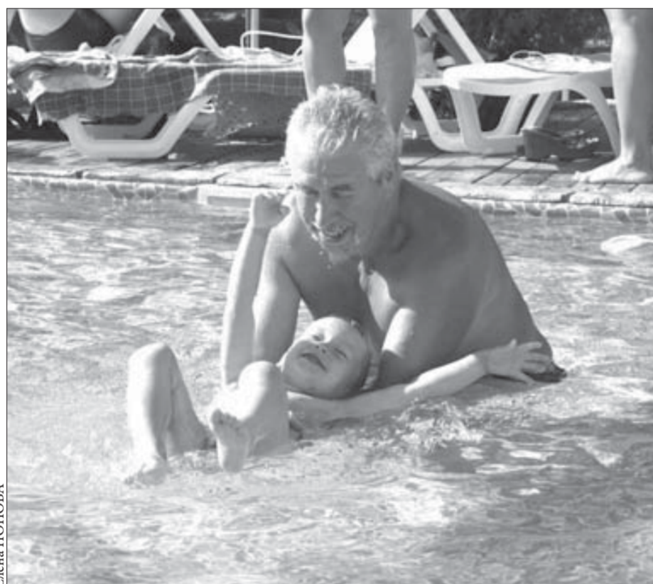
В «Заполярье» есть все для активного отдыха