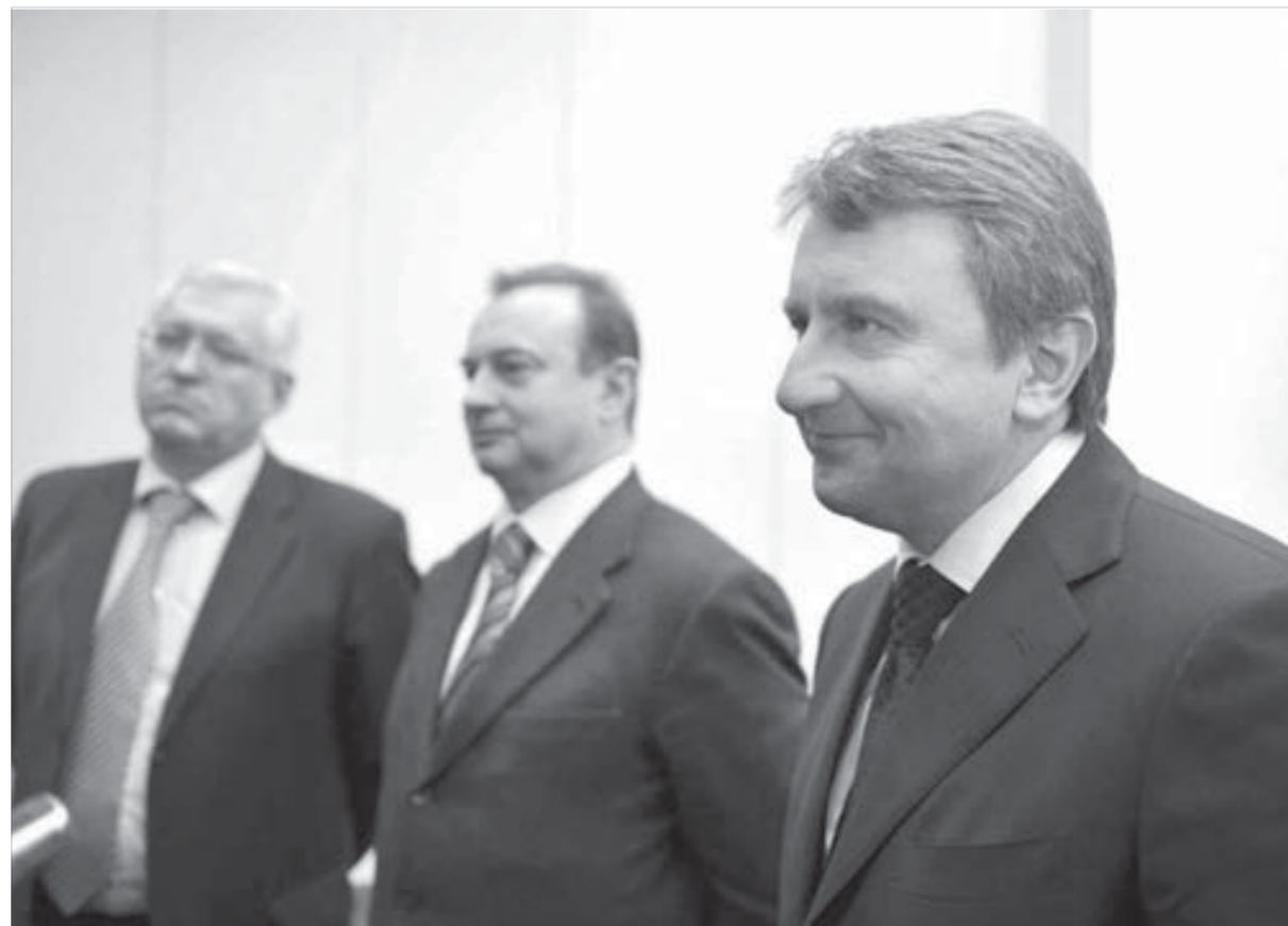
В новый год Заполярный филиал входит с новым директором

– И я буду ее решать вместе с вами, – пообещал новый директор ЗФ.