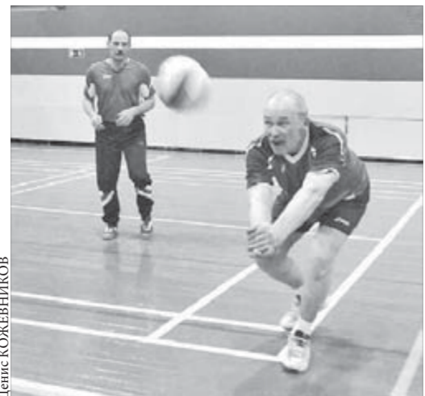
...мяч в игре!