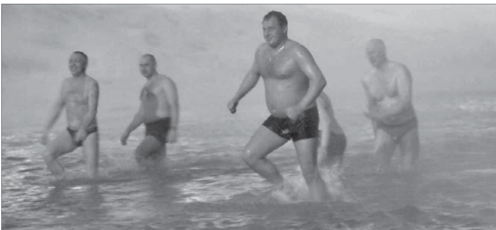
В такую ночь и море по колено

Говорят, в бане все равны. На берегу озера Долгого в ночь с понедельника на вторник, в Крещенский сочельник, тоже все оказались равны. Даже равнее чем в бане.