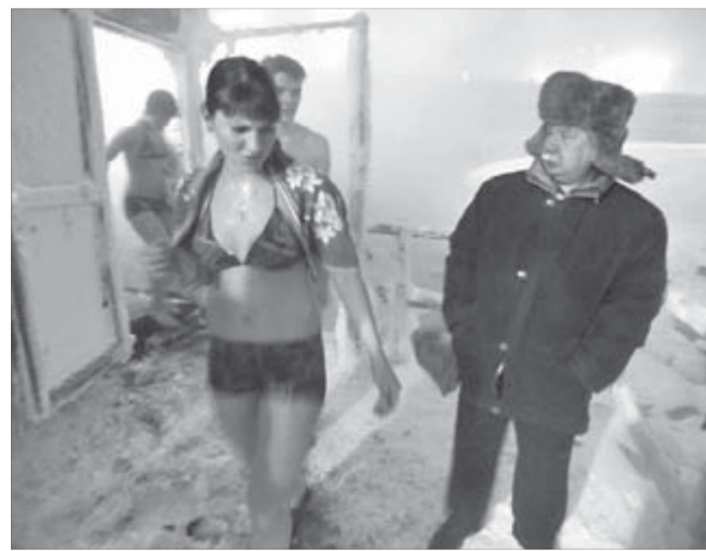
И как таких понять?!