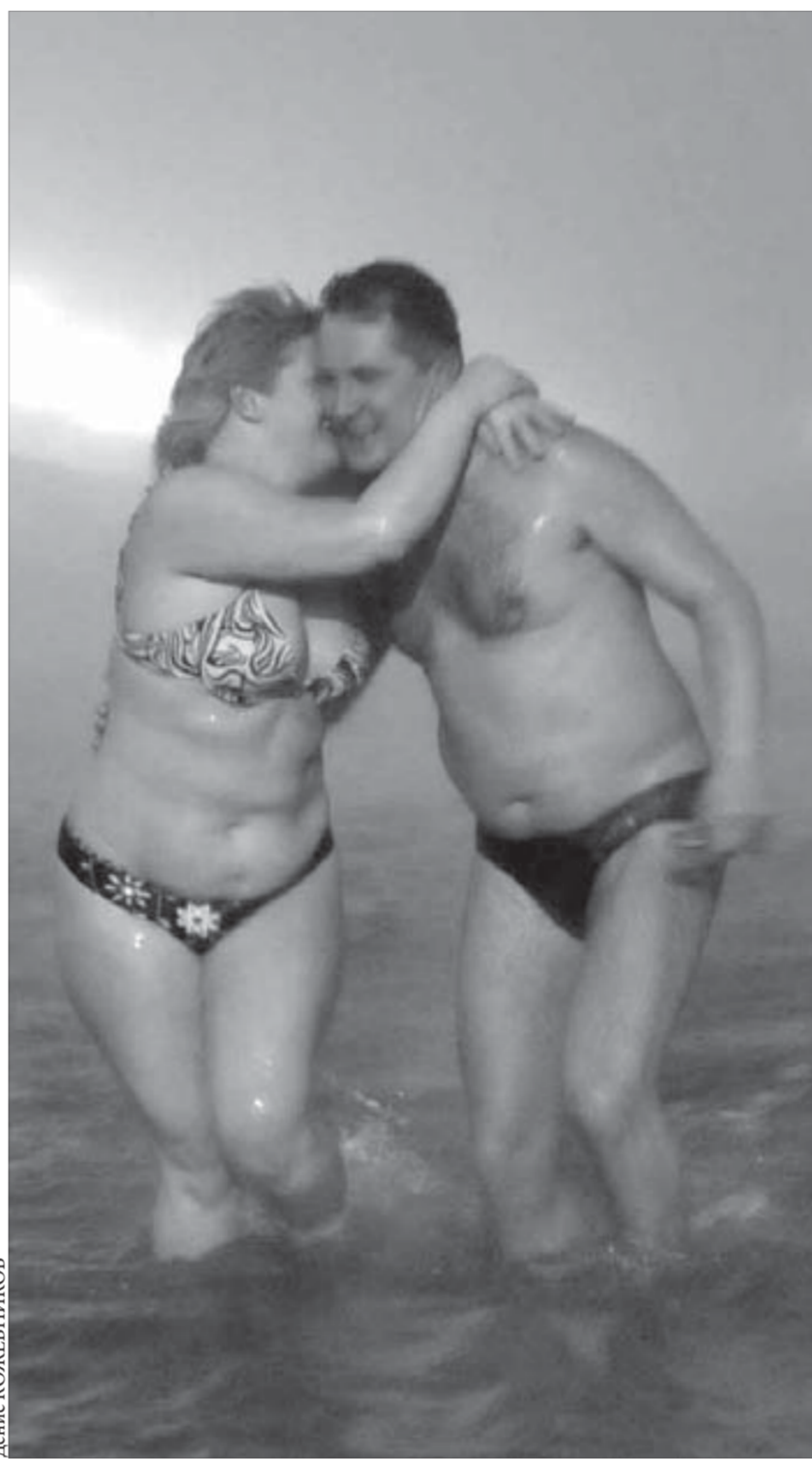
Единение душ после ледяной купели