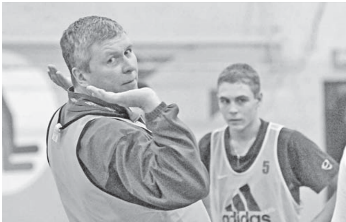
В спорте важно положить соперника на обе лопатки