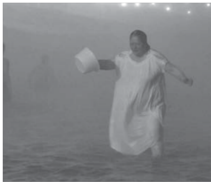
Трижды с головой и в тазике с собой