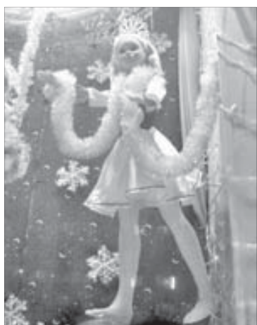
Сказка за стеклом