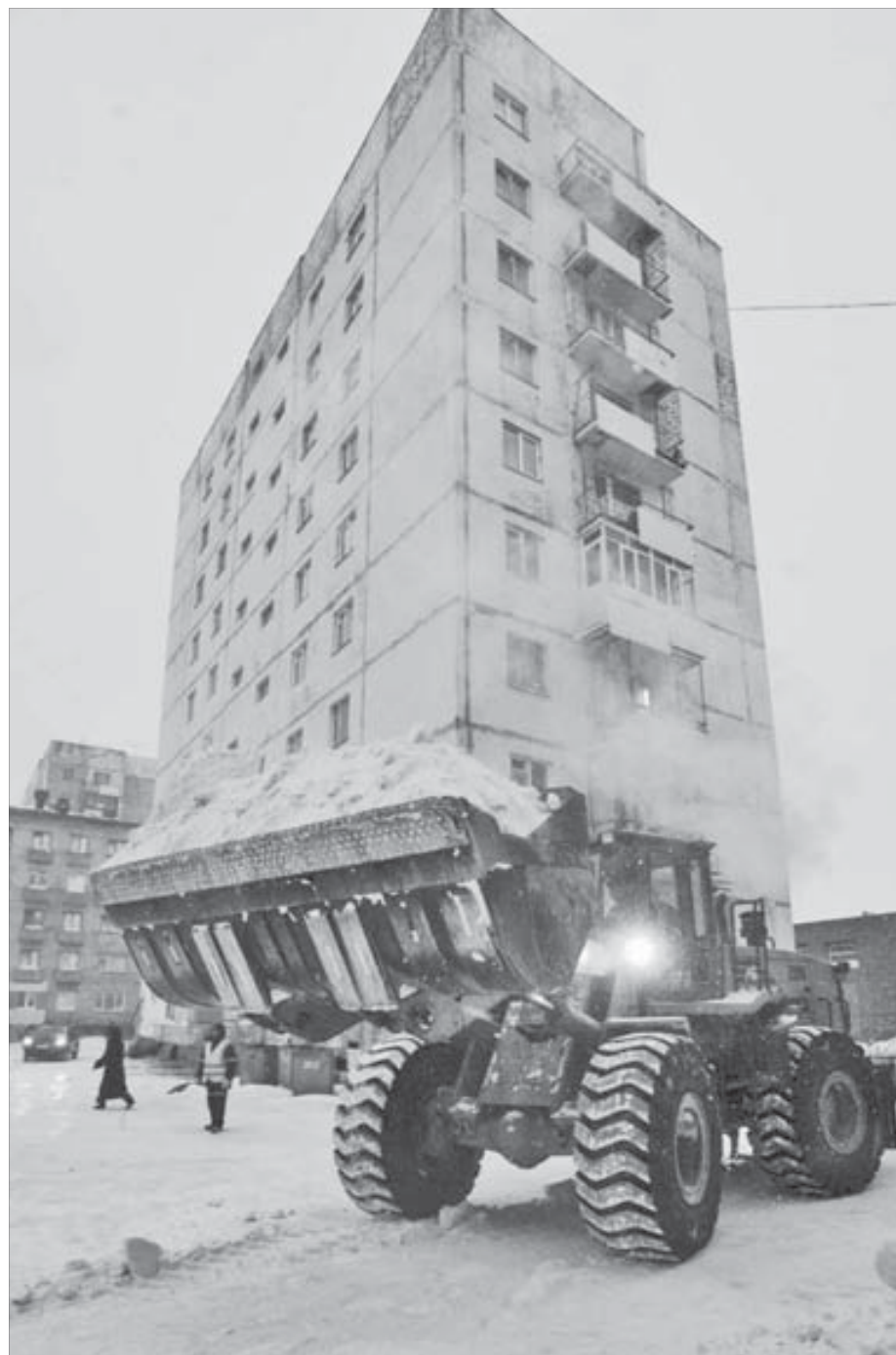
Ковшом под высоткой

Сейчас техника "Жилищной компании" в плановом режиме без суеты работает на вверенных ей участках в Центральном районе Норильска и в Кайеркане. Успевают везде. Так что грядущие снегопады Норильску не страшны. Коммунальщики справятся.