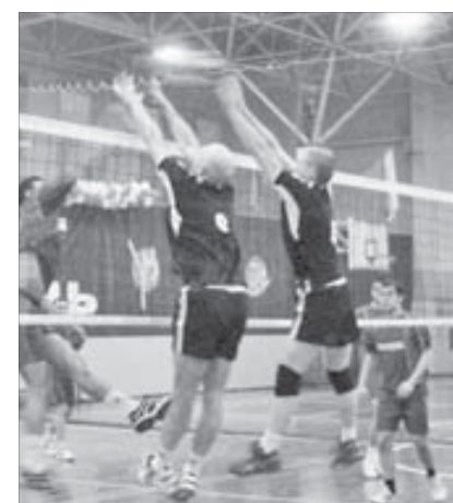
Каждый мяч на счету

Курс акций ОАО "ГМК "Норильский никель" - 4880,3 рубля. ОАО "Полюс Золото" - 1599,6 рубля.