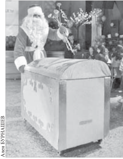
Сундук цветов от Деда Мороза

При активной поддержке коллег артисты-производственники пели и танцевали,