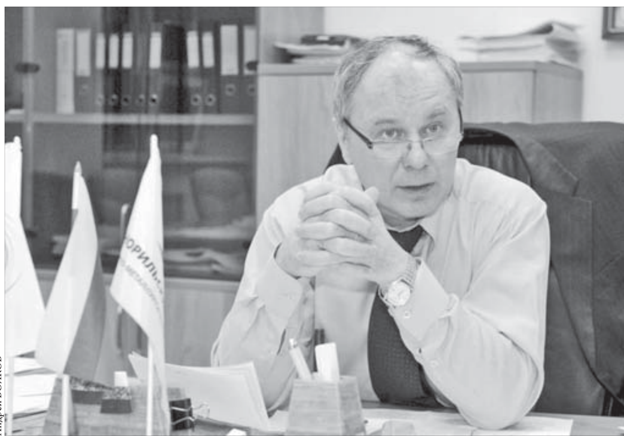
"Мне всегда все хочется усовершенствовать"