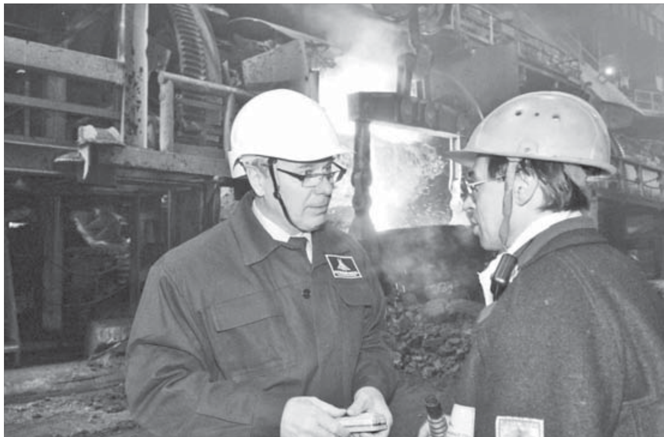
Главный инженер медного завода (слева) — один из самых известных изобретателей компании