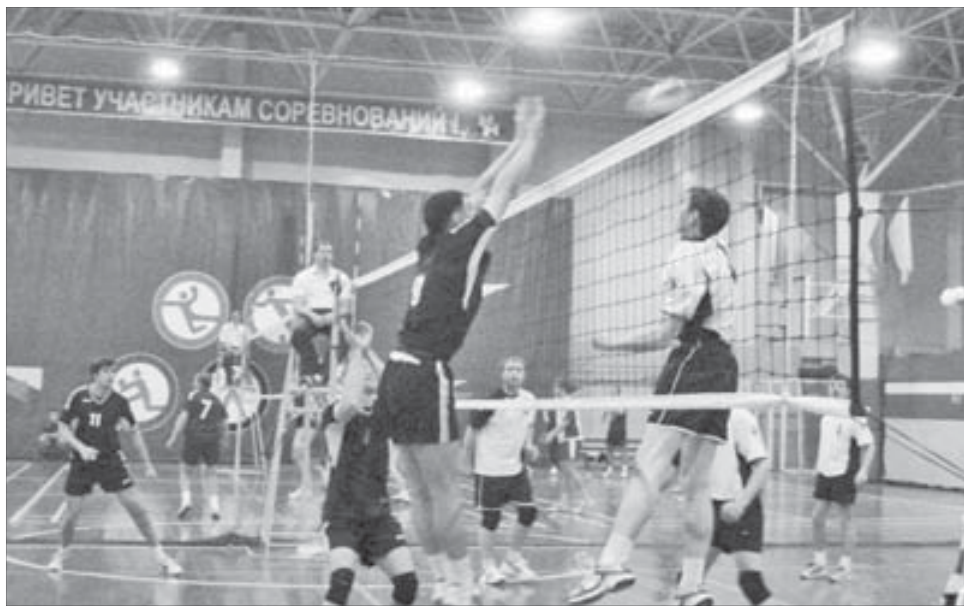
Удар... блок... зона!