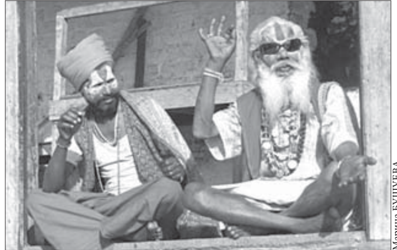
Местные монахи любят фотографироваться

Непальцы верят, что Кумари обладает большой духовной силой, и один ее взгляд может изменить