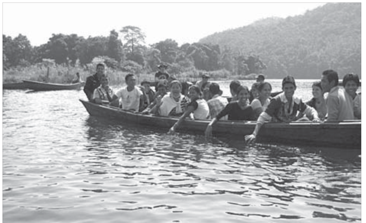
Невозможно не ответить улыбкой