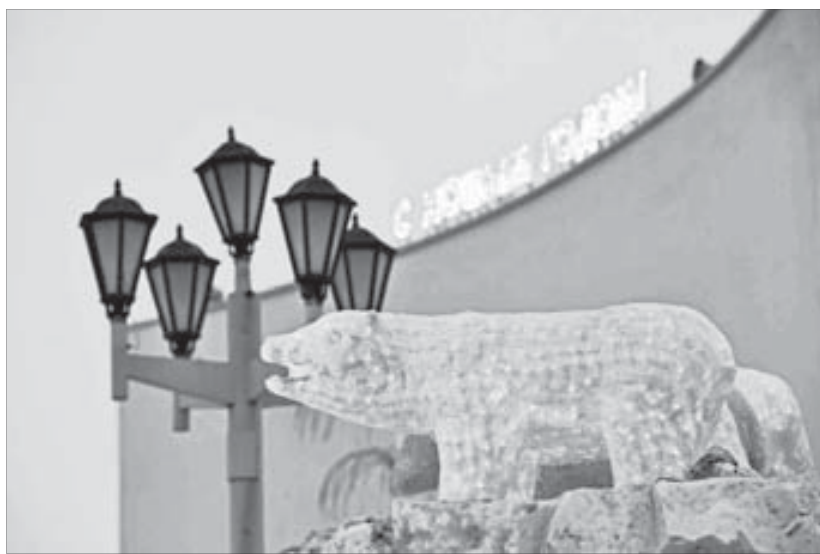
Медведи, театр, фонарь...

Если говорить откровенно, снежных городков этой зимой в Большом Норильске построили не так много. Во всяком случае, на прежних местах, где можно было увидеть Деда Мороза, Снегурочку и других сказочных персонажей, их обнаружить не удалось. Нет ледяных фигур возле школ на "Молодежке", пропали сказочные