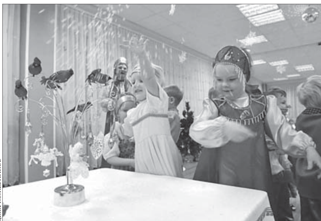
Рисом колядующие осыпали от души

В результате нарушения правил пожарной безопасности при разжигании печи с помощью бензина ожоги головы и кистей рук II степени получил владелец гаража 1955 года рождения. За медицинской помощью пенсионер обратился самостоятельно, от госпитализации отказался.