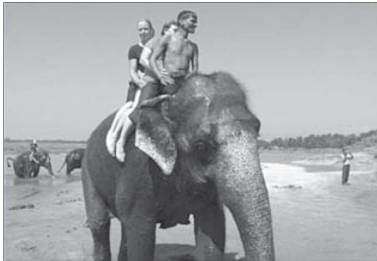
Мыть слонов – одно удовольствие

Наблюдение в тему. Когда один из российских туристов пытался торговаться при покупке камешка с ракушкой внутри, продавец, узнав, что он из России, сразу выпалил единственное русское слово, которое знал: “Ленин!” – и уступил в цене.