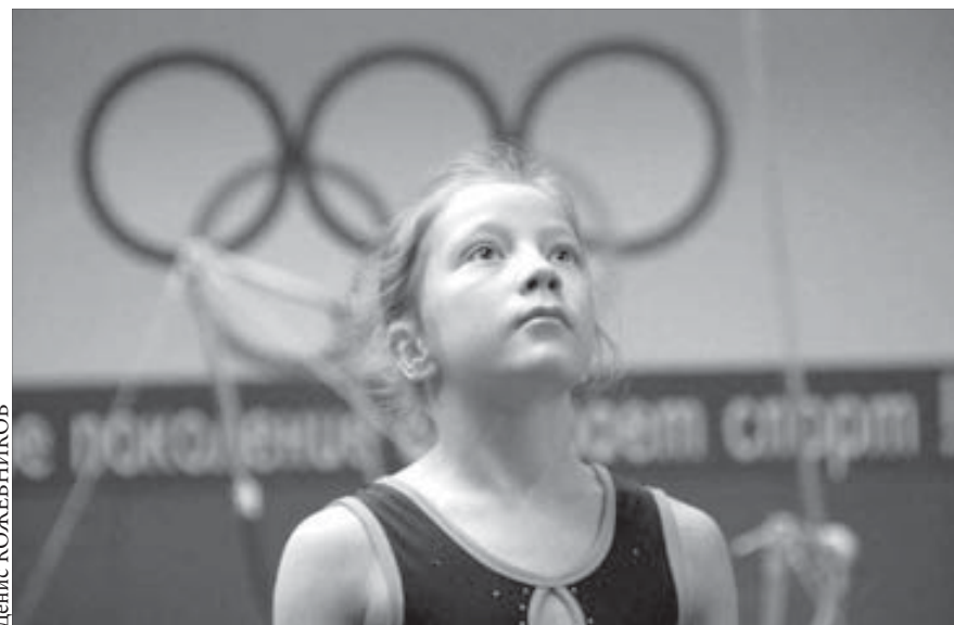
Юные норильчане талантливы во всем