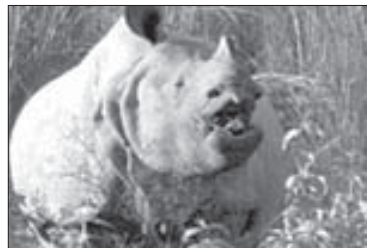
Дрессировке не поддается

Будучи в Непале, обязательно следует посетить родину Будды, а также множество уникальных памятников архитектуры – древние индуистские храмы и буддийские ступы и монастыри. Приверженцы йоги едут в Непал для обучения и погружения в астрал, а вот любителям активного отдыха стоит посоветовать (кроме восхождения в горы) рафтинг по горным речкам и полет на парашюте.