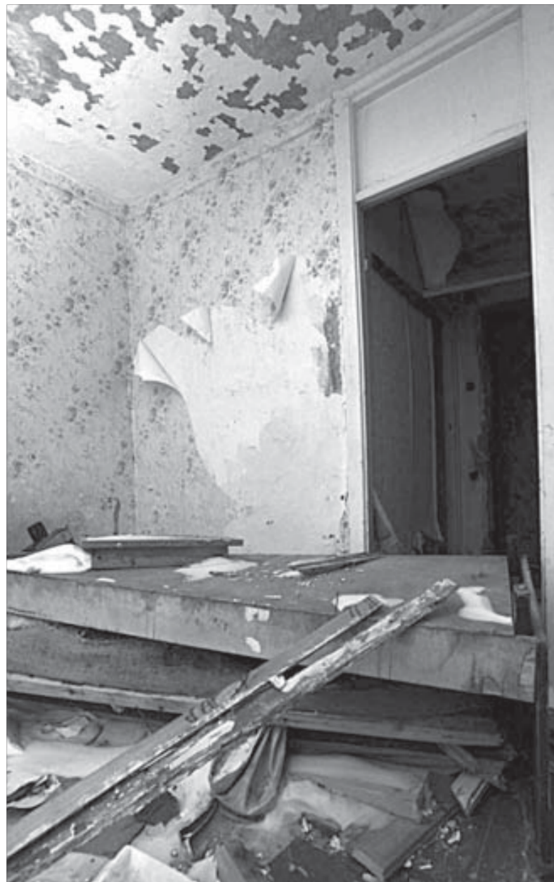
От подобного соседства, к сожалению, никто не застрахован