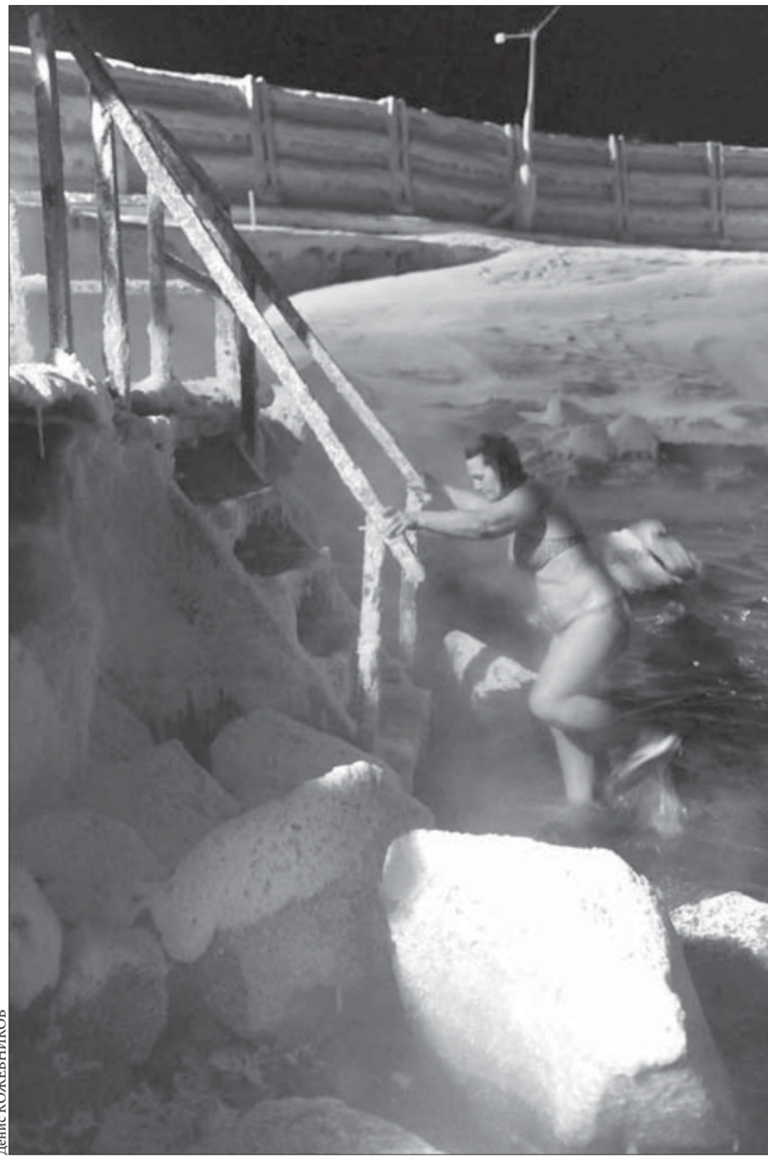
Осилить такое нужна споровка

На Таймыре пилот вертолета оштрафован за самовольный взлет с баржи, сообщили в Западно-Сибирской транспортной прокуратуре. По инициативе дудинского транспортного прокурора к административной ответственности по ч. 1 ст. 11.4 КоАП РФ (нарушение правил использования воздушного пространства) привлечен пилот вертолета Ка-26, осуществивший самовольный взлет с баржи, буксируемой теплоходом по реке Енисей. Не получив разрешения Норильского центра управления воздушным движением на проведение полета, пилот перелетел с баржи на берег Енисея, создав угрозу столкновения вертолета с другими воздушными судами. Пилот попытался скрыться от правоохранительных органов, улетев в один из труднодоступных районов Красноярского края. Однако его обнаружили и оштрафовали на 2,5 тыс. рублей.