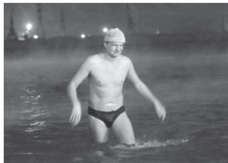
В шапочке волосы не замерзают