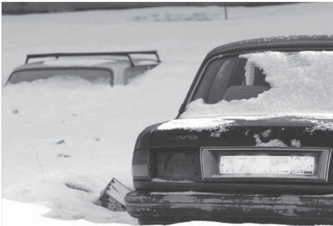
До обмена рухляди на отечественные “иномарки” дело может не дойти

Проблема вторая. У правительства нет критериев отбора дилеров — участников проекта. Проблема третья и, пожалуй, самая главная — в стране почти нет пунктов утилизации старых автомобилей: сейчас их всего 12-15.