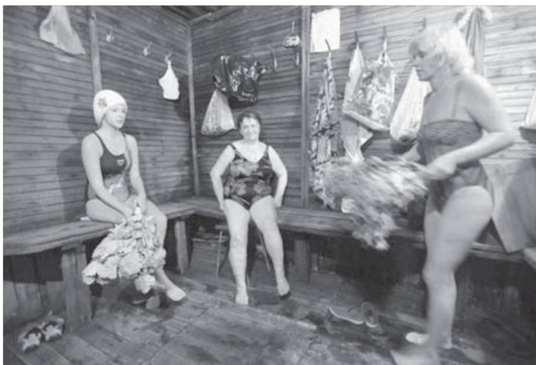
Сначала парилка. Долгое подождет

«Разминать кости» в понимании знатоков зимнего купания значит разогреться в парной на берегу. Редко кто из вновь прибывших, даже ветераны зимнего плавания, решаются сразу нырнуть в прибрежные воды. Точно так же, вынырнув из озера, купальщики бегут греться в парную.