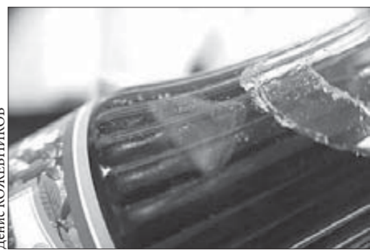
Там, за стеклом...

Большинство потребителей никогда не смотрит на срок годности продукта, беря первую попавшуюся под руку упаковку товара в магазине. И напрасно. На какие только уловки не идут продавцы, пытаясь сбыть залежалый товар.