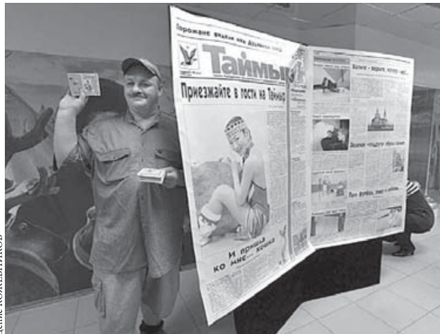
Газета "Таймыр" – попробуй обойди