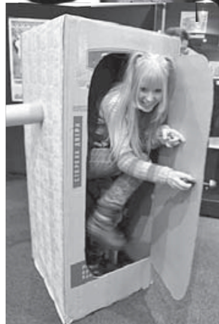
Поговорим в коробке