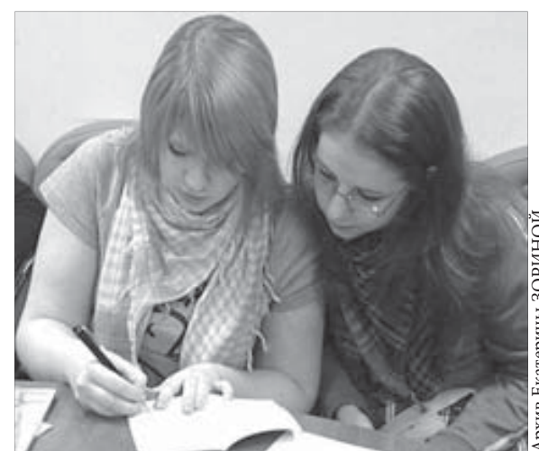
Есть первый автограф