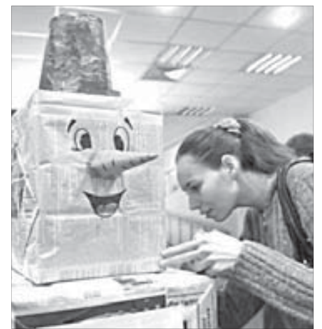
Что за экспонат?

первый взгляд детская игра "Пятнашки", в которой с удовольствием приняли участие гости всех возрастов: в ней надо было переставлять руки и ноги в кругах строго определенного цвета.