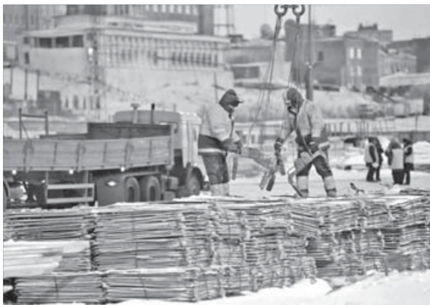
Продукция идет непрерывно

При этом были обеспечены снижение себестоимости привлечения договоров по сравнению с 2008 годом и в целом эффективность бизнеса. Полученные доходы по пенсионным накоплениям и резервам составили 1,3 млрд рублей. Варианты покрытия убытков, нанесенных фонду по результатам деятельности в 2008 году, изучаются.