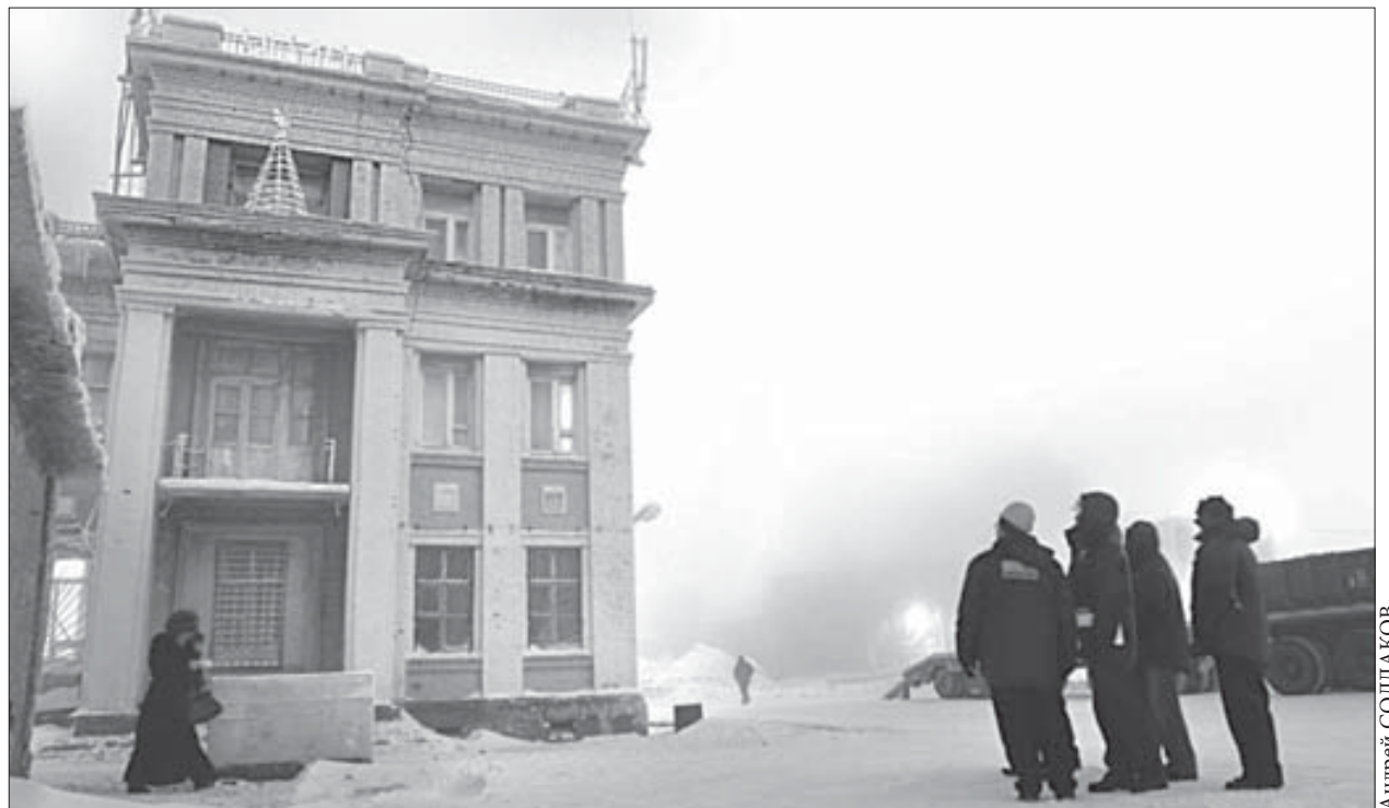
Зажженная елка – символ Нового года и выполнения плана