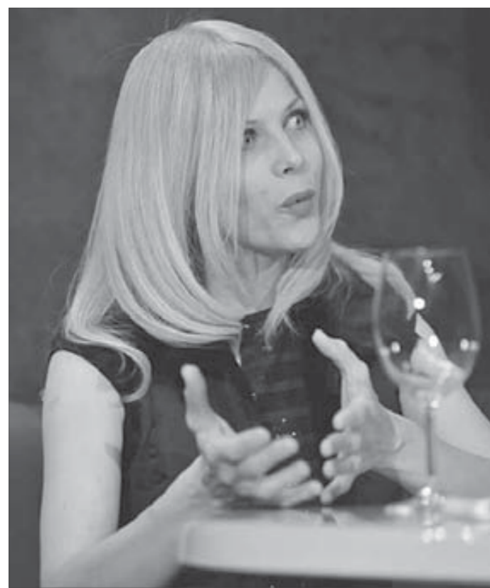
Русские мужчины такие джентльмены!..