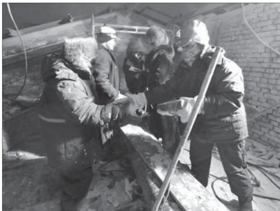
Над головой небо, до активировки три градуса