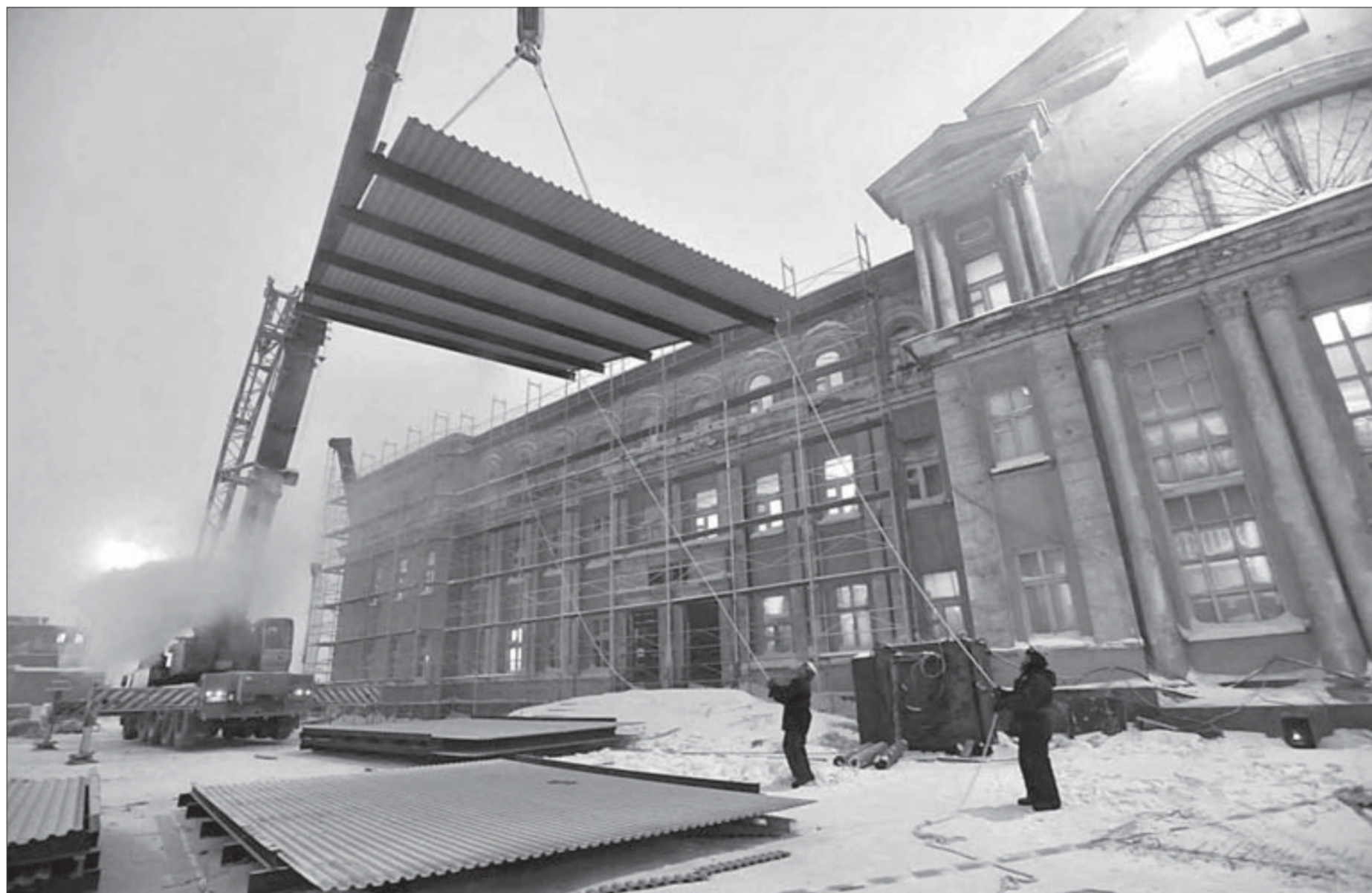
Будет у вокзала "шапка"

Все жилье в отличном состоянии, говорят специалисты администрации, которые проводят большую работу по поиску подходящих вариантов не только в Дудинке, но и в поселках Таймыра. Документы на право собственности и ключи уже переданы ребятам, обретшим собственное жилье. Финансирование приобретения жилых помещений осуществляется из бюджета Красноярского края.