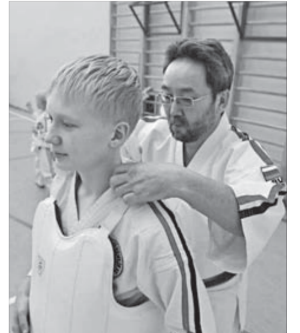
Нагрудник – важный элемент защиты бойца

Мечта норильских призеров чемпионата Европы – получить когда-нибудь черный пояс. А кроме того, попробовать себя еще на каких-нибудь международных соревнованиях. Насколько это реально в ближайшее время – другой воп-