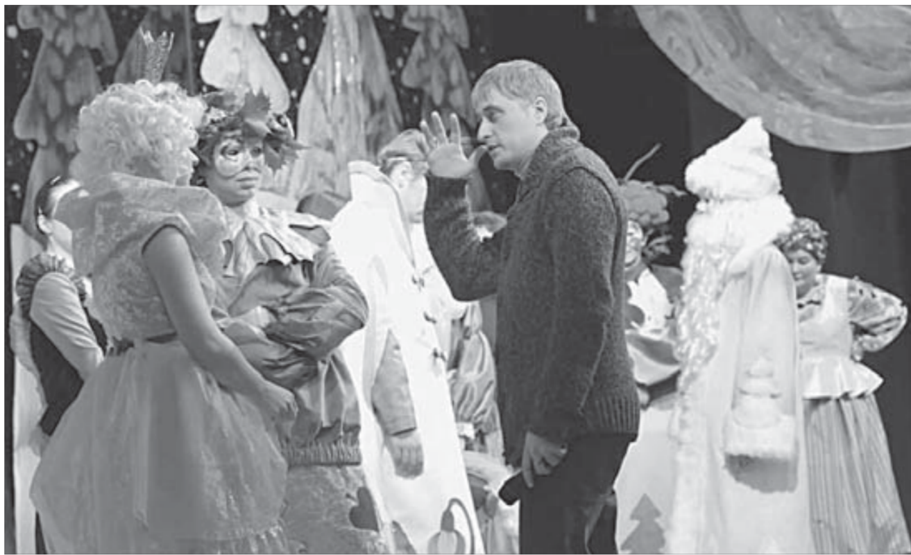
Последние наставления актерам перед премьерой