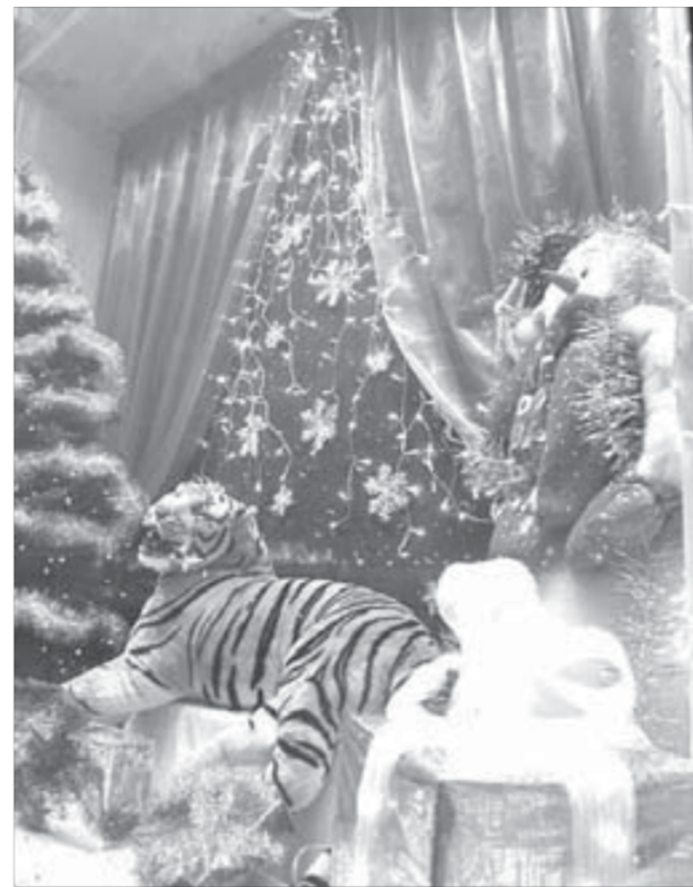
Тигр прилет перед дальней дорогой

Но и он, поверьте, не затмевает фантазию коллектива детского магазина “Северок”. Вот уж кто постарался порадовать и маленьких, и взрослых. К Новому году здесь начали