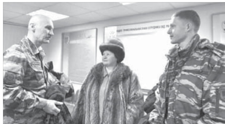
Благодарность за сына – лучшая награда для матери