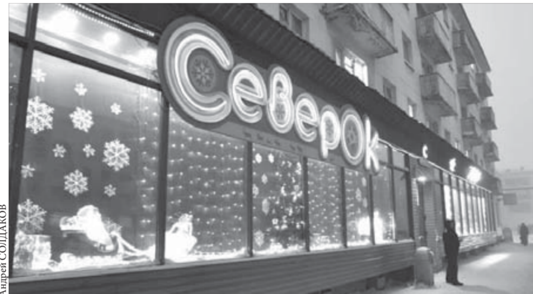
Витрина – знак уважения к покупателю