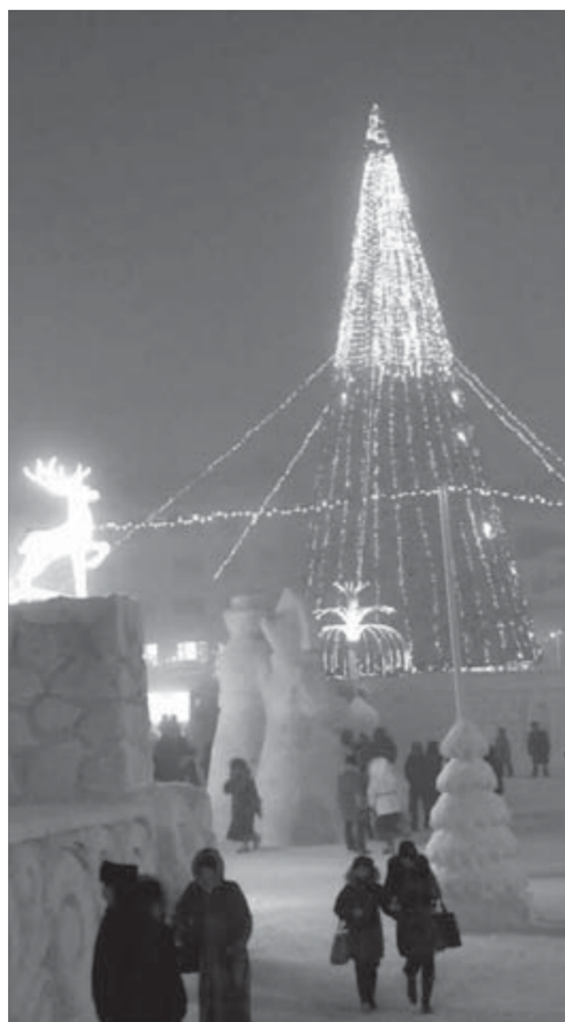
Олени, фонтаны, елка, мороз...