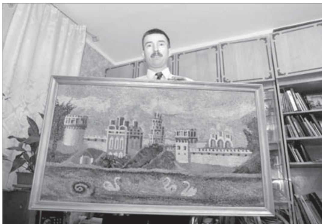
Эту картину Альберт вышивал почти четыре года

Чтобы предаться праздничному настроению в полной мере, необходимо полностью завершить все дела в уходящем году. Конечно, недели на это может не хватить, но попробовать стоит.