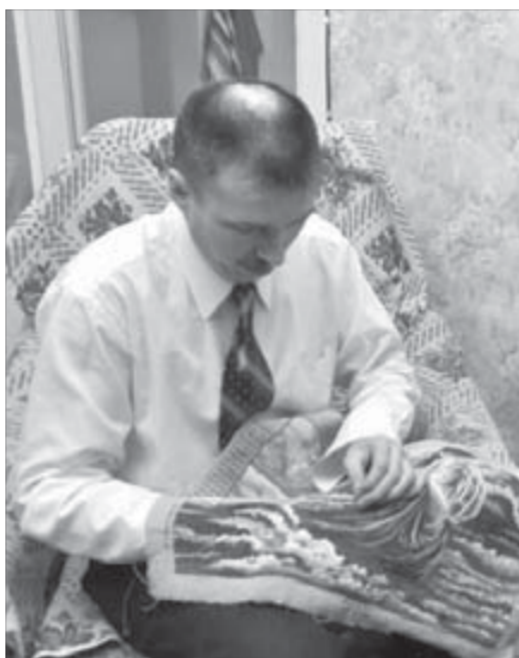
Хобби требует сосредоточенности

сещал школьником. Благодаря усвоенной науке служба в армии (в войсках специальной связи) пошла как по маслу. В жизни всегда так: любая добросовестно сделанная работа приносит дивиденды в будущем.