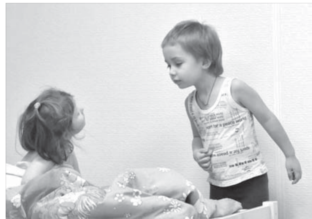
В группе собраны малыши разного возраста

Стоимость обучения в "Непоседе" – 11 тысяч рублей в месяц. По мнению руководства города, сумма эта вполне оправдывает результат: дети под присмотром, сыты, с ними рабо-