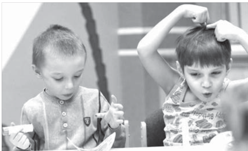
Апликация маме – вещь занимательная