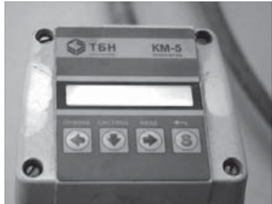
Всё точно подсчитают