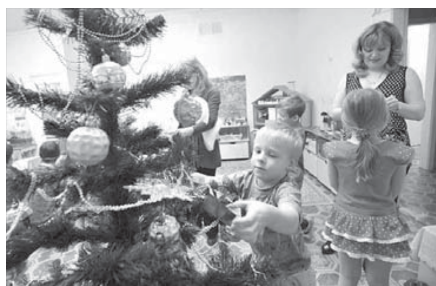
...и много-много радости деткам принесла

Корреспонденты "ЗВ" пролись по городу и отметили самые интересные елки Норильска. Благо выбирать есть из чего.