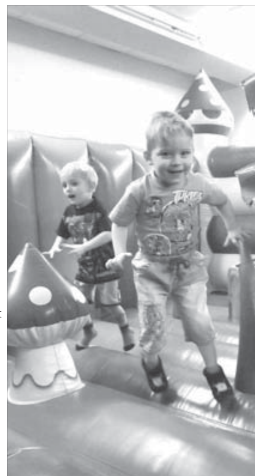
На багате, да под музыку...