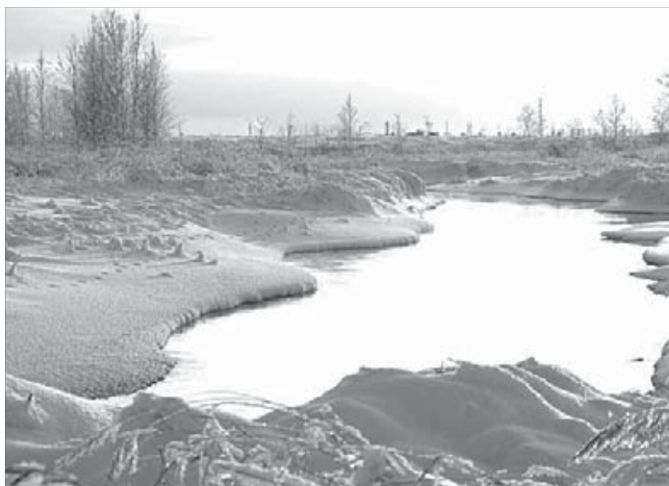
Север прекрасен в любую погоду

Другой конкурс – на лучшую фотографию о Севере – стартует 1 декабря и будет продолжаться до 1 апреля следующего года. Третьим конкурсом будет сохраненное для web фото размером не более 1000 пикселей по большей стороне. Авторы трех работ с самым высоким рейтингом будут вознаграждены персональной выставкой в Москве.