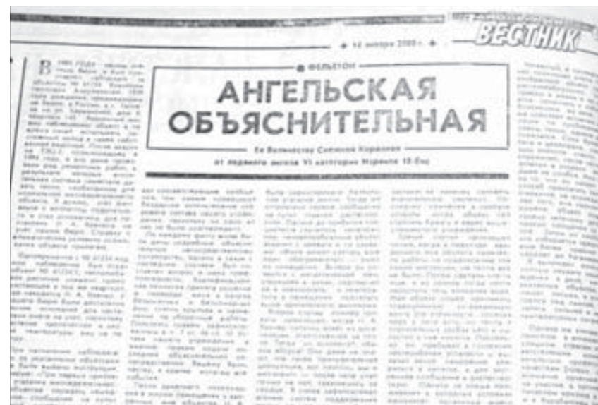
"ЗВ", 14 января 2000 года. За столько лет в квартире жителя Талнаха "климат" не изменился