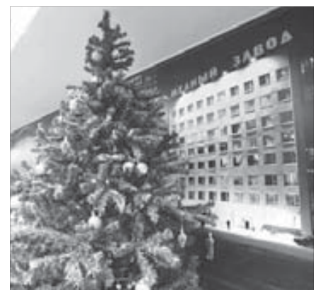
Игрушки на медном не медные. Самые обычные

На предложение поздравить норильчан с наступающим праздником Алеко Габуция от лица коллектива медного завода продекларировал: "Поздравляем с наступающим 2010 годом. Желаем вам признания, успеха, любви, вдохновения, достатка во всем и мечты исполнения!"