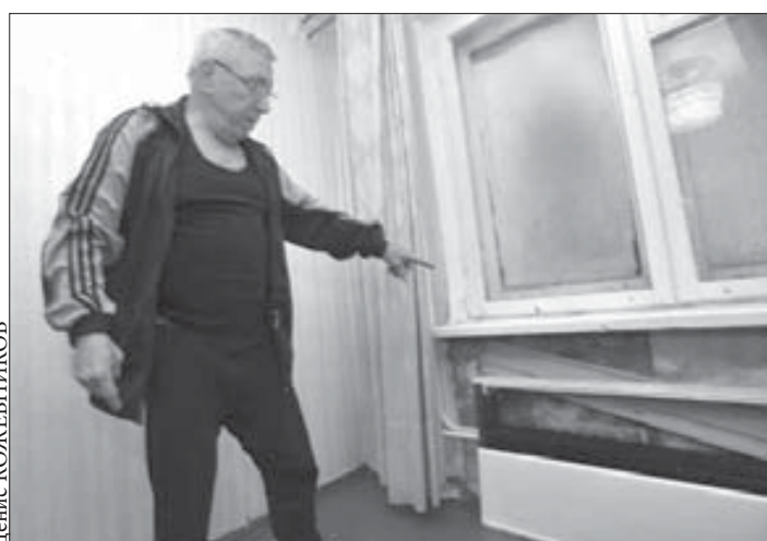
Ремонт делать бессмысленно, если не устранить причину залитий

Зима уходящего года принесла не только жестокие сорокаградусные морозы, но и резкое похолодание в некоторых талнахских домах. Жители Дудинской, 9, и Бауманской, 4, обратились в редакцию с просьбой помочь решить проблему.