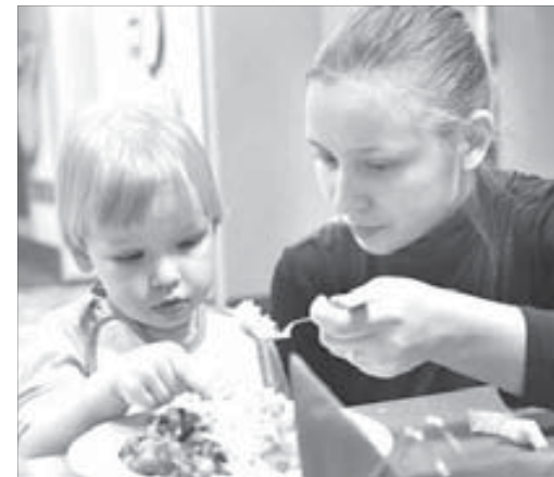
Питаются дети как в саду

тают специалисты. При этом администрация города не намерена давать послабления владельцам подобных центров и частных детских садов в их работе.