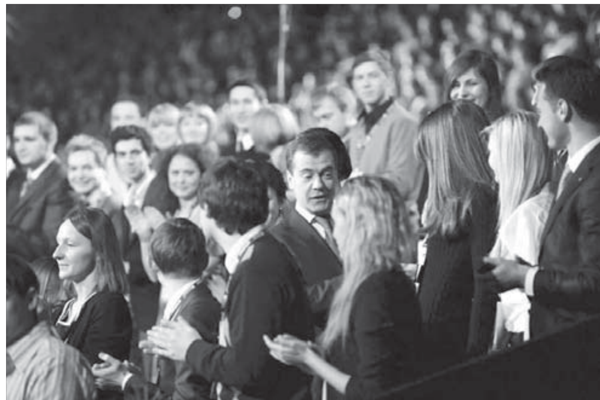
ПРОрваться к Медведеву было неПРОосто!

В рамках мероприятий, посвященных торжественному закрытию Года молодежи, в Москве прошел форум победителей, на котором присутствовала делегация норильчан.