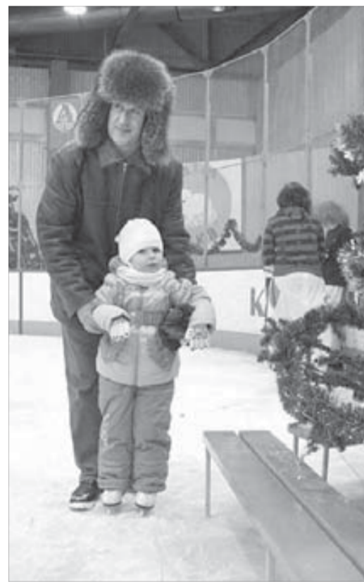
Интересно было и детям, и взрослым

Новогодний праздник на льду катка «Умка» устроила для молодежи талнахская администрация.