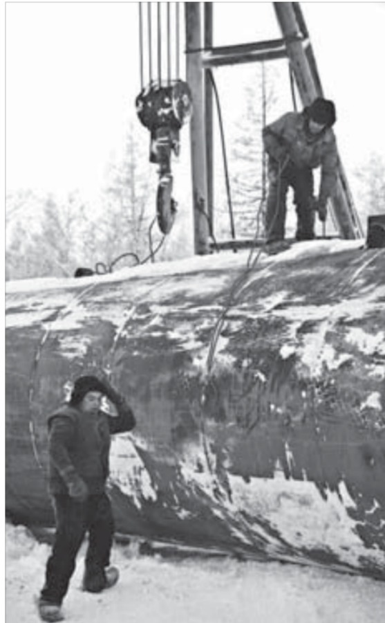
Зима, Север, мороз, ветер. Условия работы – жесткие

1. Самый горячий момент для нас было начинать ликвидировать аварию первыми. Следующие подразделения шли по накатанному пути, мы были первопроходцами. Работники треста и раньше участвовали в подобных акциях, но здесь имелось одно неудобство: рядом с этим водоводом идет авионавигационный кабель, который ни в коем случае нельзя было сжечь. Иначе – смело закрывай аэропорт и никуда не летай. Поэтому мы находились в поиске. Пробовали греть трубы разными способами, обливали керосином и под-