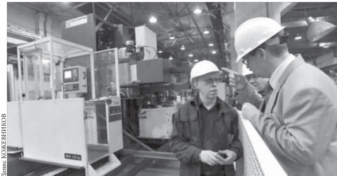
"Это станки XXI века!"