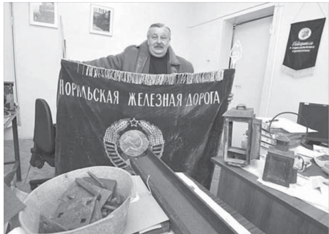
Основа будущего музея НЖД