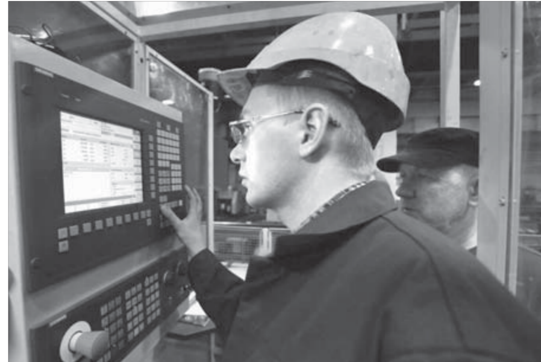
Управление станком полностью компьютеризовано

Реконструкцию дороги Хатанга – станция тропосферной связи и двух мостов через Нижний Чиерес на этом участке начали в 2004 году. После закрытия станции тропосферной связи участок реконструкции был сокращен до базы горюче-смазочных материалов и составил 3,6 километра.