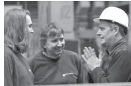
Чехи довольны своей работой

– Работа по обновлению основных фондов механического завода ведется активно. Введены в строй две машины термической резки, обнов-