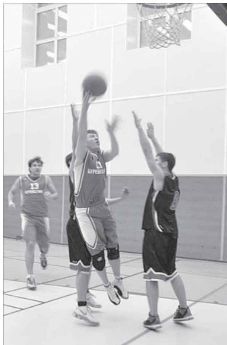
"Старичкам" не удалось одолеть молодежь