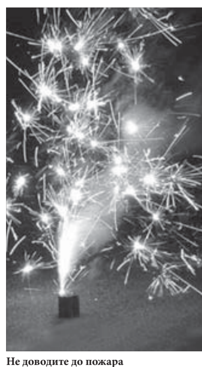
Не доводите до пожара

К слову, трагедия в Перми вскрыла мощный пласт всевозможных наруше-