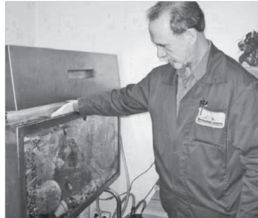
С рыбками комфортно

на чердаке дома, потом мы построили первую голубятню. Я проводил с ними все свое время. Иногда даже забывал пойти на первый урок в школу. У меня же птица летает, как у ее брошу! Мама, конечно, ругалась.