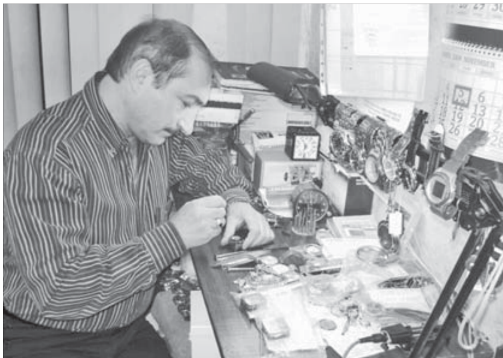
На рабочем столе часового мастера нет ничего лишнего