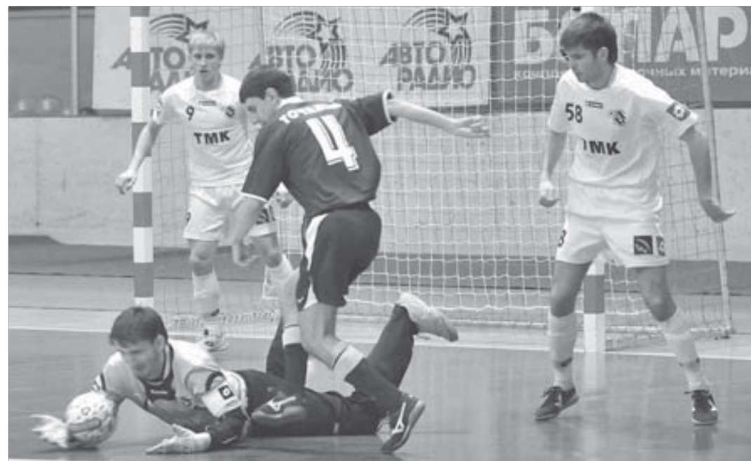
Голкипер "ВИЗа" дал осечку только один раз