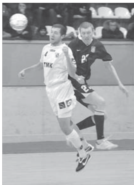
Чемпионы должны уметь все. Даже летать

МФК "ВИЗ-Синара" в очередной раз доказал, что не зря носит титул сильнейшего клуба страны.