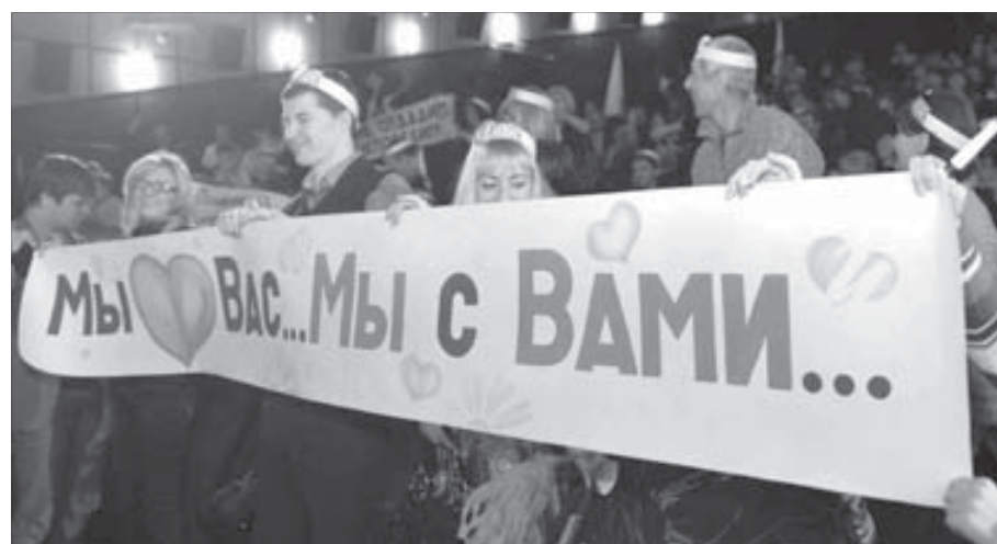
Болельщики два вечера поддерживали свои команды

В отличие от конкурсантов первого дня, семь творческих коллективов, соревновавшихся во второй день, меньше говорили о современном производстве. Тему “Сердцем согревая мерзлоту” они предпочли раскрывать, используя исторические факты и дела семейные. Так что в целом седьмой конкурс “Мой любимый Дед Мороз” получился многоплановым и весьма интересным. Похоже, выступления команд понравились не только взрослым зрителям, но и многочисленным детям, сидевшим в зале. Особенно они обрадовались возможности са-