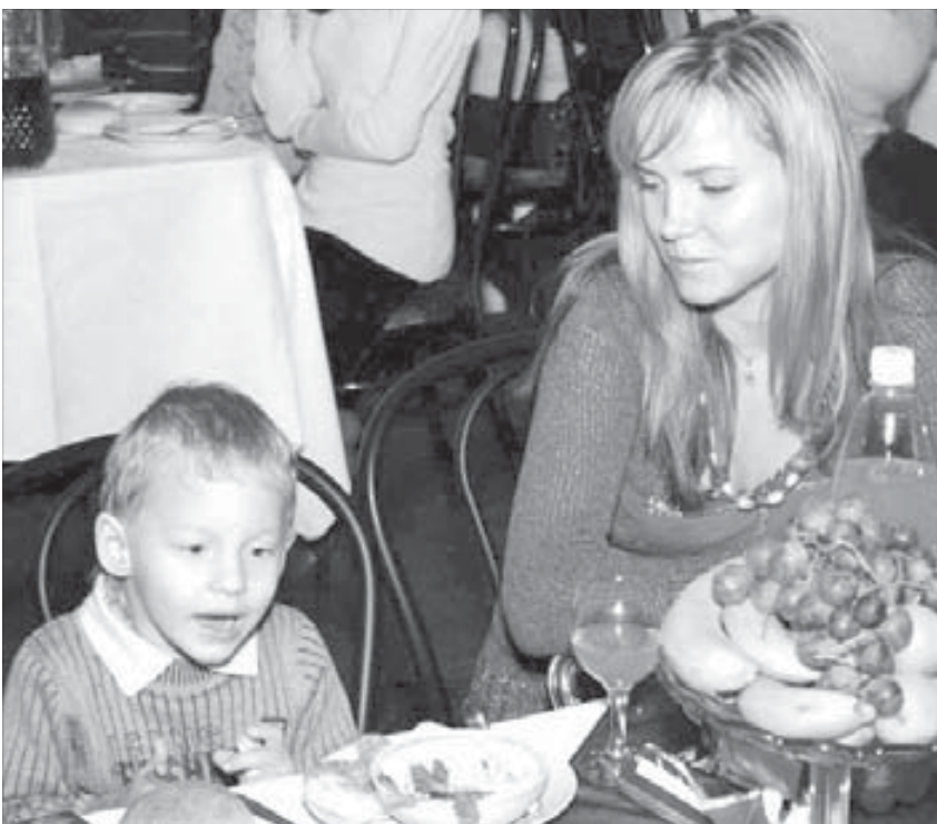
Праздничное угощение пришлось по вкусу

Разнообразные блюда юные гости тоже не обошли вниманием. Угощались с радостью. Инициатор встречи, председатель общественной организации родителей, воспитывающих детей с ограниченными возможностями, "Виктория"