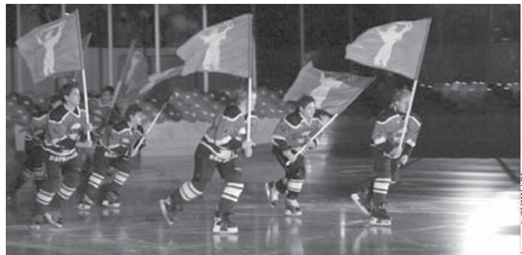
На льду надежды Норильска