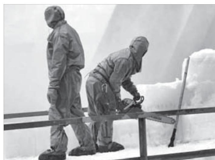
И для бензопилы работа найдется

К тому же сейчас полным ходом ведется строительство дополнительного берегового водосбора, который необходим для повышения надежности и безопасности всей станции. Стоимость этого проекта 4 миллиона 330 тысяч рублей. А все-