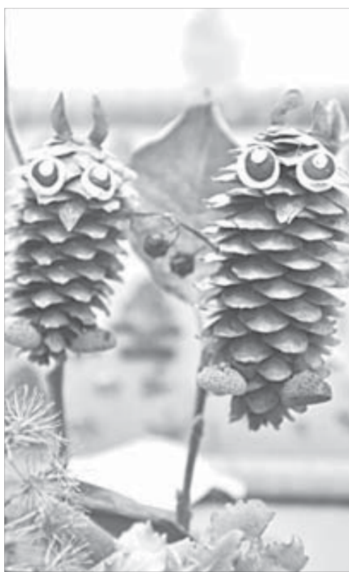
Выставка привлекла внимание гостей...

Поддерживая своих малышей на занятиях, родители и сами активно включаются в творческий процесс. Миниатюры "Небылицы в лицах" с участием мам повеселили гостей и самих актеров. Сейчас в планах Валентины Лисицы и клуба "Росток" подготовка к Новому году. Ребята хотят устроить праздничный утренник.