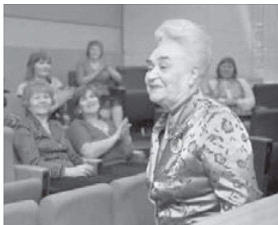
Возраст активной жизненной позиции не помеха...