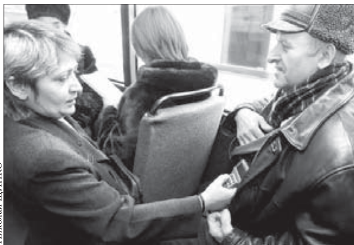
36 поездок за те же деньги

Сейчас в Норильске проживает порядка 27 тысяч льготников. Единые социальные карты оформили 23 148 человек, получил на руки 18 231 человек. С 1 декабря офис на Московской, 19, где ведется оформление и выдача ЕСК, по субботам работать не будет. В выходной сюда, по словам Токарчука, приходит не более пяти человек.