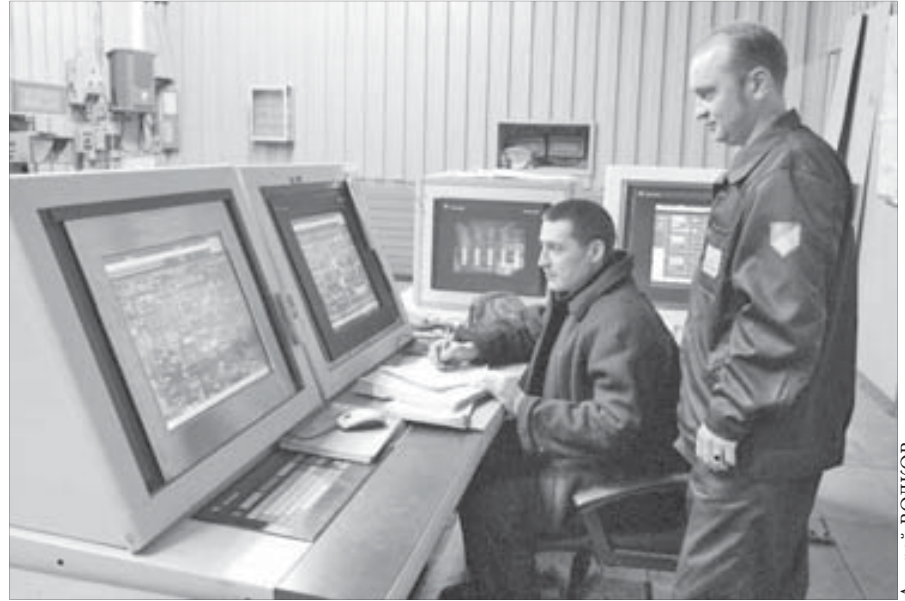
Все под контролем

Сапегин родился под созвездием Близнапов. Как утверждают астрологи, влияние Меркурия создает вокруг рож-