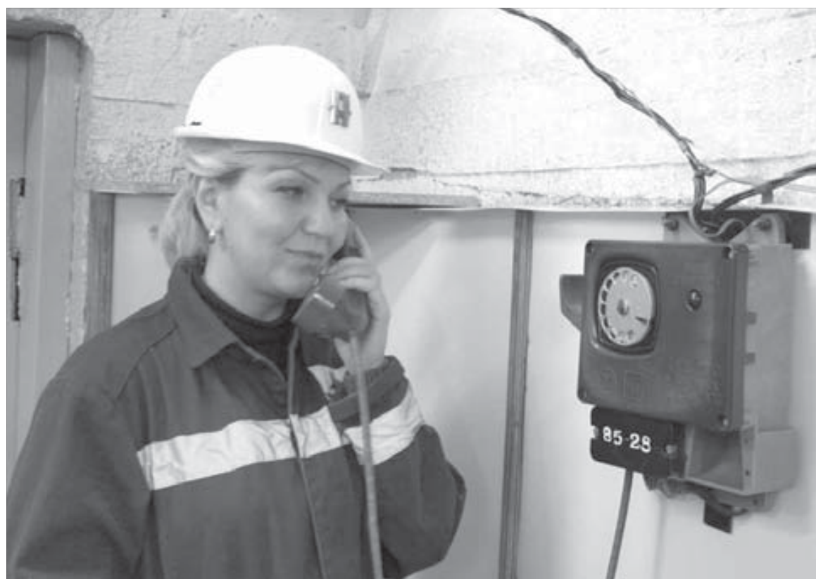
Подземный фельдшер всегда готов прийти на помощь