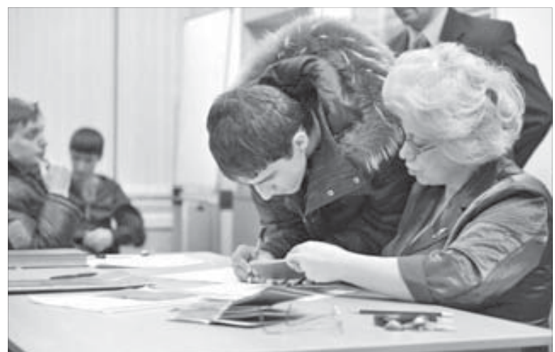
Подпись, автобус, самолет, сборный пункт...

В 23.30 призывники распрощались с родными и близкими. В 4.00