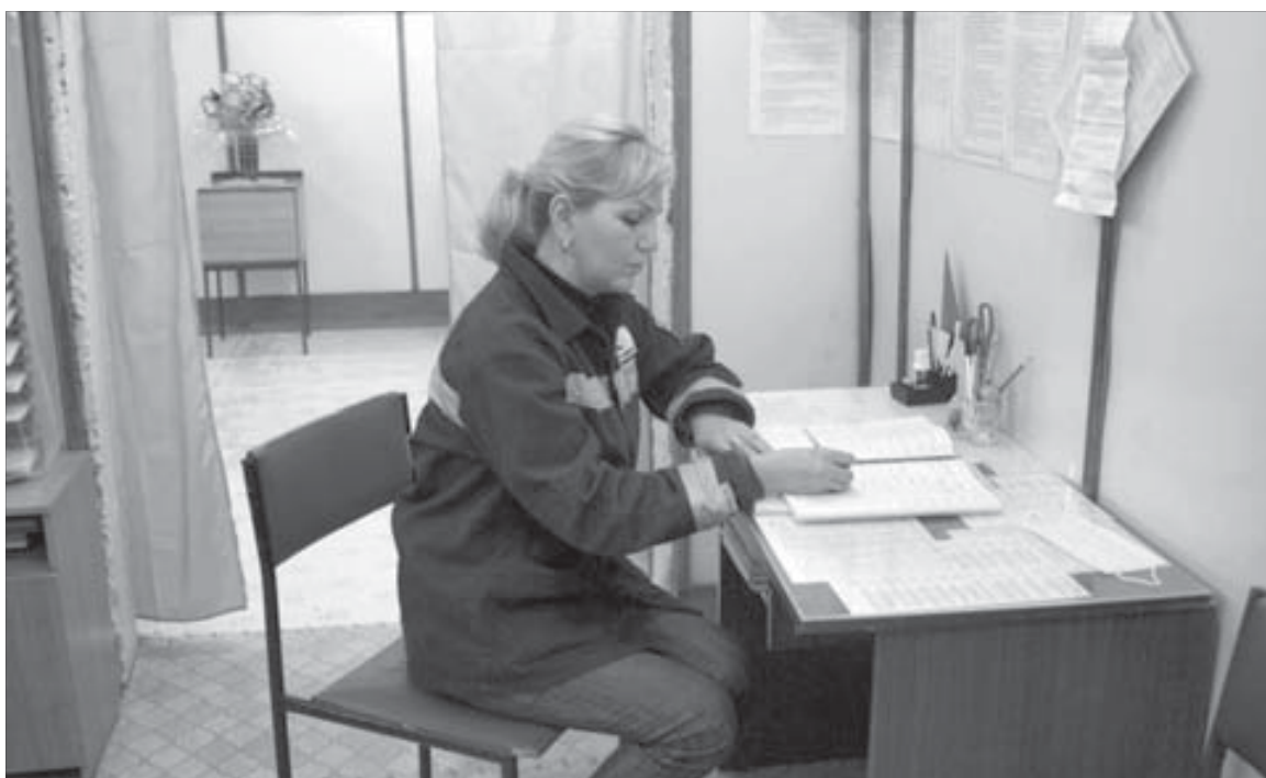
Любое обращение работника фиксируется в специальном журнале