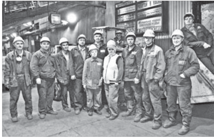
На сушильном участке все молодцы

шего, приближающегося к золотому юбилею “тертого калача” сушильного и по-юношески максималистского, кипучего серного.