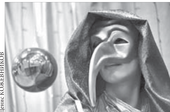
Маска, кто ты?