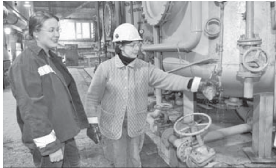
Хозяйский острый женский глаз

Созданное в 1999 году в результате объединения сушильного цеха и цеха производства элементарной серы новое подразделение завода отмечает свой первый юбилей. Если нас спросят, какими были эти десять лет,