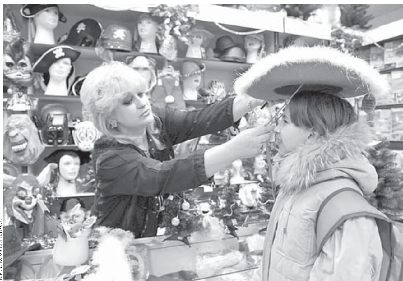
Шляпа, маска – и не узнать!