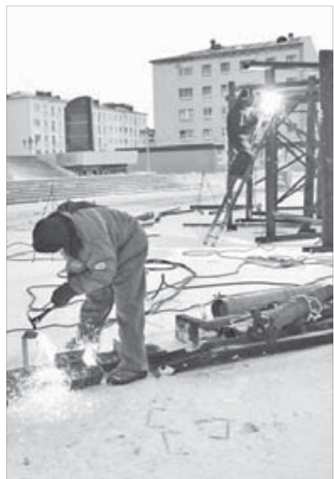
Работы уже начались

Снег для фигур по договоренности с администрацией района Кайеркан завозится в будущий городок из дворов жилых домов. Уже начался монтаж главных элементов. В Кайеркане их будет установлено две: на въезде в город и перед зданием администрации района. В Оганере – у школы №41.