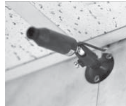
Эта камера все видит