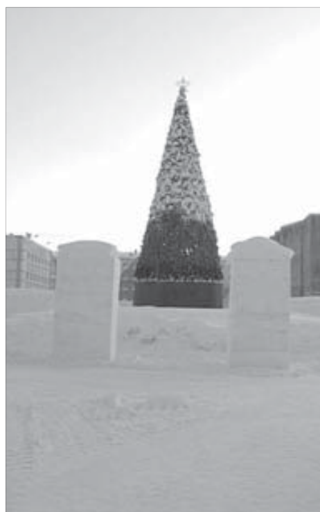
Пока не наряженная