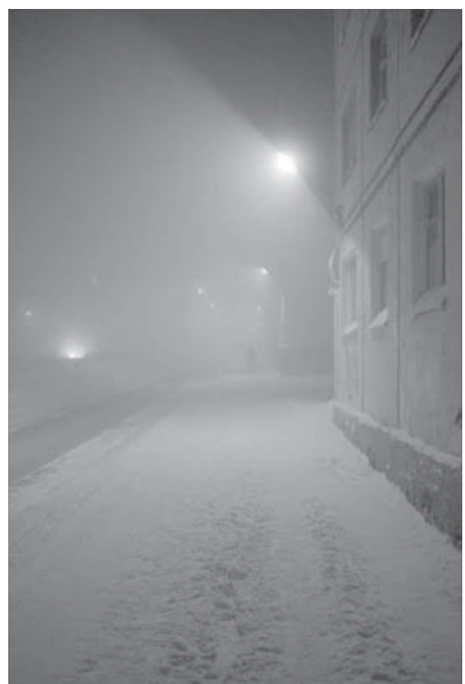
Ночь, улица, фонарь... И так до середины января

– В декабре-феврале, то есть как раз в период полярной ночи. По данным лаборатории психолого-социальных исследований НИИ медицинских проблем Крайнего Севера РАМН, две трети жителей северных территорий страдают депрессивными расстройствами. Более уязвимы женщины, но если в Центральной России депрессивные расстройства отмечают у женщин в два раза чаще, чем у мужчин, то на Севере – чаще в пять раз. Женщины на Севере труднее и в физическом, и в эмоциональном плане, потому, видимо, многие северянки склонны к алкоголизму. У мужчин критическим периодом следует считать 50-летний возраст, у женщин депрессия усиливается уже к 40 годам.