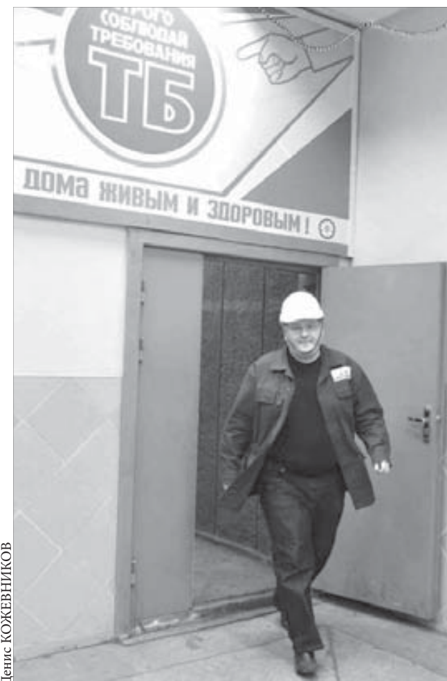
Пришел на МЗ в 2000 году