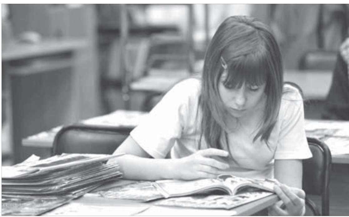
В школе-интернате журналы нарахсват

Во Всемирный день ребенка "Заполярный вестник" навел воспитанников школы-интерната №2 и подписал их на популярные детские журналы.