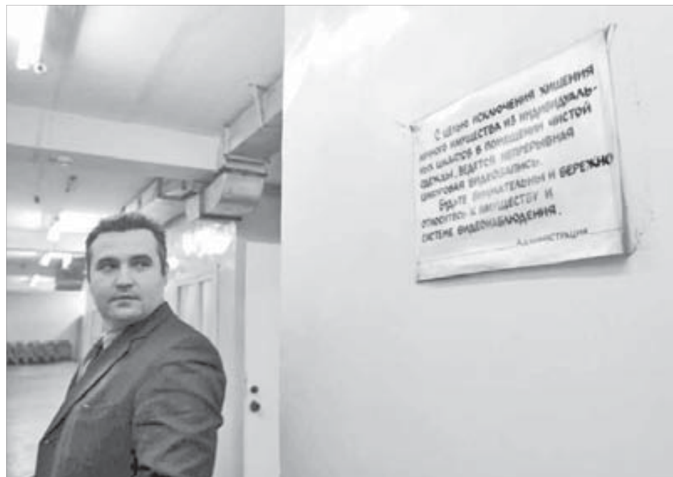
Горняки проголосовали за установку видеонаблюдения