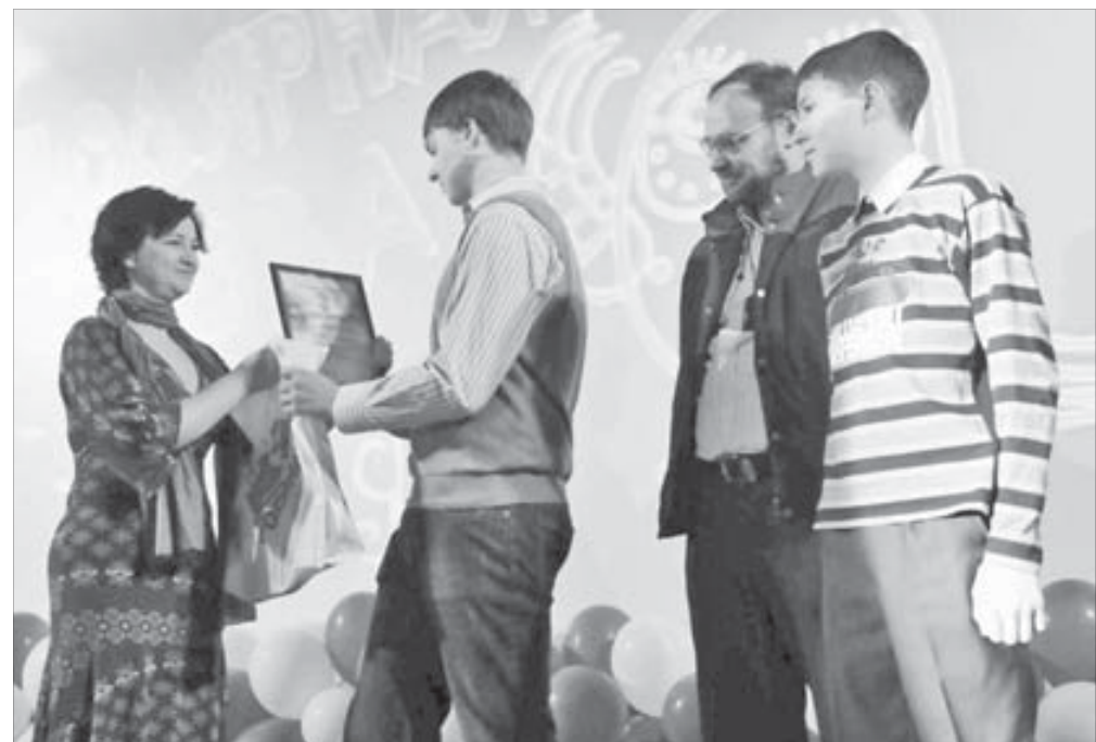
“Перемена” получила два первых места

Конечно, хочется, чтобы усыновленных детей было больше. Чтобы помимо слов были конкретные действия. И добрые побуждения взять малыша из детского дома не заканчивались на ступенях отдела опеки и попечительства.