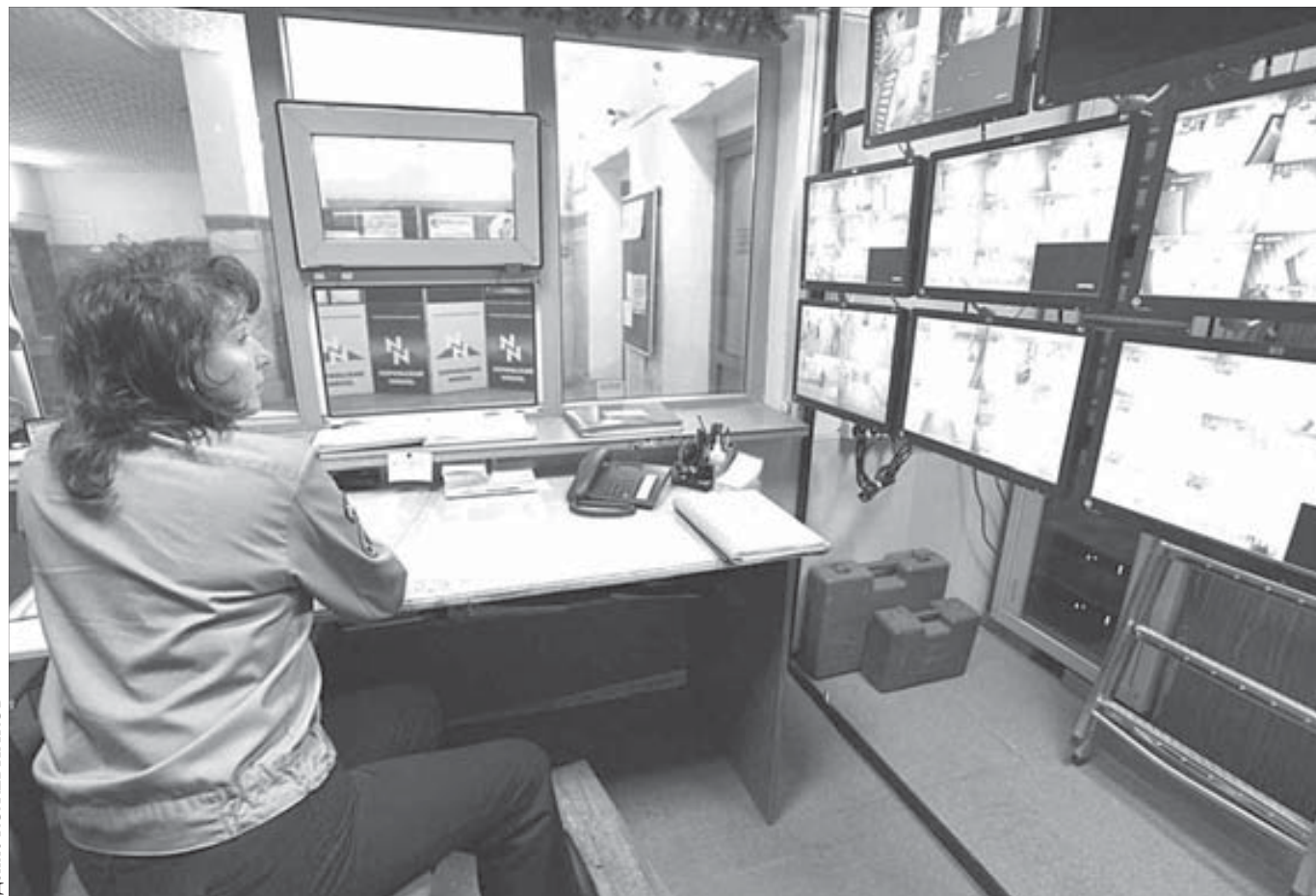
Доверие и контроль совместимы

27 ноября МФК "Норильский никель" на домашней арене в ДС "Арктика" принимает "ТТГ-ЮГРА". Начало матча в 19.30. Встреча пройдет в рамках четвертьфинала Кубка России по мини-футболу. Ответная игра состоится на площадке соперника 23 декабря. В случае успеха в двухматчевом противостоянии северяне в полуфинале встретятся с победителем пары "Сибиряк" – "Динамо-Ямал".