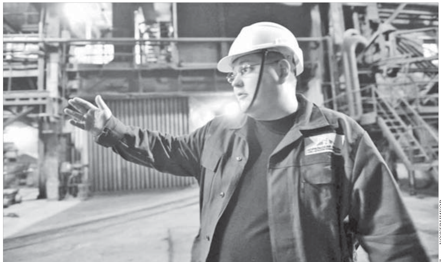
В плавильном цехе работа более оперативная

– Вы ведь тоже в свое время играли в KBNN.