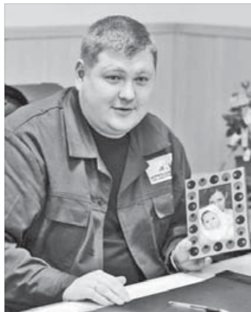
Жена и сын всегда рядом