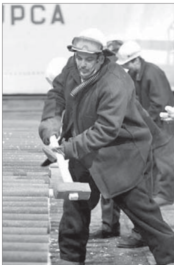
Конвертерщик – профессия сильных