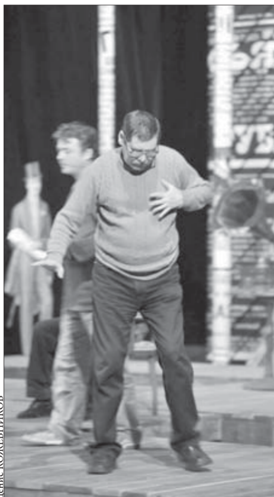
В театре готовят еще одну чеховскую премьеру