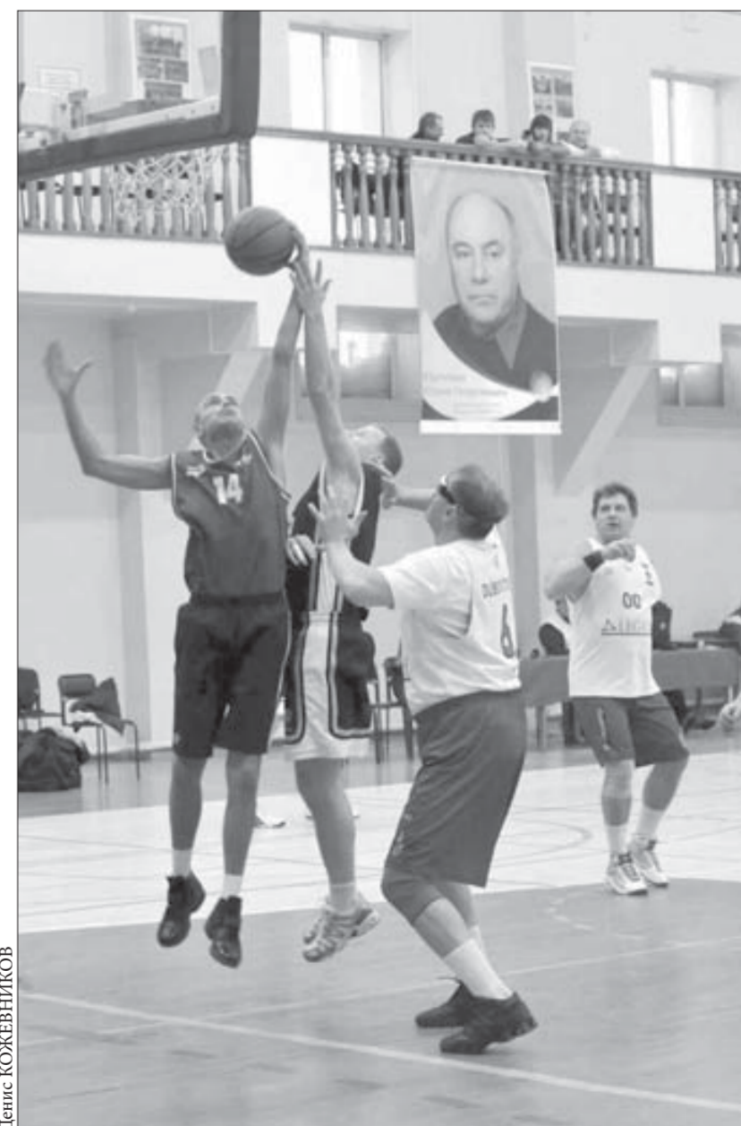
Большой баскетбол – большому мастеру