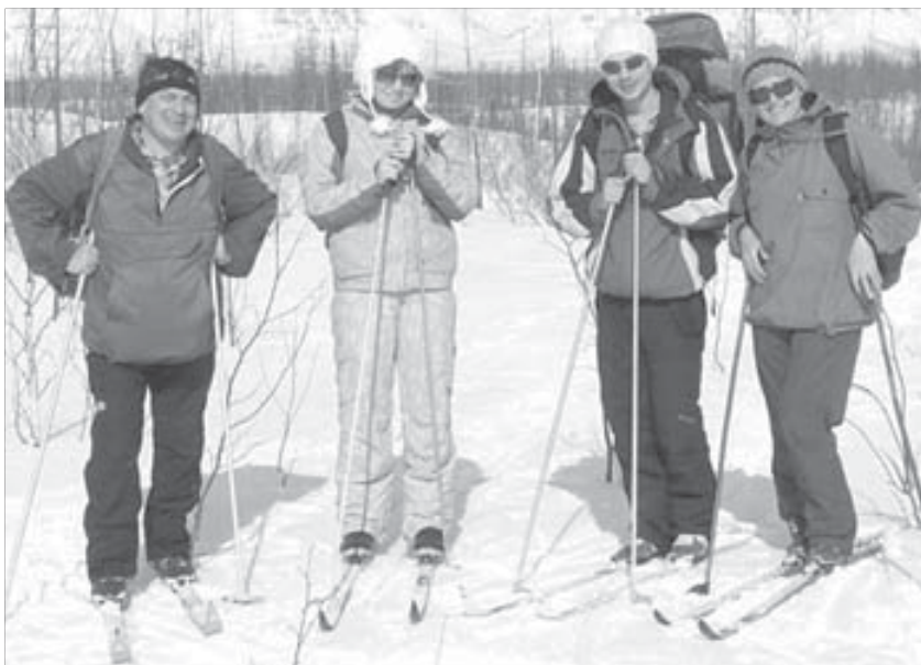
Лыжный спорт – семейное увлечение династии Голубь

Норильчанам желаю семейного счастья и крепкого здоровья. Отдельно коллегам желаю совершенствоваться и расти в профессиональном плане. Уровень коллег под сомнение не ставлю, но, как говорится, нет предела совершенству. И еще желаю, чтобы наш отдел пополнился толковой и грамотной молодежью, чтобы ветераны, забирая трудовые книжки, четко знали: есть люди, которым можно доверить любимое дело. Доверить тем, кто не подведет.