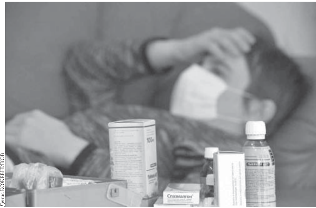
Лекарства для ребенка можно получить бесплатно