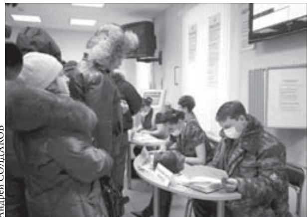
Кто ищет – тот найдет

Наплыв посетителей на ярмарке вакансий объясняют несложно – ряды безработных пополняются каждый день. Статистика говорит, что только за десять дней ноября число безработных в крае с 38 488 увеличилось до 38 640 человек. Безусловно, есть в этих тысячах и норильская капля.