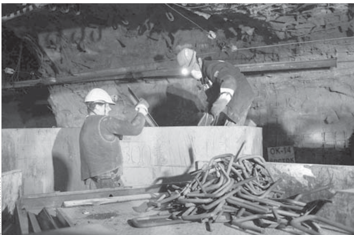
Горняки разгружают арочную крепь