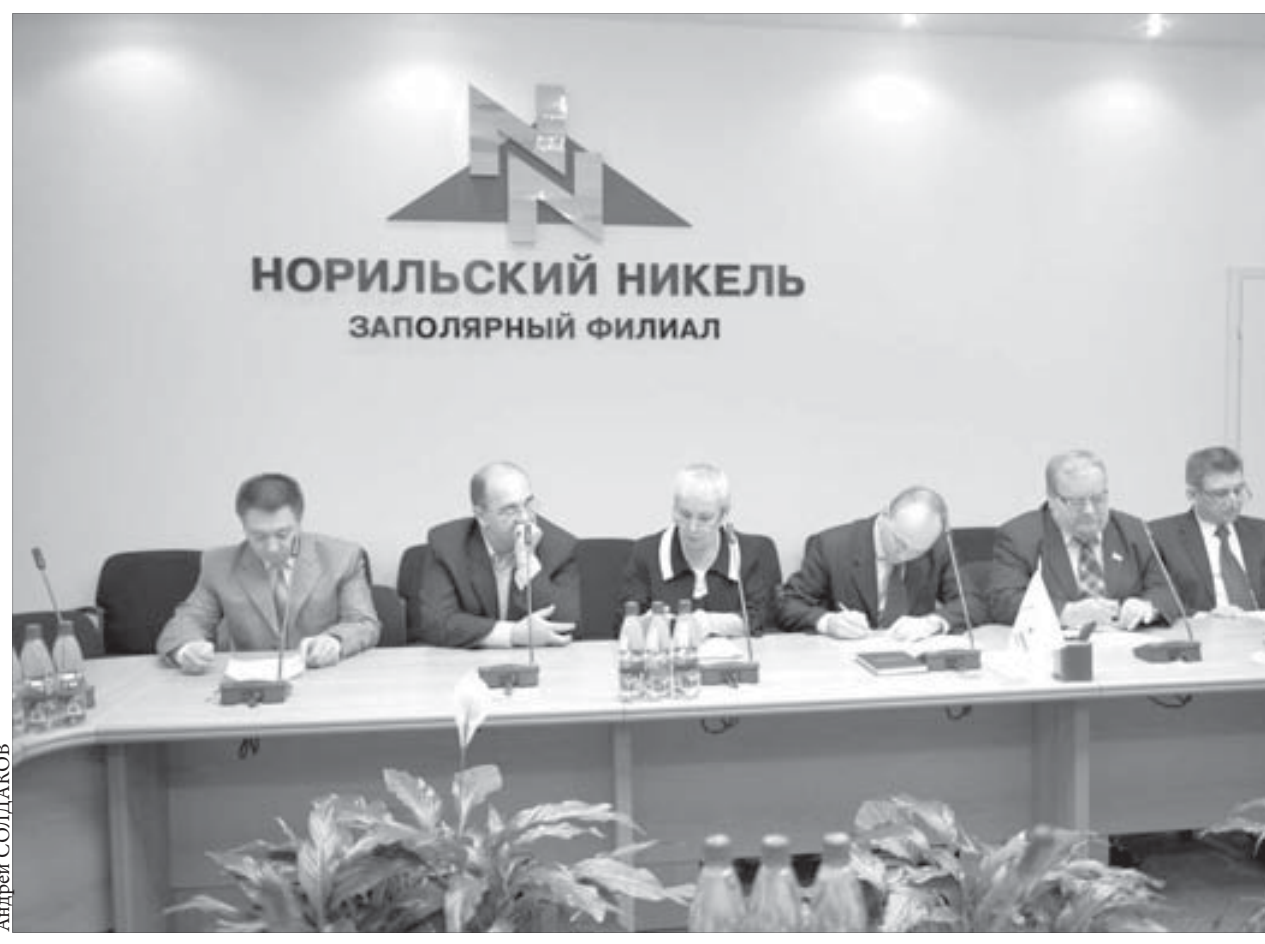
Договор продлен еще на три года

Знак был установлен во время рейса научно-экспедиционного судна “Михаил Сомов”, об этом сообщает Северное региональное управление Федеральной службы по гидрометеорологии и мониторингу окружающей среды. Памятный знак представляет собой двухметровую стальную пирамиду, на которой размещены барельеф и две памятные доски.