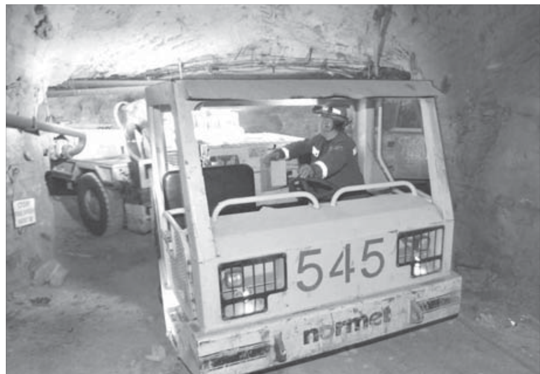
В подземных выработках идет оживленная работа