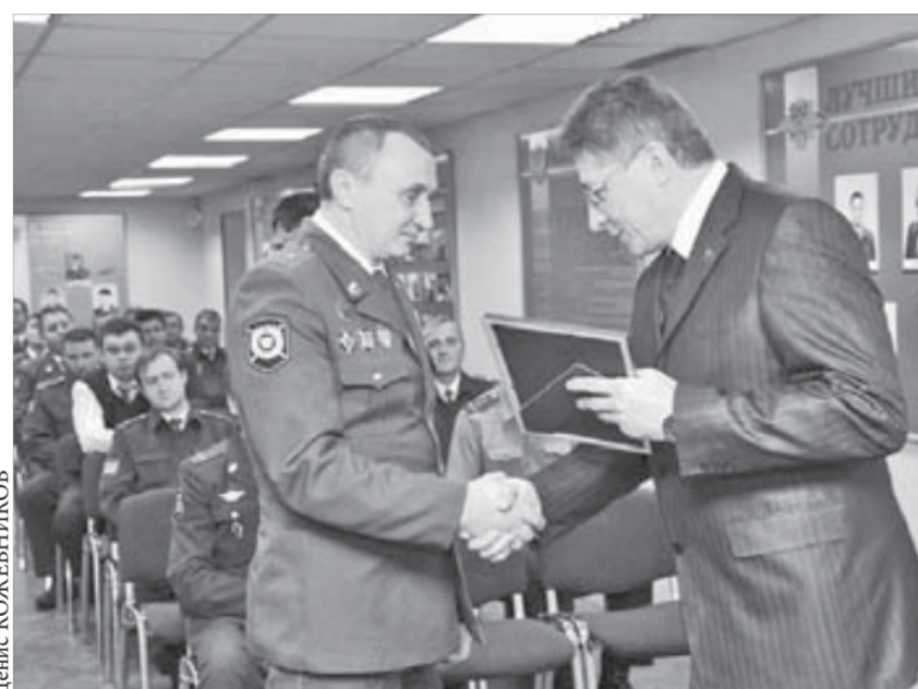
Участковые остались довольны поздравлением

Вчера участковые уполномоченные милиции отметили профессиональный праздник. Со дня образования их службы прошло 86 лет.