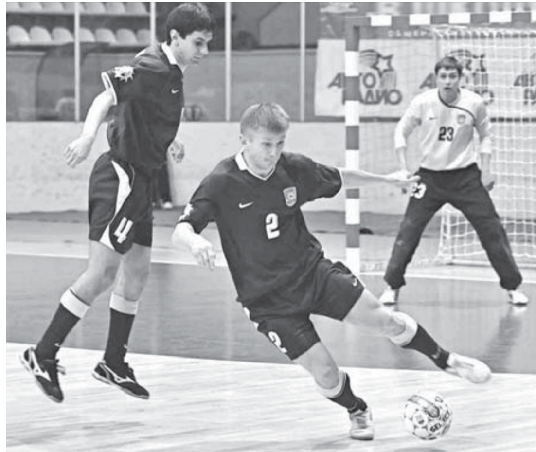
Норильчане достойно сыграли с чемпионом Казахстана