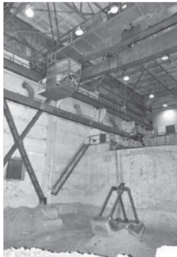
Базальтовый и доломитовый щебень превращается в минеральную вату

прочим, из подобных панелей построено большинство производственных цехов «Надежды».