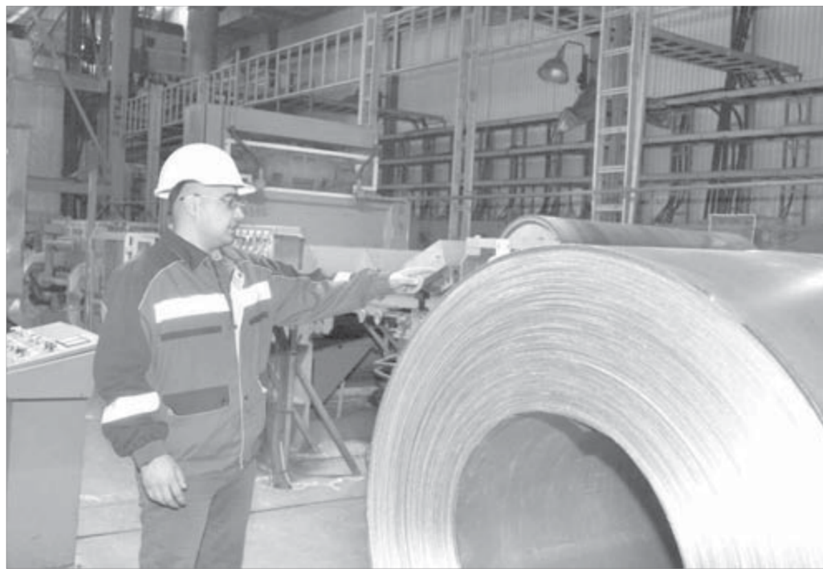
Исходный материал для основных панелей приходит на завод в рулонах