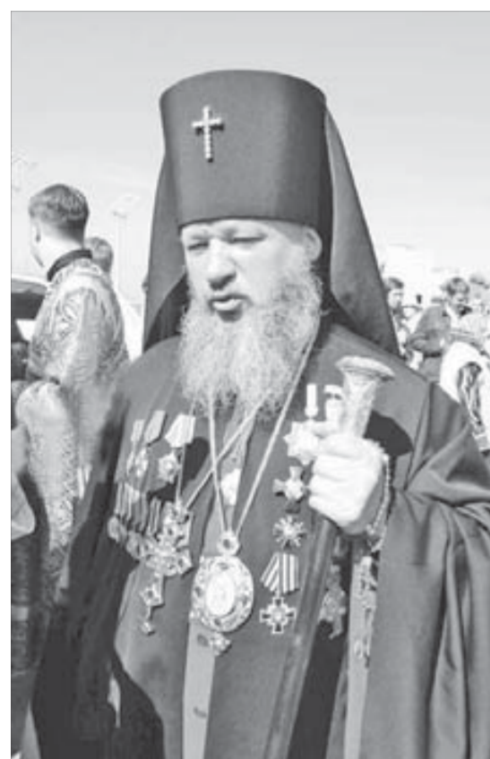
Благодаря владыке и на норильской земле появился храм