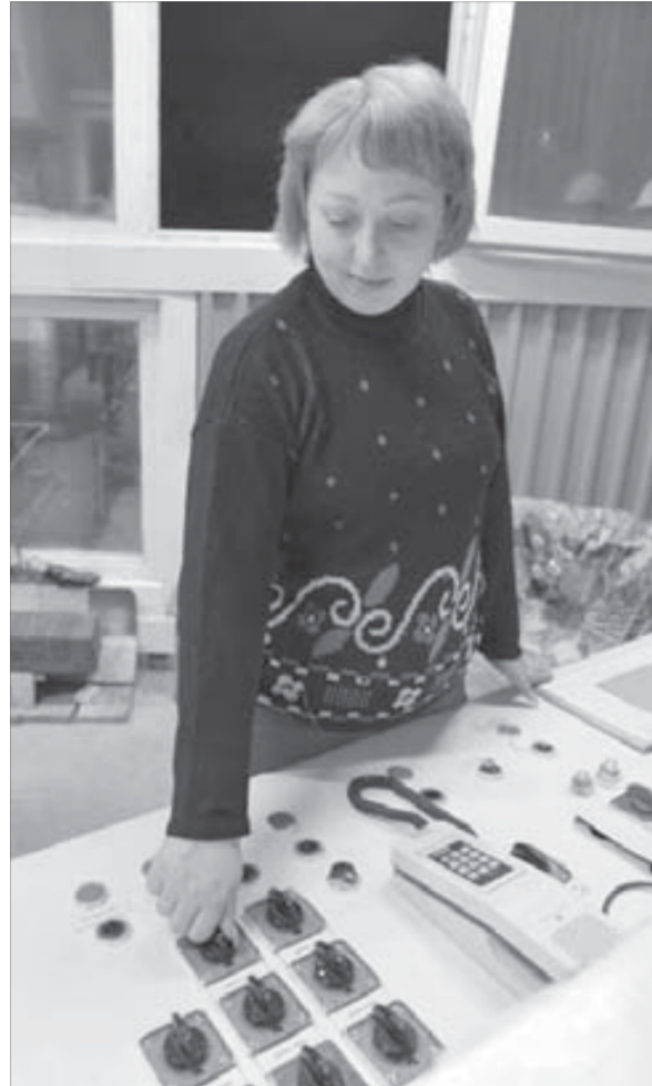
Операторы конвейерной линии владеют смежными специальностями