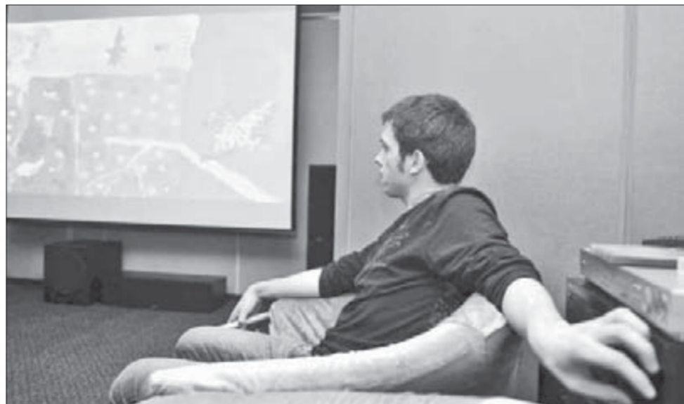
Выбрать лучшее – непросто...

Как обычно, в программе очень много мультфильмов. В этом году их авторы не только малыши, но и ребята 15-16 лет, представляющие красноярскую медиа-студию "ПрактикуМ" – их работы мне показались очень интересными. Будут и совсем взрослые мультипликаторы, – поделилась