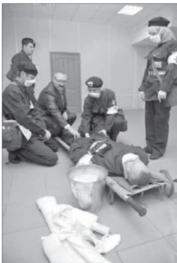
В "зоне заражения" надо действовать быстро и точно