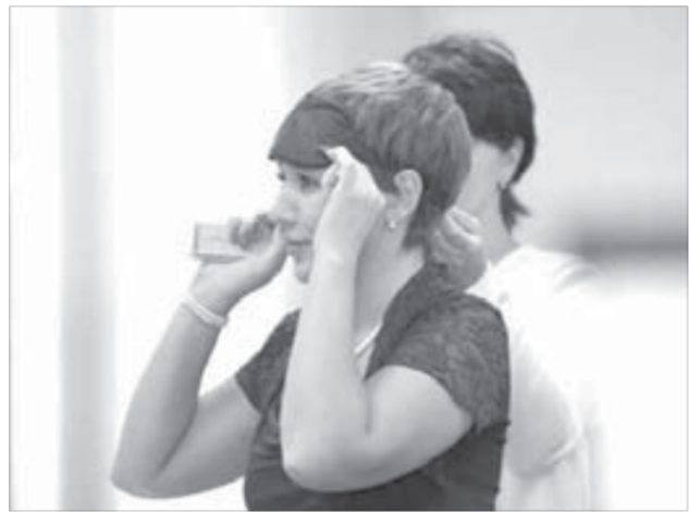
...а некоторые — все, что подвернется под руку

...В ООО "Энерготех" топился народ. Можно было только порадоваться: лицо кассира, принимавшего платежи, было скрыто под маской. Однако на этом положительные эмоции милиционеров от увиденного и закончились: