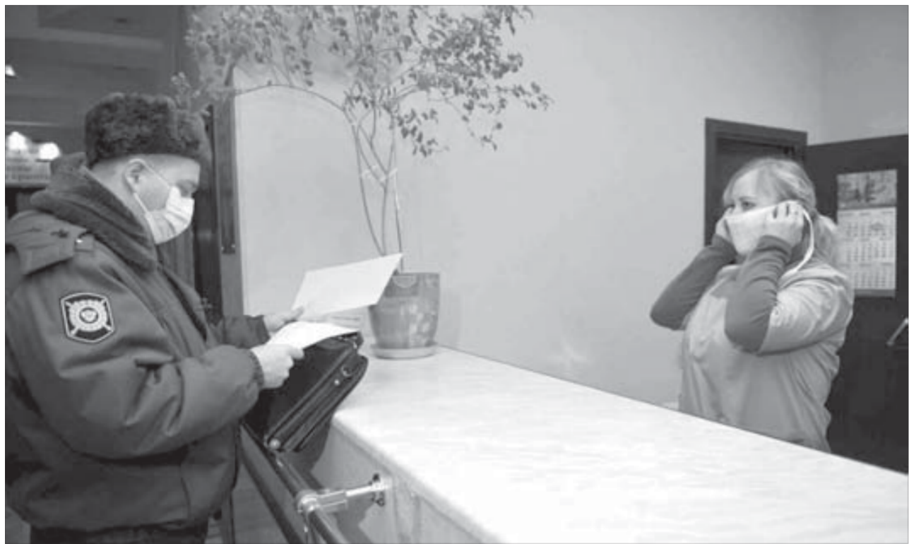
Некоторые используют маски самодельные...