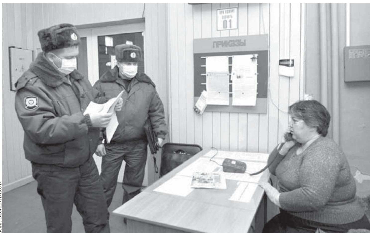
В спортзале на Октябрьской, 6а, масок не носят...