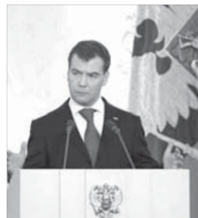
Президент за эффективность во все

Согласно национальному законодательству территория России располагается в 11 часовых поясах, со второго по двенадцатый включительно, с одинаковым временем в пределах каждого часового пояса. Время устанавливается как поясное