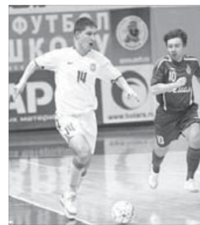
Нервы "Динамо" потрепали