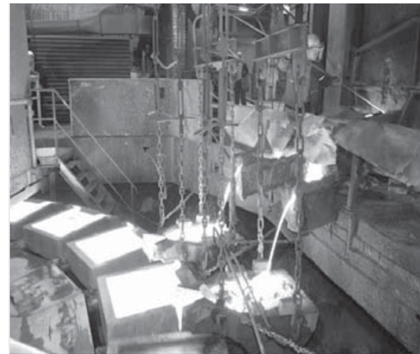
Серьезное производство требует серьезного отношения