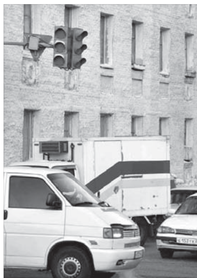
Неработающий светофор затрудняет движение

Никакой план не стоит того, чтобы калечить себе жизнь. Ведь не нужна ни высокая зарплата, ни уютный дом на материке, если зарплата или пенсия будет хватать только на походы в больницу, поликлинику и аптеки. Поэтому, прежде чем сделать неосмотрительный шаг, никогда не бывает лишним подумать, стоит ли подвергать риску себя и своих близких, свою жизнь и свое благополучие. Порой одно неверное движение может омрачить жизнь на долгие-долгие годы.