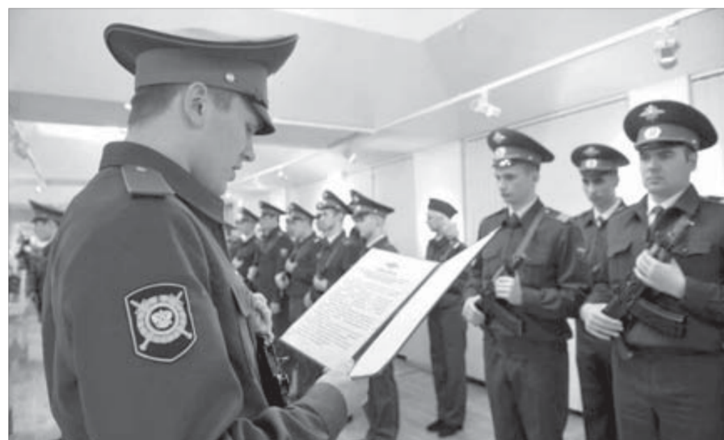
Присягу приняли 35 человек