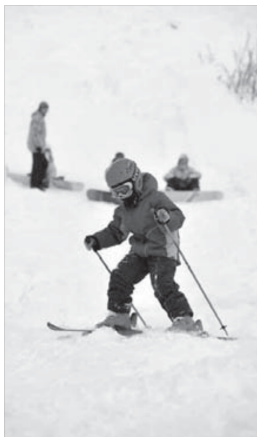
Не дожидаясь открытия

Прежде всего, по его словам, требуется реконструировать систему водоснабжения и водоотведения комплекса, обеспечить ее круглогодичное использование. Это позволит эксплуатировать туалетные комнаты внутри здания. Пункт проката, как уже упоминалось, должен переехать в более комфортное и отремонтированное здание. А для летнего отдыха планируется приобрести прокатные велосипеды и комплект пейнтбольного оборудования, задействовать летнюю спортивную площадку под летние командные виды спорта.