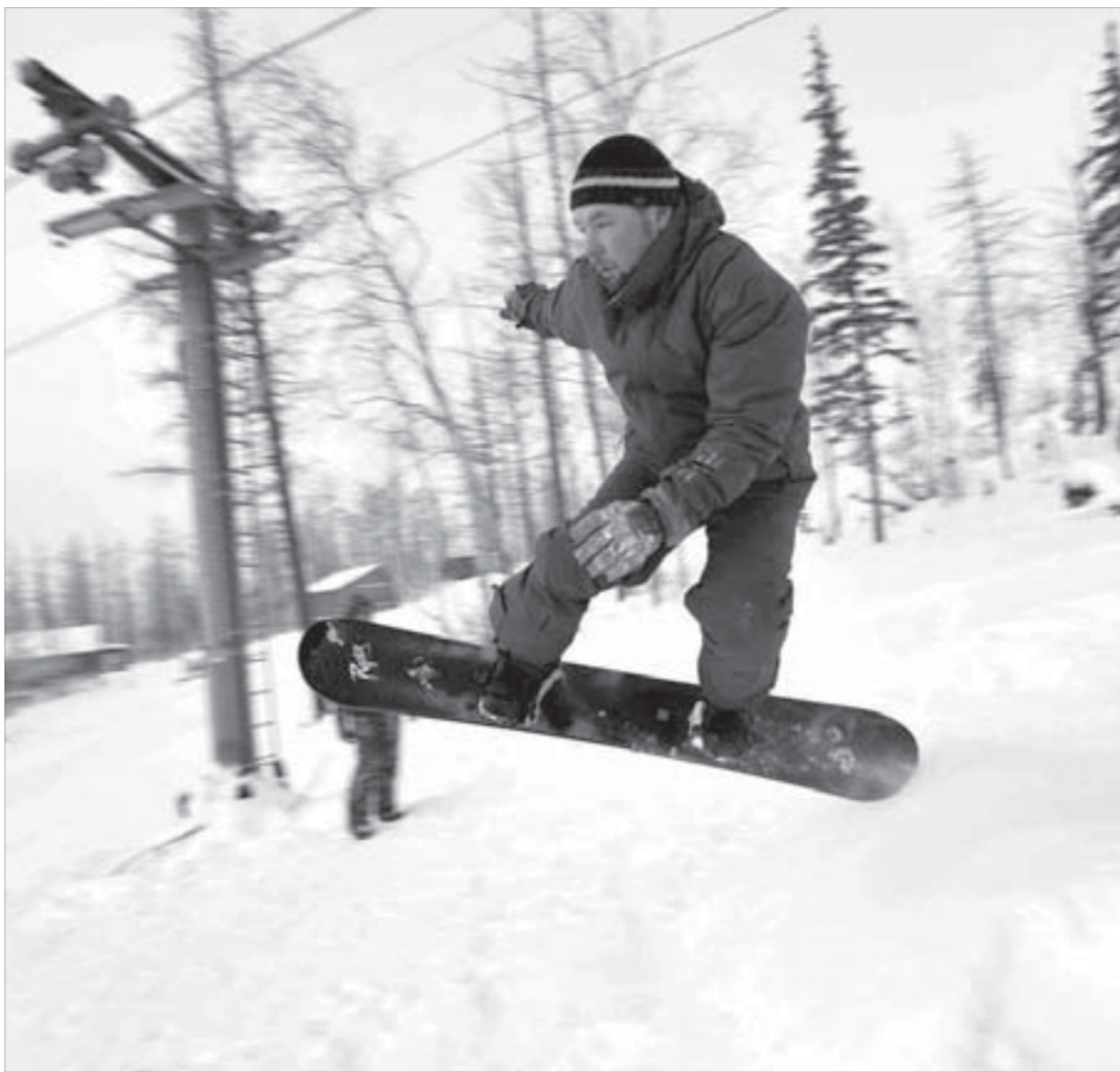
Сноубордист в полете

Мы хотим немного разгрузить главное здание, оставив там только камеру хранения, ремонт инвентаря, буфет, комнаты отдыха, – рассказывает Сергей. – Конечно, будет несколько неудобно, но, вспоминая, какая толпушка создается здесь в апреле и на майские праздники, я думаю, что