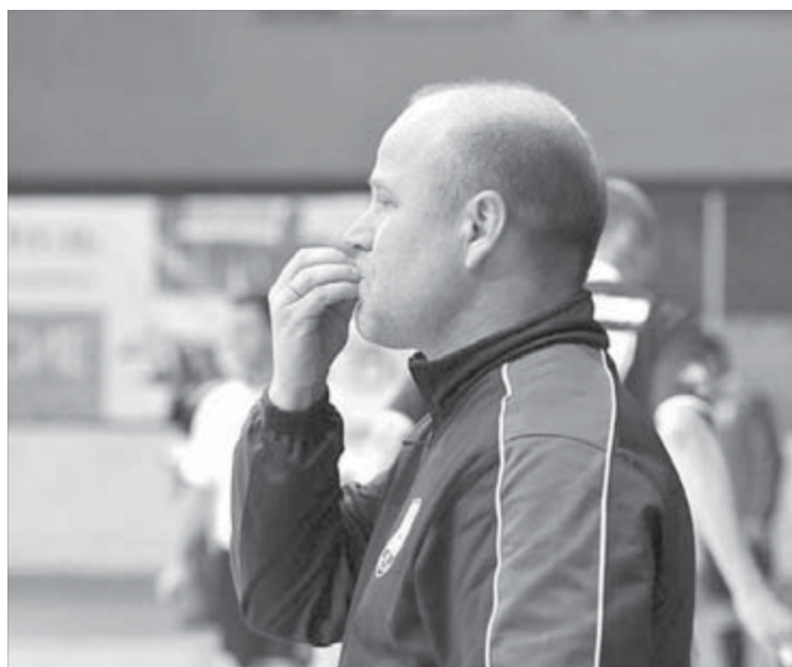
С ТТГ подопечные Алтабаева играли феерически