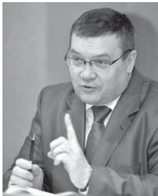
Не Талнах ли за нами?..

А вот по вопросу “О регистрации положения о фракции “Единая Россия” в городском совете” замечаний не высказывали. Возможность создания фракции в местном парламенте, по мнению депутатов, объективно существует, и народные избранники ею воспользовались. Из 34 депутатов 21 человек представляет партию “Единая Россия”, двое не членов партии выдвигались от “ЕР” и теперь работают в городском парламенте.