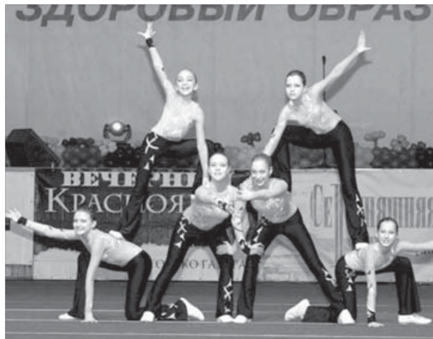
Они выбрали здоровье, долгие годы и красоту