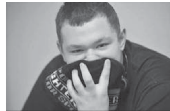
Бережемся подручными средствами