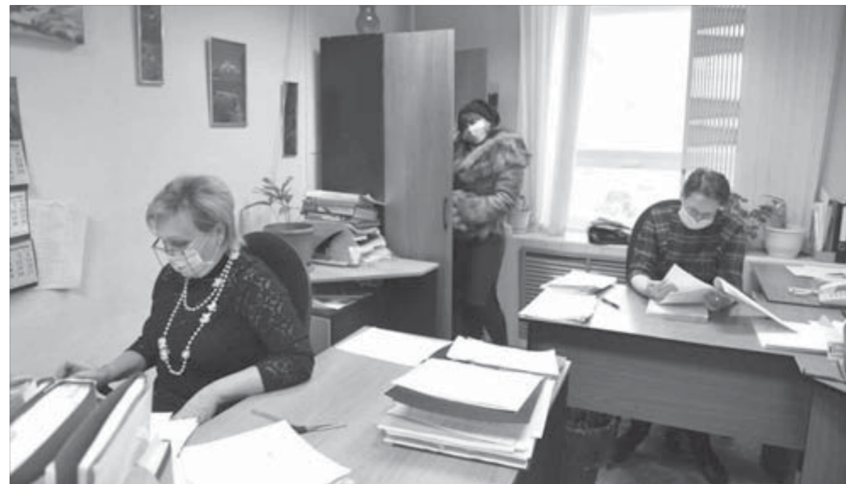
Новый элемент спецодежды – маска

Доходы в размере 4,5 млрд рублей от введения экспортной пошлины на никель заложены в проект бюджета РФ на 2010 год.