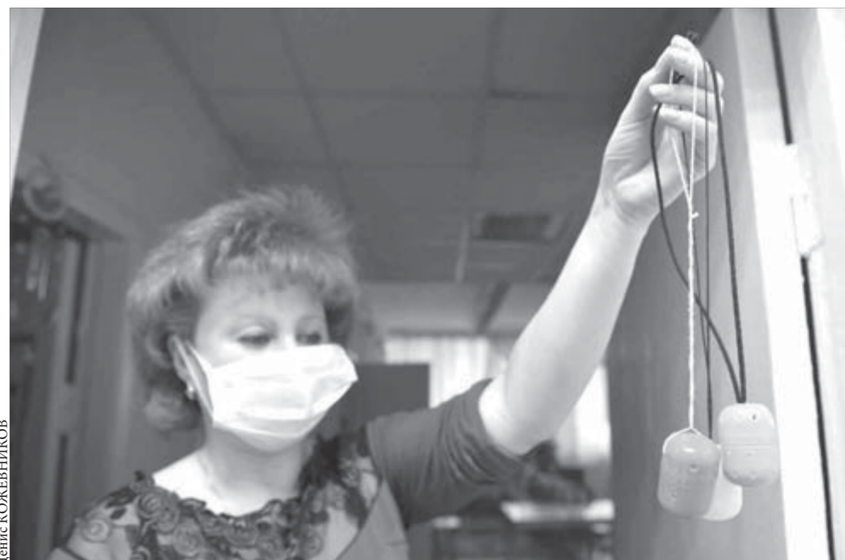
“Киндер-сюрприз” с чесноком