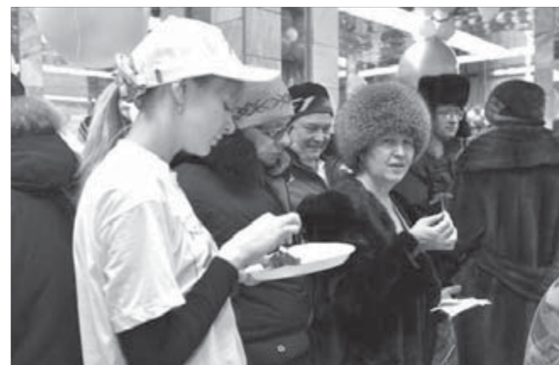
Перед покупкой проба обязательна