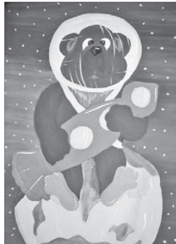
Мишка с ракетой – фантик для конфеты