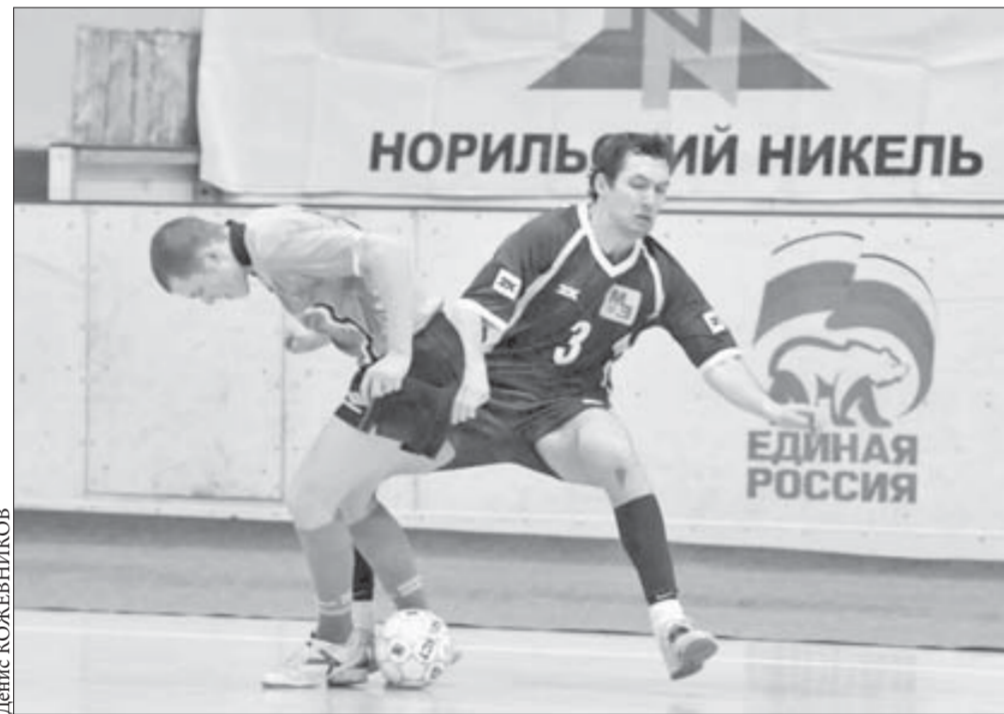
Борьба на турнире была напряженной

О ситуации с ОРВИ и гриппом в Красноярском крае читайте на 2-й странице ►