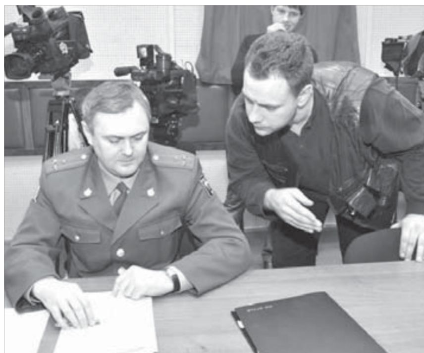
Журналисты всегда тесно сотрудничают с милиционерами