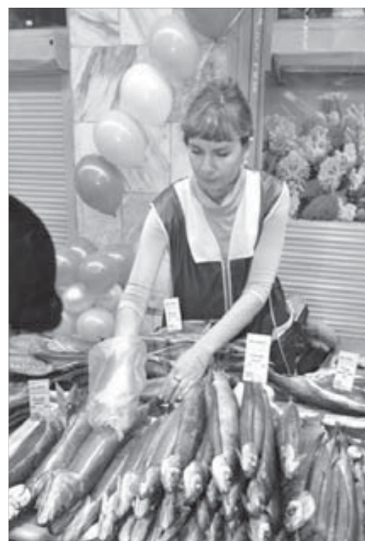
Товар должен «вкусно» лежать