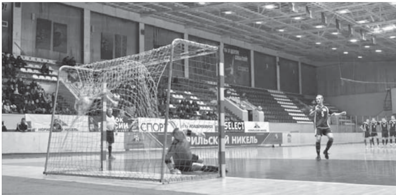
Судьба первого места решилась в серии пенальти