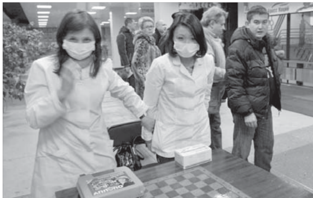
К атаке вирусов готовы!

По информации Министерства здравоохранения края, после отъезда Онищенко на заседании правительства, состоявшемся 6 ноября, представители всех ветвей власти обсудили межведомственное взаимодействие по форми-