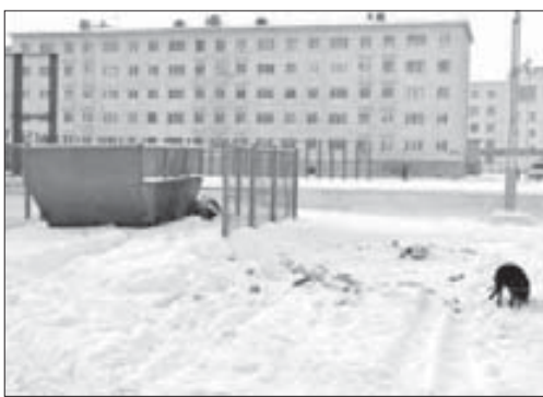
Голодные псы начеку