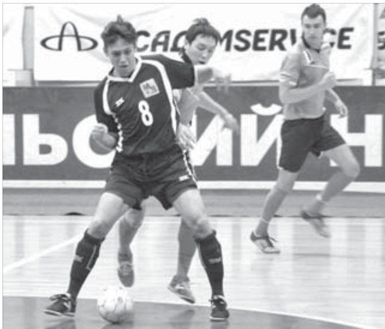
Парни с медного шансов соперникам не оставили