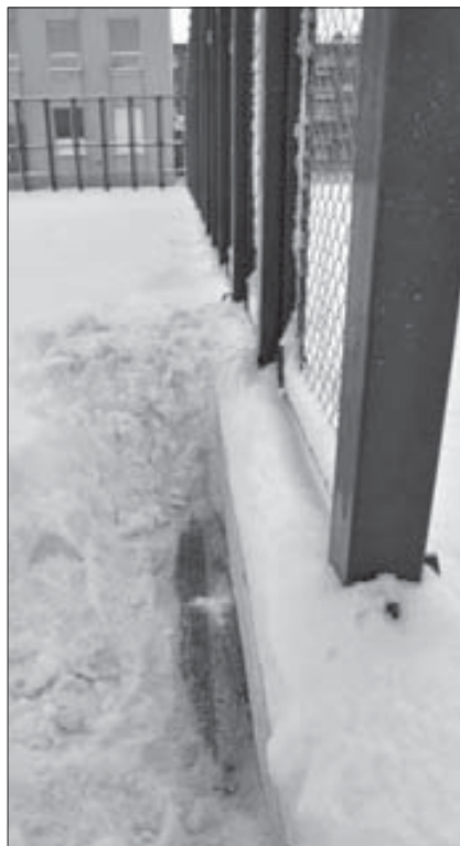
Снег разметке не помеха

Спортивная площадка стала подарком для Норильска в прямом смысле слова – ее торжественно открыли в День города. Спортсмены оценили ее – и простор, и наличие сразу нескольких разных “площадок в площадке”, а главное – специальное покрытие, которое при строительстве уложили на асфальт.