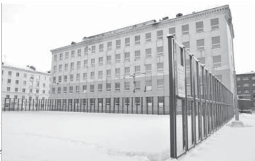
К началу декабря вместо снега на площадке будет лед

Как пояснили “ЗВ” в администрации города, каток на площадке появится к 1 декабря.