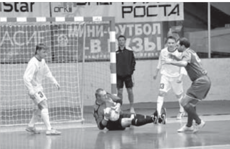
Удачная игра вратаря позволила "Таймыру" выйти в финал

Подробности финального матча, а также мнения о турнире его участников читайте в "ЗВ" в понедельник, 9 ноября