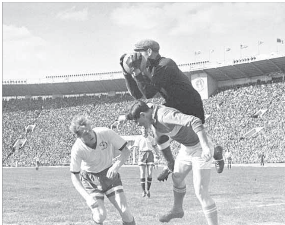
Яшин знал заранее, куда последует передача соперника

Он обладал феноменальной реакцией, а точнее, где-то на подсознательном уровне умел прогнозировать ситуацию. Вратарь-экстрасенс. Именно это экстрасенсорное чутье позволяло ему находиться в каждом игровом моменте в том самом месте, где проще и легче всего можно было овладеть мячом. Его игра в воротах была лишена всякой эффектности. Ему незачем было совершать дикие прыжки из одного угла в другой, чтобы париро-