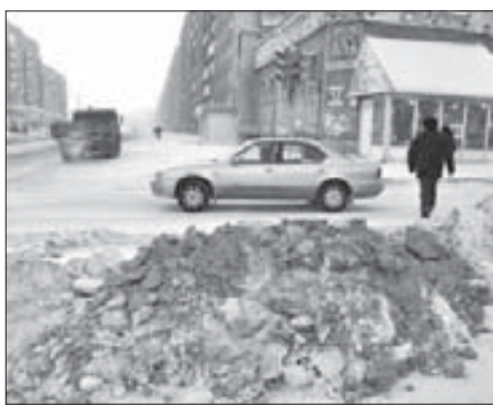
Прогулки с препятствиями