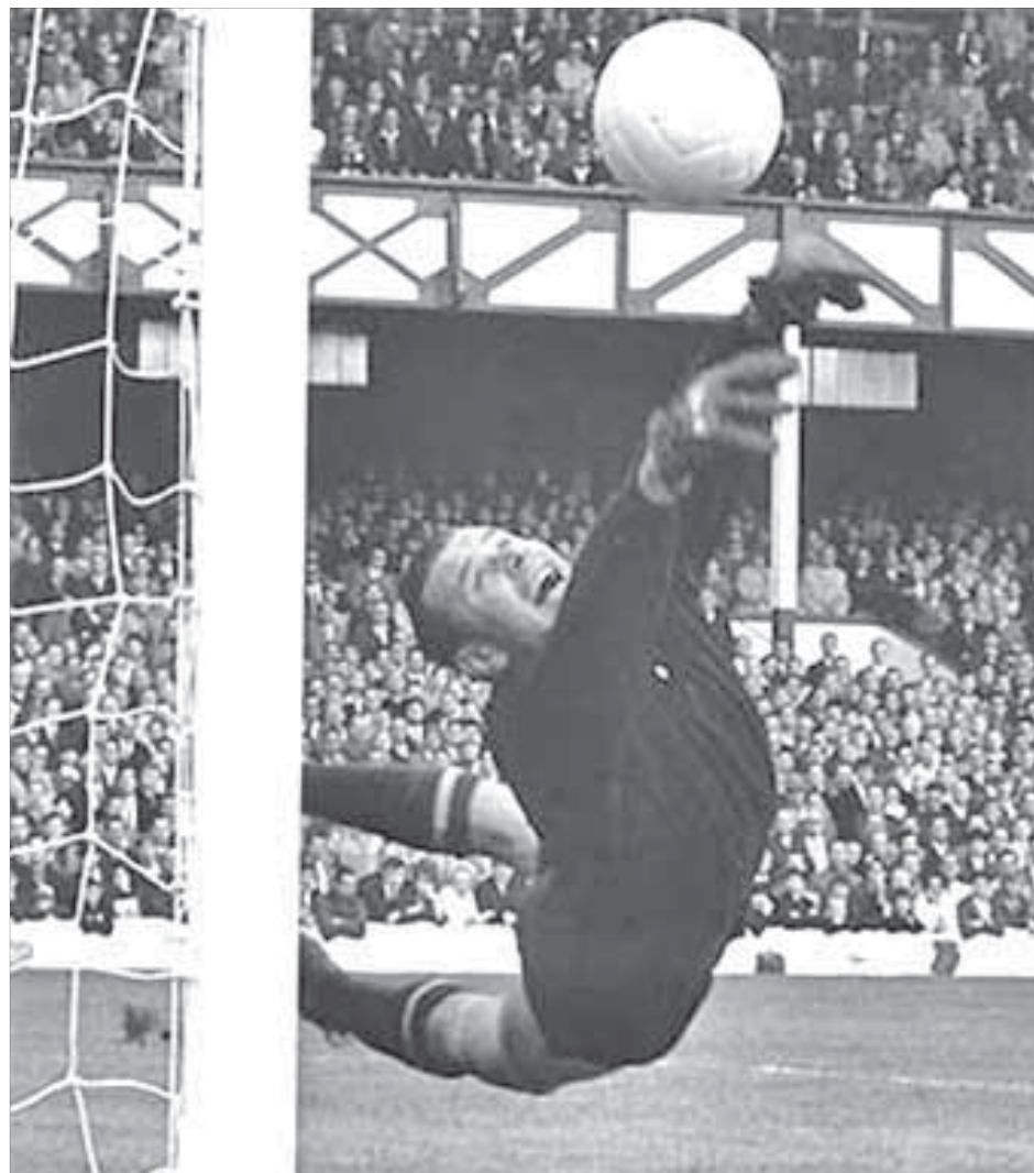
В игре легендарный Лев Яшин

Волей-неволей я оказался в динамовском сообществе, став ему родным не только по месту жительства, но и по принадлежности: свое баскетбольное образование, переехав из Сокольников, я продолжал уже в клубе “Динамо”. Жить в динамовском доме, играть за “Динамо” и не болеть за “Динамо” было бы с моей стороны предательством, даже более того, не по-соседски. Дети коммунальных квартир, мы воспринимали соседей почти как родственников. А моими со-