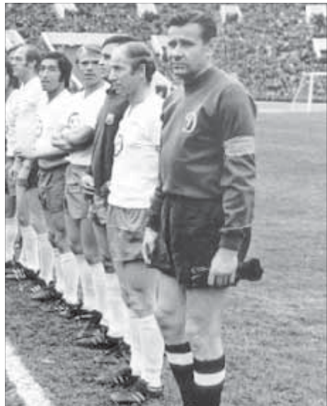
Капитан сборной мира

По прошествии многих лет, уже будучи близко знакомым с Яшиным и Савдуниным, я спросил у них: “А помните ли вы, как я...” И тот и другой пожалы плечами. Оказы-