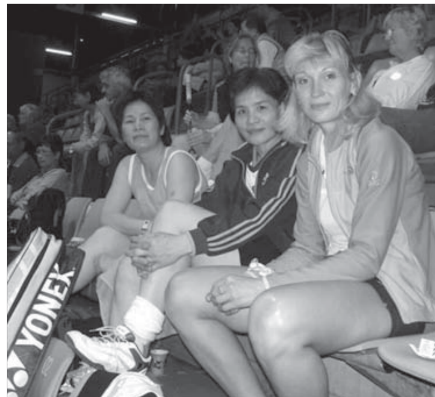
В миксте партнером Елены стала индонезийка

Курс акций ОАО "ГМК "Норильский никель" – 3823,8 рубля. ОАО "Полюс Золото" – 1550 рублей.