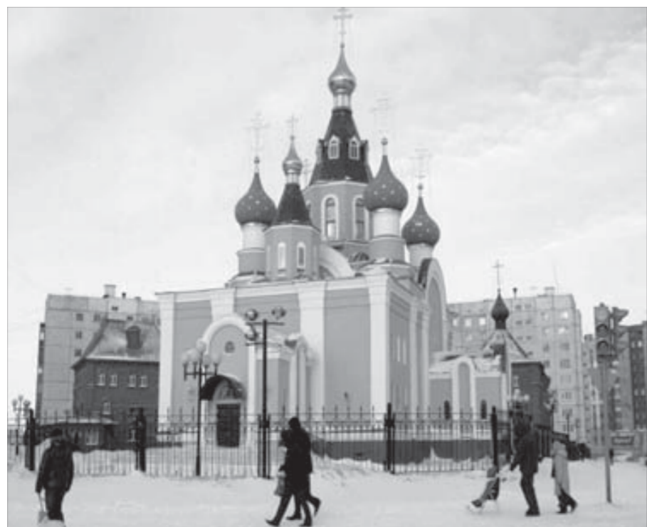
С завершением строительства собора в Норильске стало светлее

За 20 лет в соборе происходило немало разнообразных событий, но одно остается неизменным – особое, трепетное отношение к образу Божией Матери “Всех Скорбящих Радость”, который расположен в правом киоте в центре храма. Каждый воскресный день за вечерним