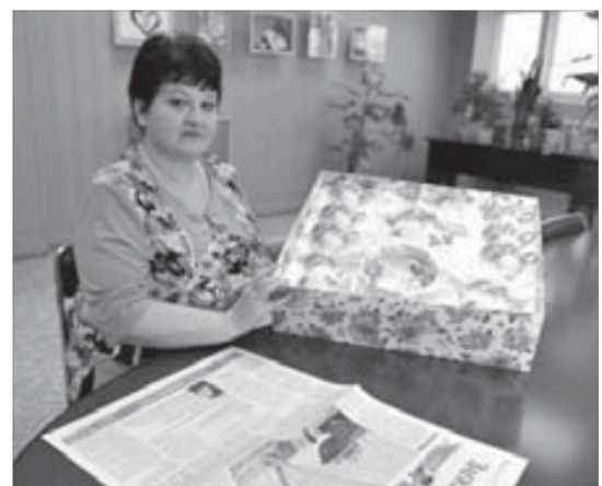
Сервиз займет почетное место