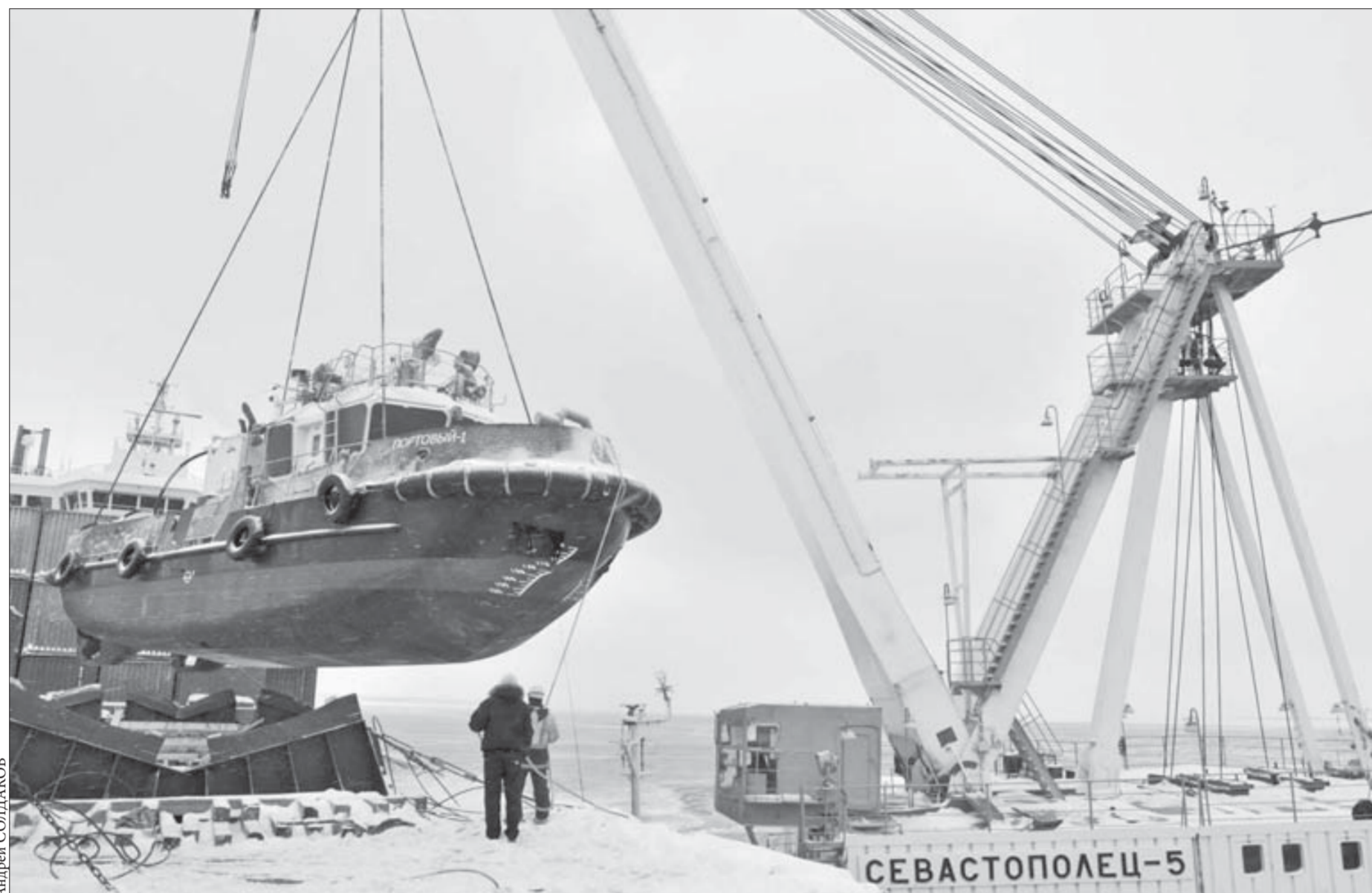
Не часто над Енисеем парят буксиры...

Всех, кто стал свидетелем ДТП, просьба откликнуться по телефонам 43-54-59 или 43-54-58.