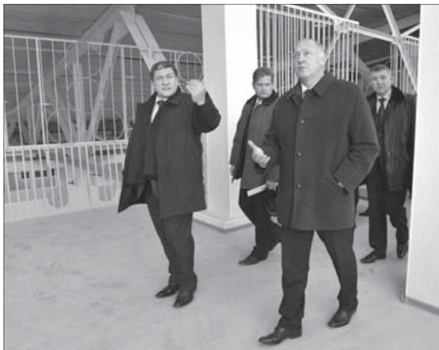
Пожокий детский сад есть только в Алматы