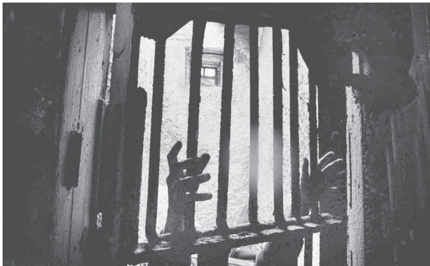
В игре можно будет прикоснуться к тайнам Норильлага

Победителем становится команда, выполнившая наибольшее количество заданий и, соответственно, набравшая большее количество очков. Сегодня пожелали участвовать в игре 12 команд, а это более 200 человек.