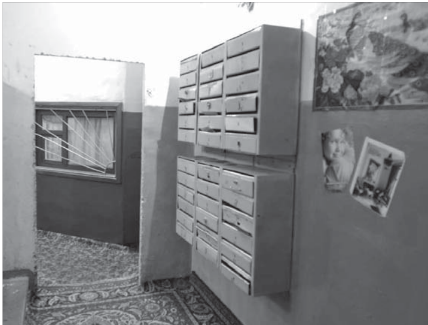
В таком подъезде просто грех сорить