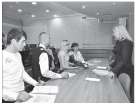
О дальнейших шагах сказали отдельно

Теперь, когда все формальности позади, молодым семьям предстоит приятные хлопоты по выбору квартиры и ее обустройству. Сказать, что норильчане не скрывали радости, – ничего не сказать. Они были счастливы!