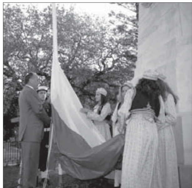
Российский триколор на греческой земле