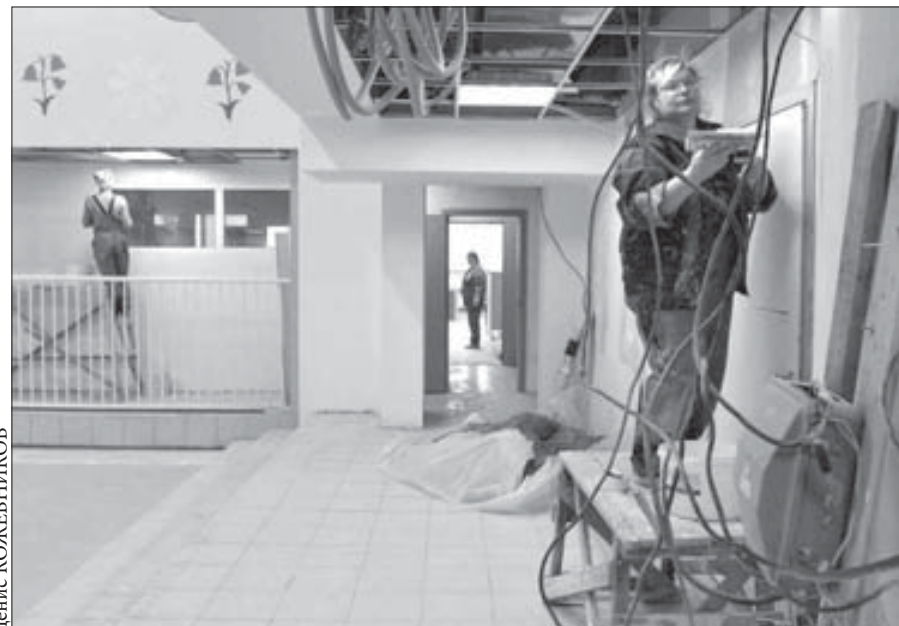
Отделка помещений подходит к концу

По первоначальному графику в детском саду №45 "Улыбка" уже должен был завершиться капитальный ремонт. Однако сдача объекта дважды переносилась, ввиду чего глава Норильска вчера поставил подрядчикам жесткие сроки – ремонт детсада должны завершить к 16 ноября.