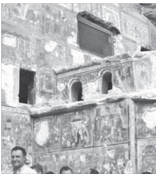
Следы греческой истории

А в августе этого года впервые с момента создания общества несколько греков-норильчан по приглашению АГООР (Ассоциация греческих общественных объединений России, возглавляемая депутатом Государственной Думы РФ Иваном Саввиди) совершили поездку к одной из почитаемых православных святынь – в монастырь Панagia Сумела. Он расположен на территории современной Турции, близ Трабзона. Событие масштабное – около 1500 человек из регионов России, Киргизии, Казахстана, Белоруссии и самой Греции приняли участие в па-