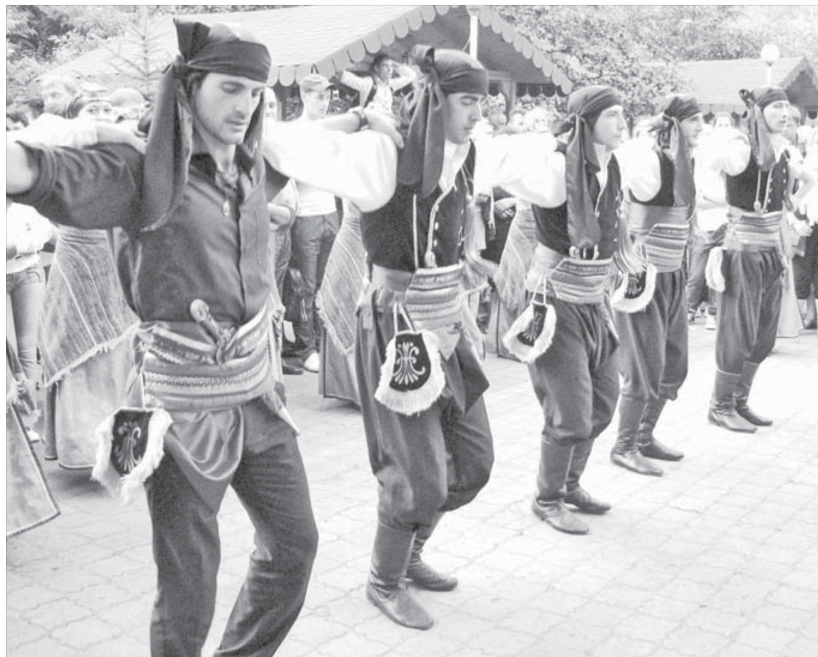
Какой праздник без национальных танцев!