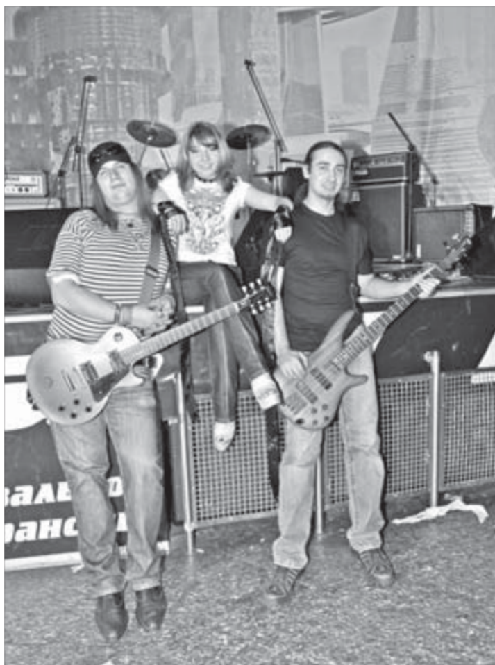
Хедлайнеры концерта – "Мистерия"

кто постарше, лишь криком и свистом подбадривали музыкантов. Вообще, молодежь в Норильске колоритная.