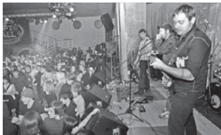
Рок в Норильске очень любят играть и слушать

ККК "АРТ" – традиционная площадка для фестивалей норильского рока. Не самая плохая, но и не самая лучшая. Звукорежиссеры традиционно жалуются на плохой звук – "выводятся" некоторые инструменты в пустом зале трудно, при орудии зрители и поклонники – тоже непростое. Одно дело проводить в зале дискотеки, другое – дать живое звучание рока.