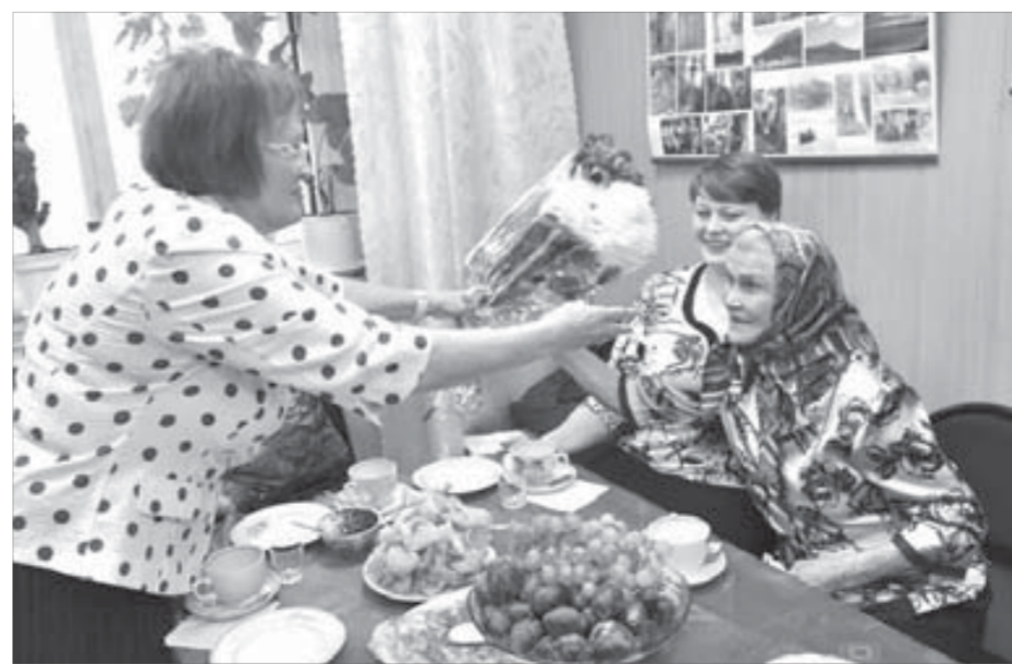
Поздравление с юбилеем

Совсем недавно по приглашению Музея истории освоения и развития ННР члены общественной организации "Защита жертв политических репрессий" побывали на спектаклях московского театра "Возвращение". Обе постановки – "Дороги, которые мы не выбрали" и