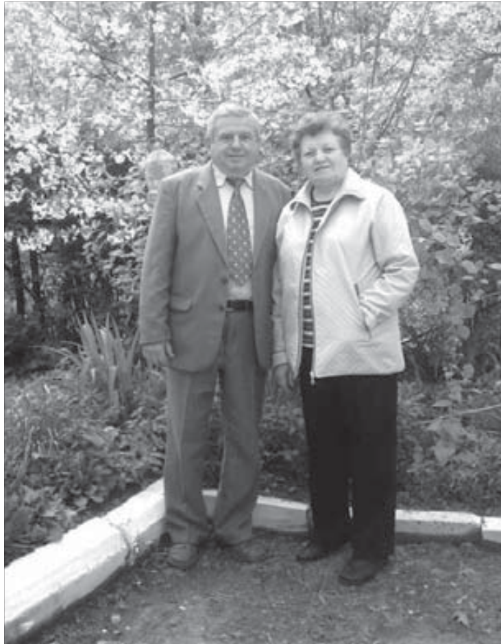
Вместе 46 лет

Несколько счастливых и плодотворных лет принесли свои результаты. Молодого режиссера пригласили из деревни в шахтерский город Нововольск стать художественным руководителем Дворца культуры. И квартиру молодой семье, увеличившейся к тому времени еще на одну дочь, дали