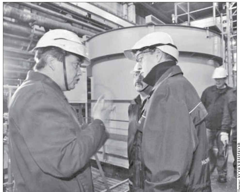
Новое оборудование установлено в измельчительно-флотационном цехе НОФ