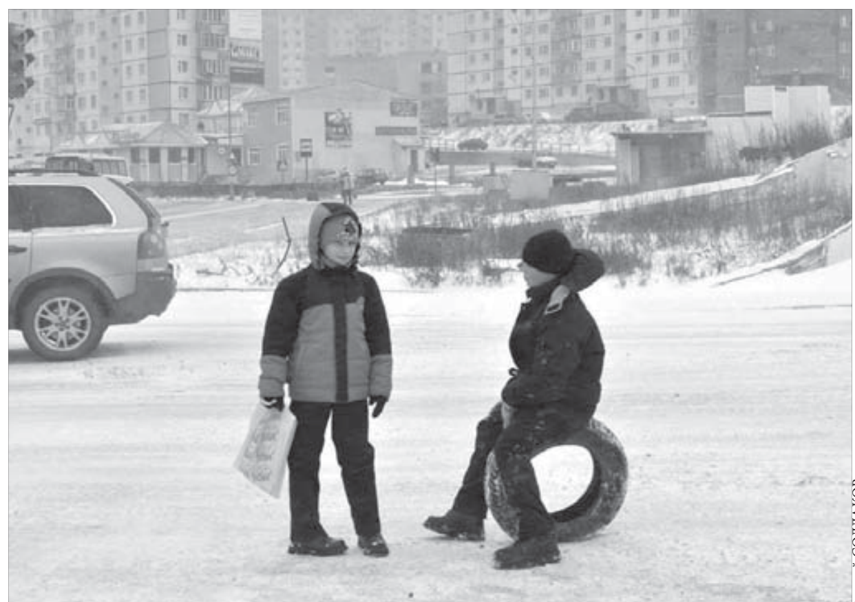
Норильские дети гуляют в любую погоду