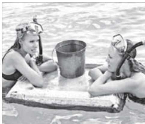
Беззаботная комедия с Жаном Рено в роли одного из наставников-мучителей.

Про что: Четыре супружеские пары отправляются на райский остров Бора-Бора в рамках специальной программы, направленной на укрепление семейных уз. Только одна пара действительно собирается работать над тем, чтобы совершенствовать отношения в браке. Остальные просто решили воспользоваться случаем, чтобы отдохнуть и развлечься. Не тут-то было! Психологические тренинги на острове влекут за собой обязанность, включая курс навыков совместной жизни в 6 утра и прочие прелести, иначе – прощай, Эдем!